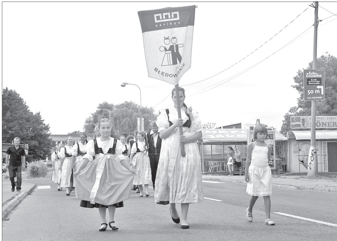
Błędowanie w korowodzie zespołów na turczańsko-teplickim deptaku.

– Organizatorzy nazwali go rewelacyjnym. Zresztą dla wszystkich członków zespołu był to nie tylko występ, ale też świetna zabawa. I to było widoczne – dodał prezes. Prawdziwą furorę zrobili solowe