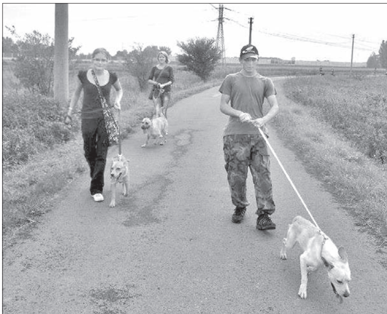
Wszystkie psy lubią spacerować.