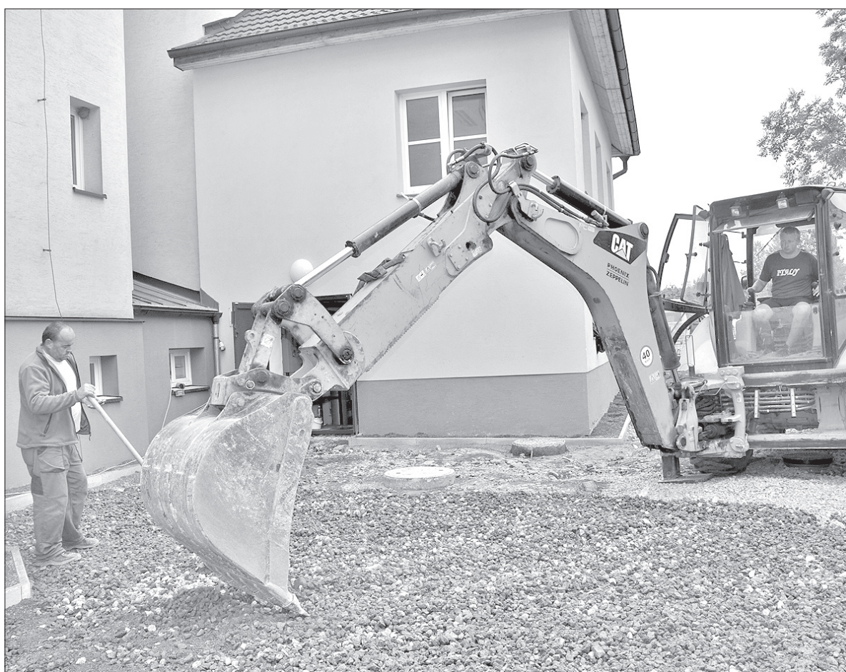
Za bystrzycką szkołą właśnie powstaje nowy brukowany plac.

Remont szkoły w 85 proc. sfinansowany został z funduszy unijnych, natomiast na remont przedszkola placówka sama zaoszczędziła, ograniczając wydatki. – Nasze przedszkole pęka w szwach. Chcemy zwiększyć liczbę dzieci z 55 do 65. Do tego potrzebny był nowy lokal. Dlatego na poddaszu zlikwidowaliśmy biuro, wyburzyliśmy ściankę działową i zrobiliśmy nową salę. W styczniu przyszłego roku otworzymy nowy oddział – opowiada dyrektor. – Najważniej-