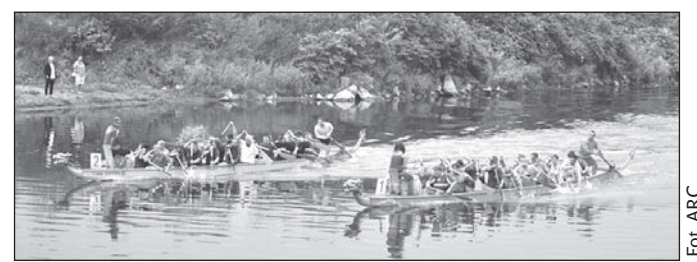
Wszystko wskazuje na to, że tegoroczna edycja wyścigu smocznych łodzi powtórzy sukces z ub. lata.

Nagrody zostaną wręczone zwycięskim ekipom jeszcze w tym samym dniu podczas popołudniowej imprezy towarzyszącej na Rynku w Starym Boguminie. W programie wystąpi m.in. orkiestra dęta huty bogumińskiej oraz zespoły taneczne, teatralne i muzyczne. (sch)