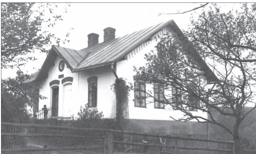
Polska Szkoła Ludowa w Oldrzychowicach.

Nauczyciel żyjący na wsi bierze udział w życiu obywatelskim swojej gminy i niejedno przypadnie mu w udziale i zdarza się, że zostaje organistą, skarbnikiem kasy raifaisenowskiej lub prowadzi agendy ubezpieczeniowe swych współobywateli, zostaje on wciągany w te role dla braku odpowiedniej osobistości, która by te funkcje prowadzić mogła. Za wykonywanie tej czynności nauczyciele otrzymują jakieś nieznaczne wynagrodzenie.