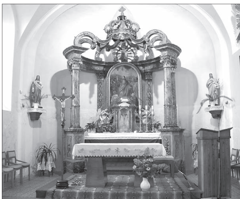
Ołtarz kościoła pw. Opatrzności Bożej w Koniakowie.

W koniakowskim kościółku znajdziemy również przedmioty sakralne