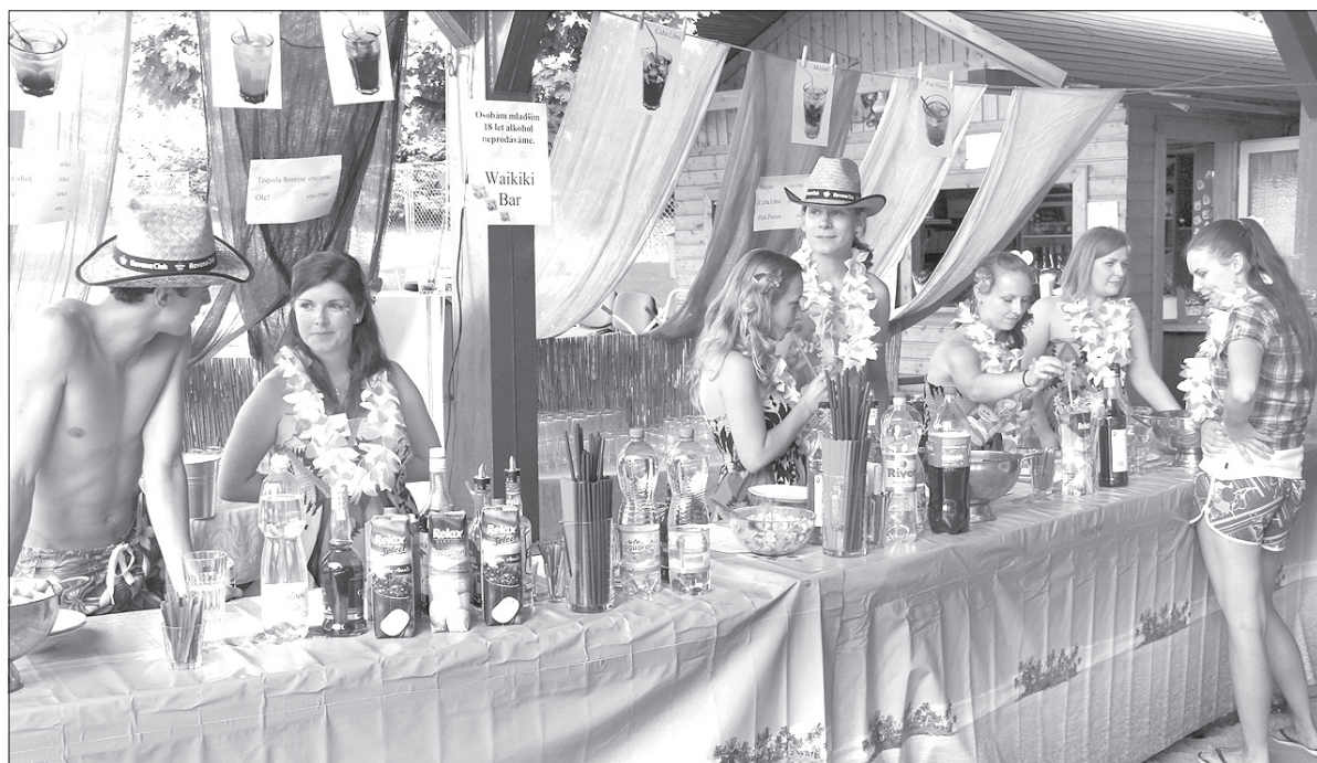
Waiki Bar Klubu Młodych „Gróń” oferował całą gamę drinków.

W poszukiwaniu ciepłego plażowego piasku nie trzeba jeździć na drugi koniec świata. W sobotę część parku przed Domem PZKO w Bystrzycy zamieniła się w egzotyczną plażę. Co prawda zabrakło morza, ale ten mankament rekompensował z nawiązką program imprezy – VI Hawaii Party, zorganizowanej przez Klub Młodych „Gróń” przy Miejscowym Kole PZKO w Bystrzycy oraz bar „Destiny”.