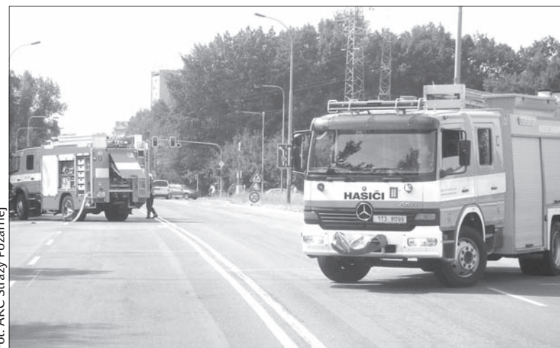
Wozy strażackie zablokowały ul. Dělnicką.

Na ul. Dělnickéj w pobliżu hipermarketu Globus na dwie godziny wstrzymano ruch kołowy. Pojazdy kierowano na drogi objazdowe. (dc)