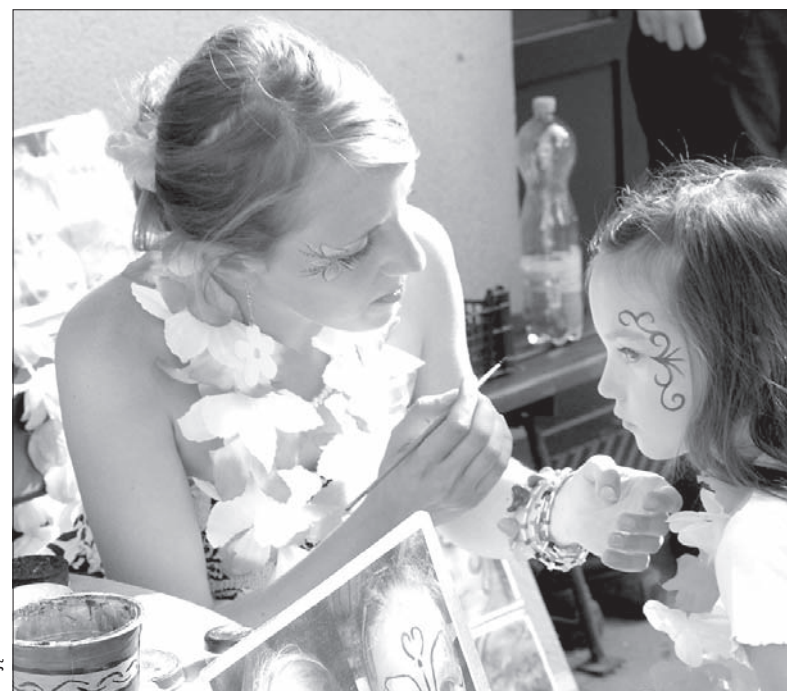
Na Hawaii Party nie zabrakło atrakcji dla dzieci.

W bystrzyckiej Hawaii Party bierze udział głównie młodzież oraz rodzice z małymi dziećmi. Dla najmłodszych klubowicze przygotowali bogaty program – stoiska sprawnościowe, malowanie na twarzy oraz własnoręczne malowanie koszulek.