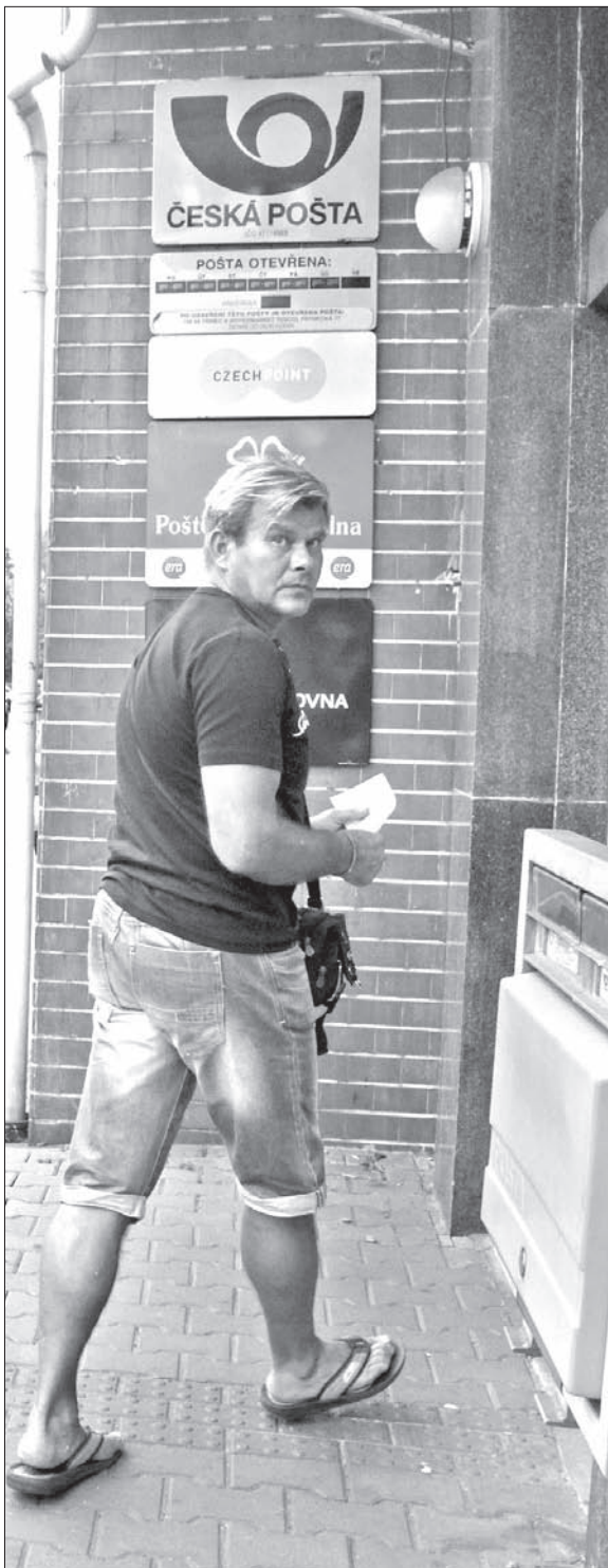
Czeska Poczta walczy o każdego klienta. Dziś zarabia głównie na listach poleconych, usługach elektronicznych.