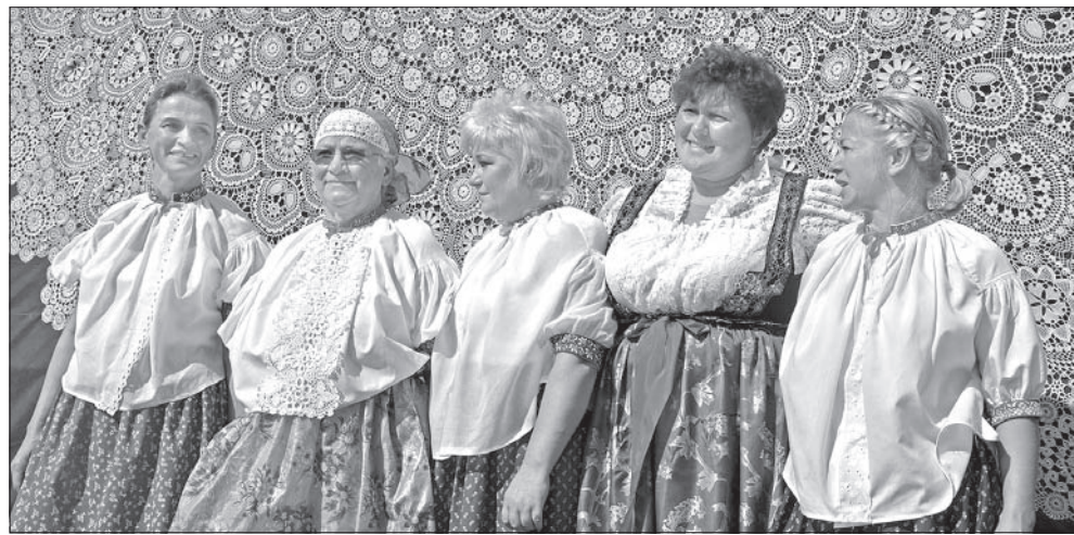
Gigantyczna koronka jest dziełem tych pań.

smę, żeby skoordynować całość. Najważniejsze, żeby to dzieło zobaczyło jak najwięcej osób – wyraziła nadzieję ostatnia z wymienionych.