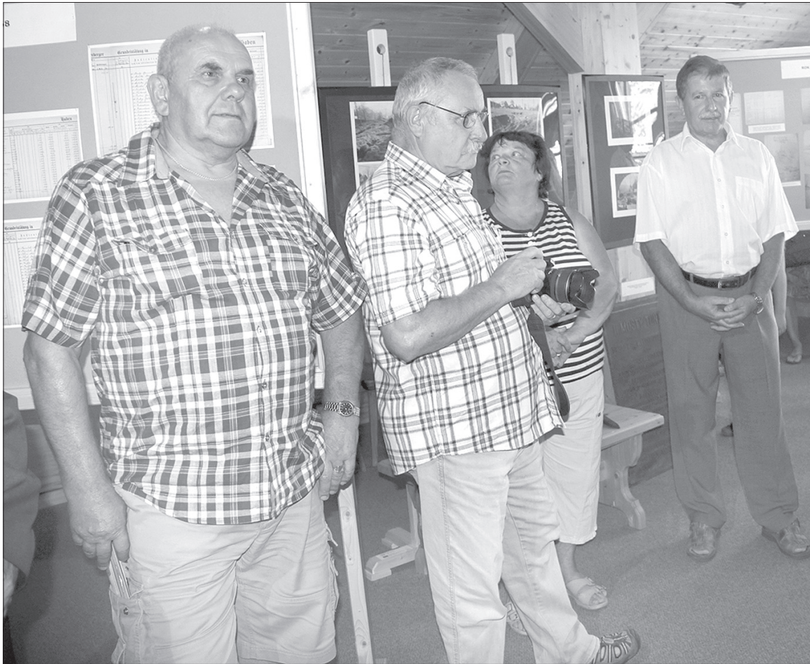
Nowszą historię tuneli w Mostach ilustrują kolorowe zdjęcia.

Wystawa o Tunelach Jabłonkowskich przybliży ich historię począwszy od 1868 roku, kiedy rozpoczęto wykupywanie parceli pod pierwszy tunel. Jego budowa trwała niespełna dwa lata, od 1871 roku mogły tędy przejeżdżać pierwsze pociągi.