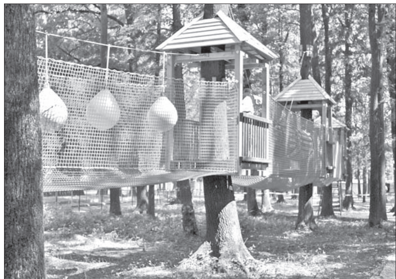
Od dzisiaj w Trzyniecu można korzystać z nowego parku linowego.

Na drewnianych palach lub pieńkach postawione są drewniane domeczki, które służą do odpoczynku lub do wyprzedzania innych uczestników zabawy. Do niektórych domków prowadzą schody, którymi można dostać się do środka. Urząd Miasta planuje, że wkrótce wybuduje kładkę łączącą centrum linowe z terenem minigolfa oraz z kąpieliskiem.