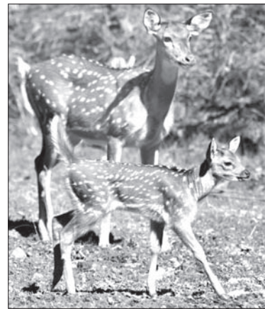
Jelenie axis w ostrawskim zoo.

Jeleni axis to największy i najbardziej kolorowo zabarwiony gatunek ssaków parzystokopytnych z rodziny jeleniowatych. Jeleni ten jest najczęściej spotykanym przedstawicielem rodziny w Indiach, Sri Lance i u podnóża Himalajów, został też sprowadzony przez człowieka do Australii, Nowej Zelandii i Stanów Zjednoczonych. Zasiadła lasy monsunowe, cierniste zarośla oraz otwarte tereny trawiaste.