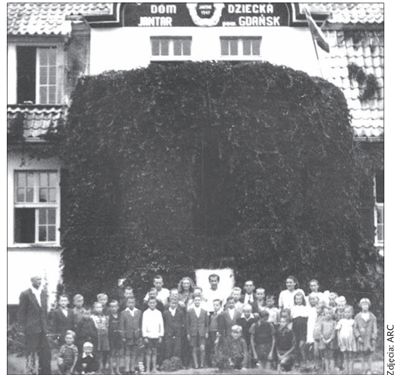
Rok 1948. Koloniści z Zaolzia przed Domem Dziecka „Jantar”