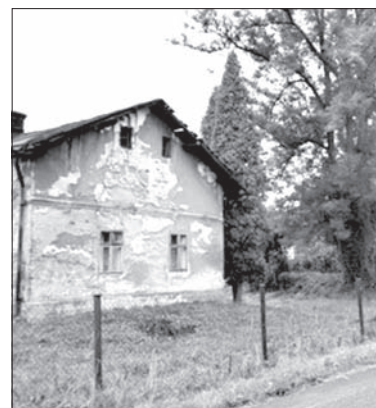
Dziesięcioro urzedników wyruszyło w sobotę na kontrolę w Starym Mieście. (ep)

Z drugiej strony problem ten dotyczy tylko części tego obszaru, większość mieszkańców Starego Miasta