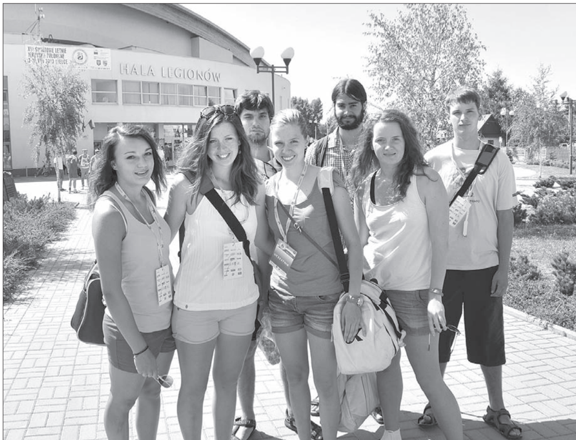
Część naszej ekipy siatkarskiej przed nowoczesną halą Legionów.