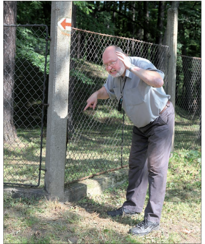
Minionej zimy w tym miejscu na Zielonym znaleziono ślady niedźwiedzia.