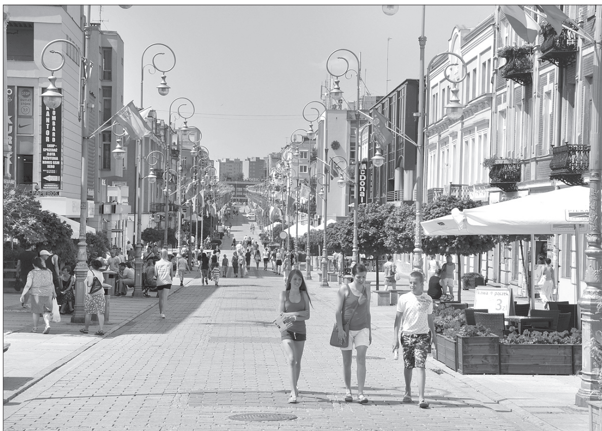
Centrum Kielc robiło wrażenie.

Cieślak zdradził również, że zimą Polonusi z całego świata będą mogli przekonać się o walorach kolejnych polskich miast. Wiadomo już bowiem, że zimowe igrzyska polonijne odbędą się pod koniec lutego w Jeleniej Górze. Ich uczestnicy będą zaś rywalizować w Karkonoszach na arenach w Karpaczu i Szklarskiej Porębie. WITOLD KOZDŃ