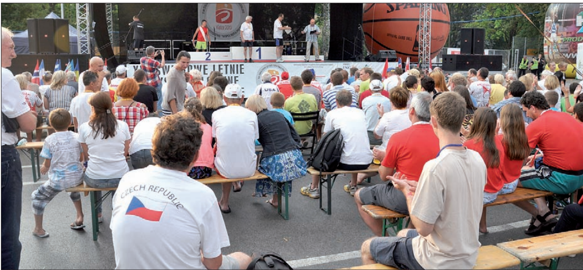
Polacy z Republiki Czeskiej należeli do najbardziej widocznych uczestników olimpijskich zmagani w Kielcach.