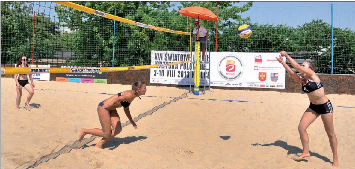
Turniej siatkówki plażowej należał do najbardziej widowiskowych konkurencji.