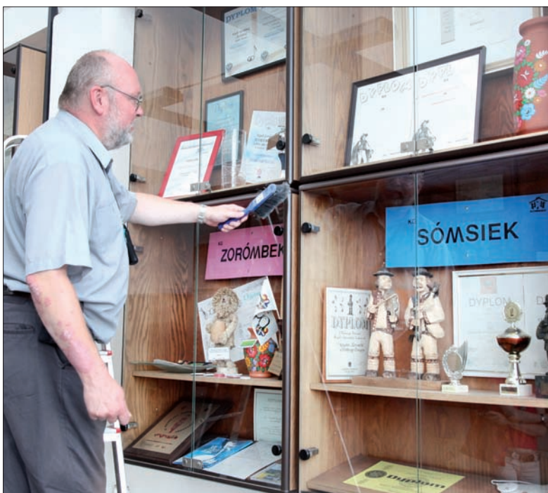
W witrynach na czwartym piętrze gimnazjum za każdym kawałkiem szkła, metalu, plastiku czy papieru kryją się dziesiątki ludzi i setki godzin pracy.

zjum Polskiego w Czeskim Cieszynie, w miejscu, gdzie dyrygent szkolnego chóru „Collegium Iuvenum” i „Canticum Novum” spędził na