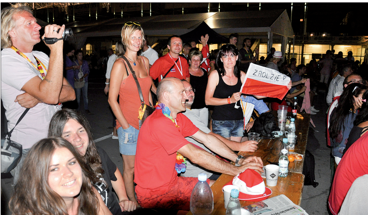
Na placu obok stadionu piłkarskiego Korony Kielce uczestnicy mistrzostw bawili się codziennie do późnego wieczora.