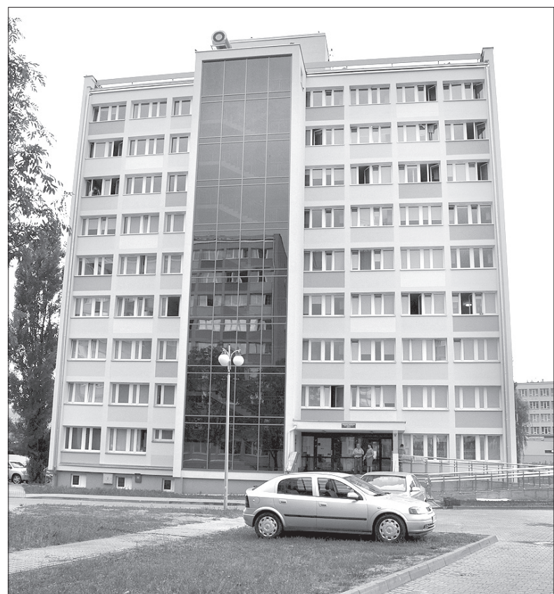
Akademik, w którym mieszkała nasza reprezentacja.