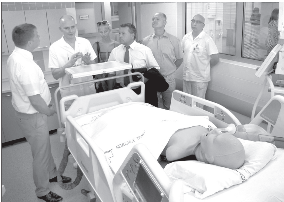
W czwartek w trzynieckim szpitalu na Sośnie otwarto zmodernizowany oddział anestezjologii i reanimacji.

Remont trwał przez cztery miesiące i był wspólną akcją inwestycyjną województwa oraz Szpitala Trzyniec. Jego koszt wyniósł 20 mln koron. Modernizacja oddziału anestezjologii i reanimacji przyniosła zasadnicze zmiany w ustawieniu łóżek, techniki medycznej, miejsc magazynowych oraz pracowniczych. W ten sposób powstało sześć odrębnych stanowisk oddzielonych od siebie przeszklonymi ścianami, wyposażonych w centralny system monitorujący funkcje życiowe, pompy infuzyjne czy respiratory do prowadzenia wentylacji. Wszystkie urządzenia są tak zainstalowane, żeby dostęp do pacjenta był możliwy ze wszystkich stron. Z kolei szklane przepierzenia zapewniają pacjentom większą prywatność oraz bezpieczeństwo, a bardziej sprawna klimatyzacja będzie w ciągu całego