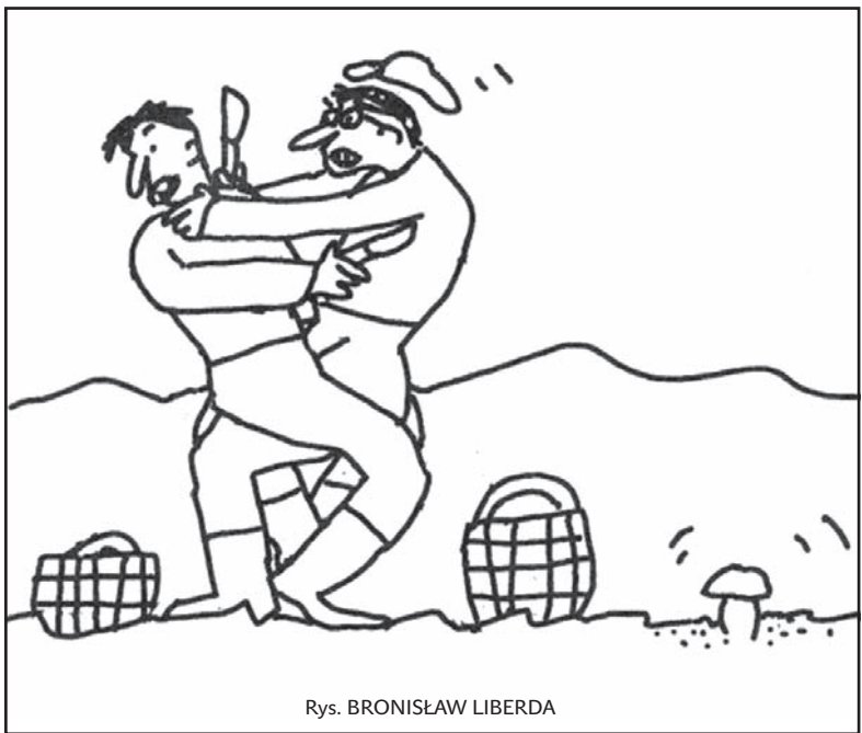
Rys. BRONISŁAW LIBERDA