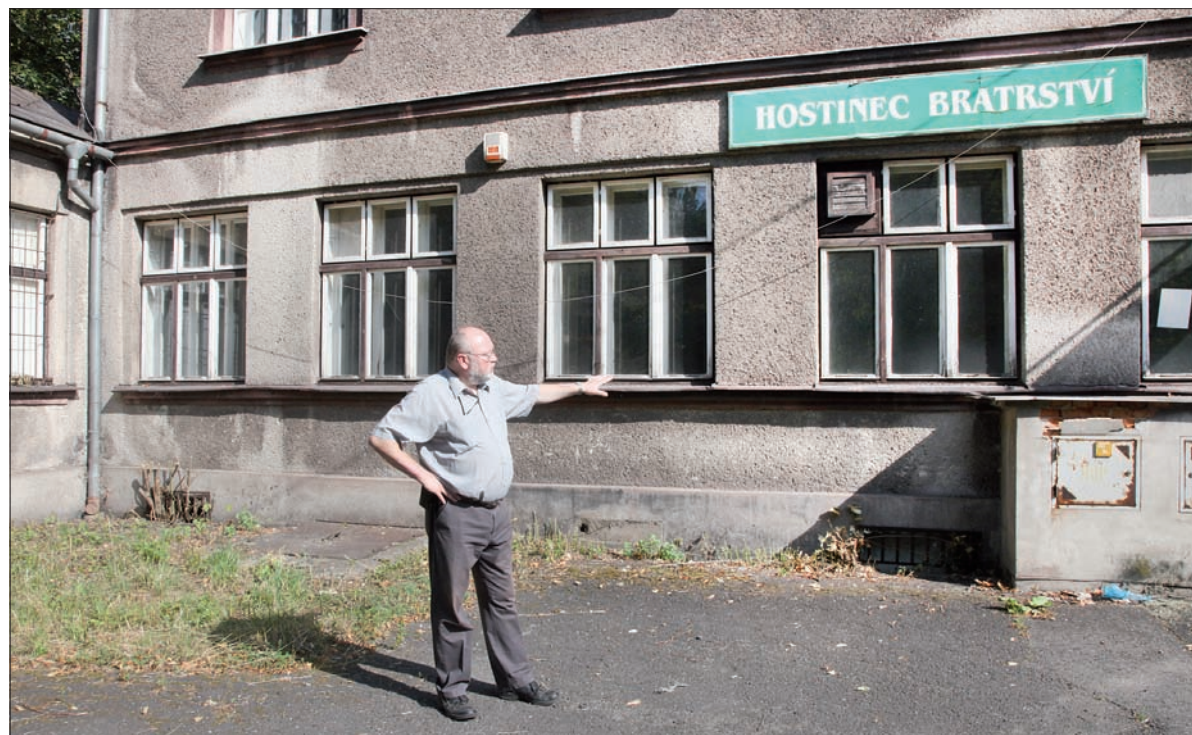
Restauracja u Braci stoi zaniedbana. Dawniej MK PZKO Leszna Dolna miało tu siedzibę.