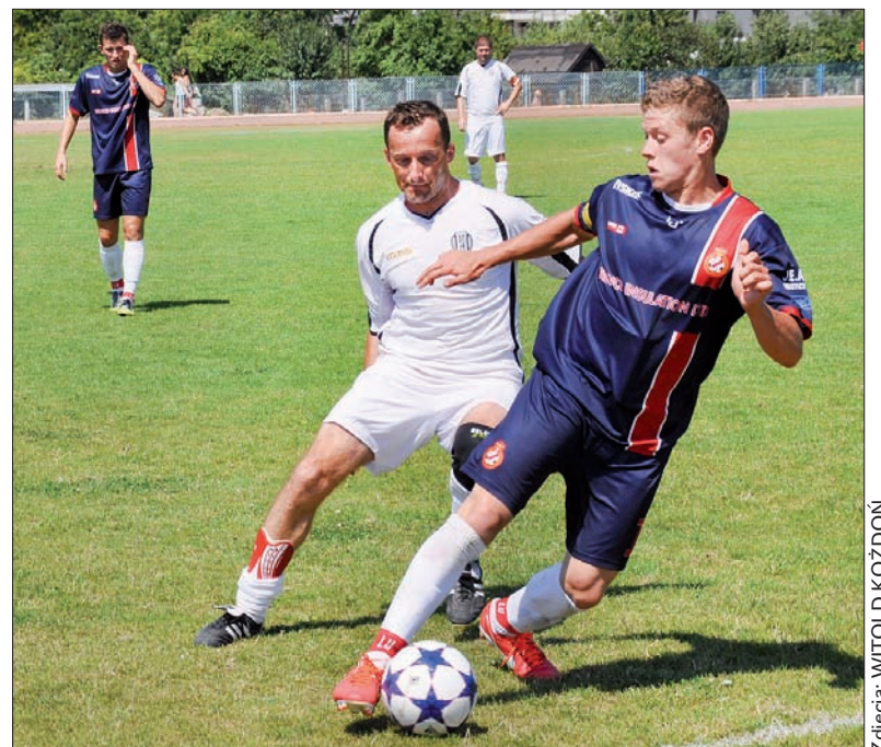
Piłkarze z Zaolzia (białe dresy) walczyli dzielnie, ostatecznie jednak przegrali półfinał z Argentyną i dziś zagrają o trzecie miejsce.