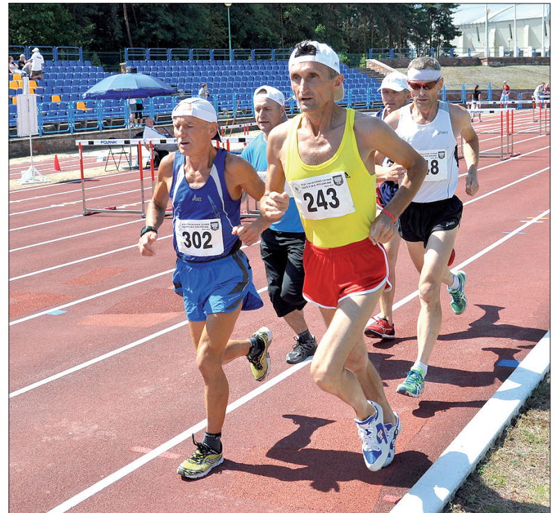
Tym razem lekkoatleci zmagali się nie tylko z rywalami, ale i temperaturami przekraczającym na bieżni czterdzieści stopni