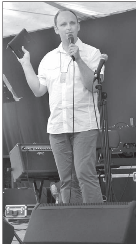
Pastor Jiří Chodura podczas ewangelizacji.

– Ważne jest, kogo wpuścisz do swojego życia, na czyich radach polegasz. Być może twoimi doradcami są ludzie, którzy potrafią pięknie mówić o sensie życia, o tym, jak masz zaplanować swoją przyszłość, jak masz wziąć sprawy w swoje ręce, ale w rzeczywistości chcą wykorzystać twoje zdolności, twoje ciało, twoje najlepsze myśli, a kiedy osiągną swój cel, odrzucą cię jak ostatnią niepotrzebną rzecz. A może szukałeś porady u jakiegoś okultysty,