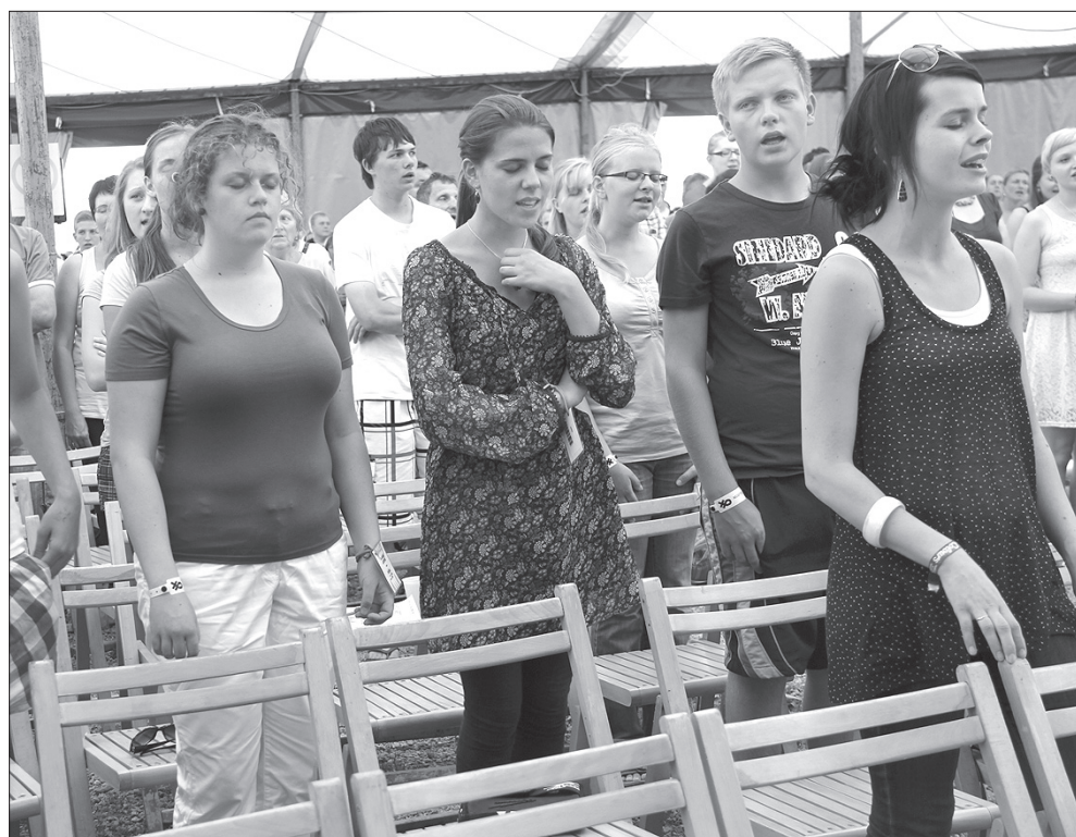
Młodzież chwali Boga wspólną piosenką.