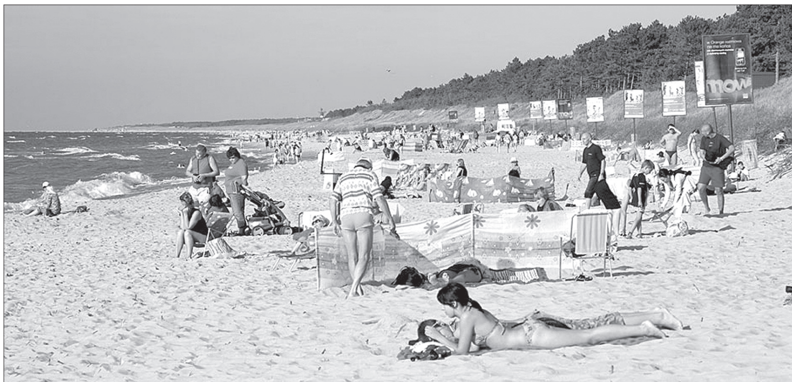
Piękna pogoda przyciąga ludzi na plaże. Ratownicy ostrzegają, by uważać na fale i prądy.

PROBLEM: W Bałtyku utonęła w tym sezonie rekordowa liczba osób. Od soboty do poniedziałku na całym wybrzeżu życie straciło w wodzie aż 16 osób. To najtragiczniejszy bilans od lat. Jak podkreślają ratownicy, przyczyną większości utonięć jest ludzka nierozważność, nie docenianie morza oraz alkohol. Kto wybiera się nad wodę, powinien przypomnieć sobie kilka podstawowych zasad bezpieczeństwa.