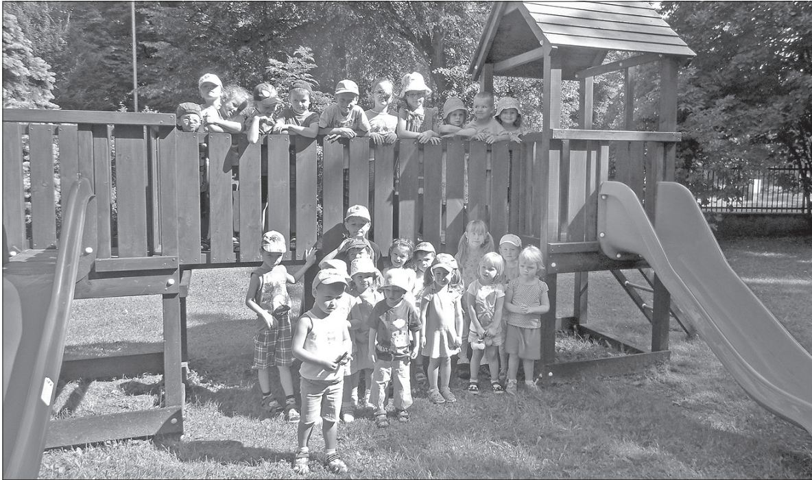
W ciepłe dni przedszkolaki z Czeskiego Cieszyna bawią się w ogrodzie przedszkola przy ul. Moskiewskiej.