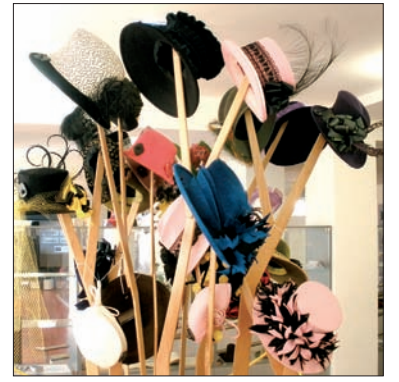
Nowy Jiczyn to miasto kapeluszy.

Kolejną godzinę warto sobie zarezerwować na obejrzenie interaktywnej wystawy o produkcji kapeluszy, która znajduje się w Domu Laudona na rynku. Na panelach obejrzymy krótkie filmiki o poszczególnych etapach produkcji kapeluszy, możemy wziąć do ręki materiał oraz półprodukty w różnych fazach opracowania. Większość pań i dziewczyn najwięcej czasu spędzi prawdopodobnie w drugiej sali, która służy jako przymierzalnia kapelu-