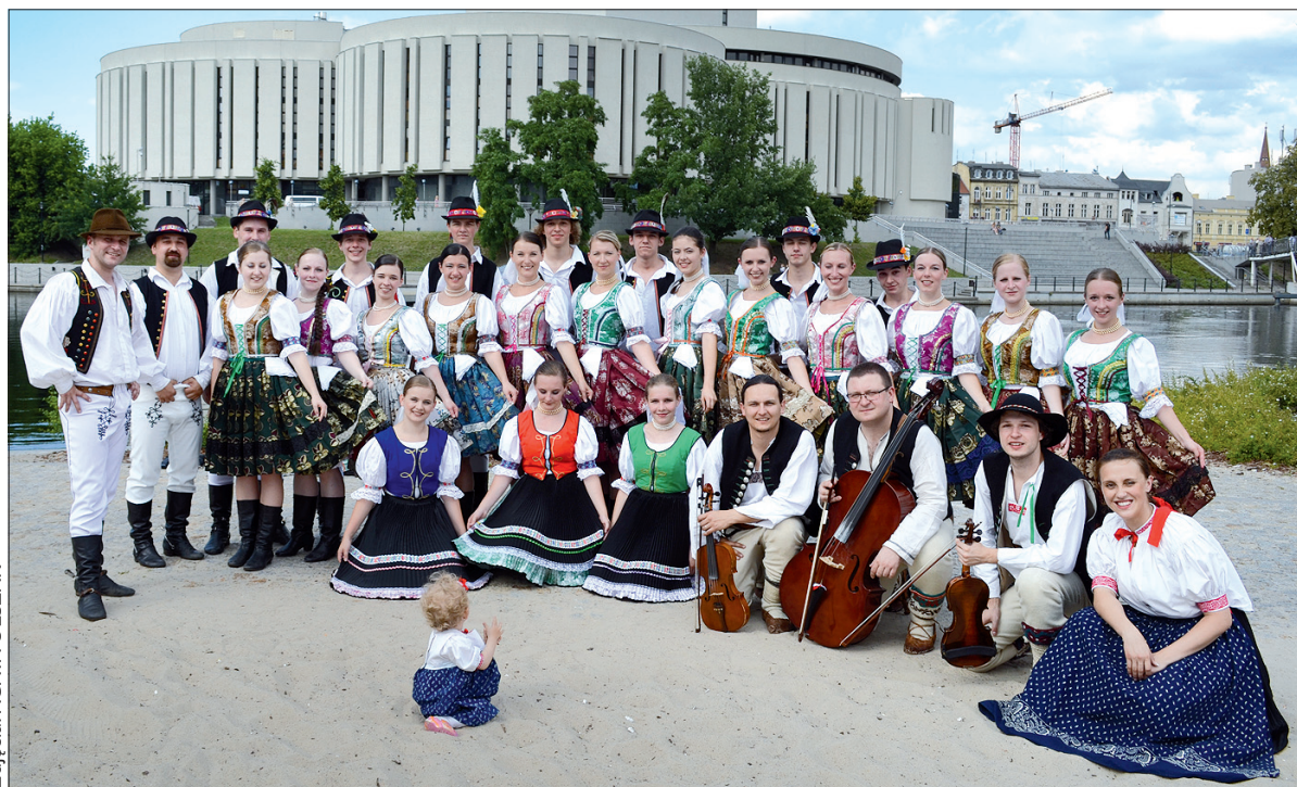
„Bystrzyca” na tle gmachu Opery Nova w Bydgoszczy.