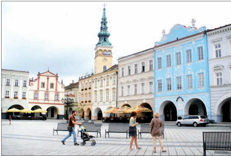
Fragment nowojiczynskiego rynku.

Nowy Jiczyn obchodzi w tym roku 700. rocznicę założenia. Z 1313 roku pochodzi pierwsza pisemna wzmianka o mieście. Król Jan Luksemburski nadał mu wówczas prawo do pobierania cła i myta. W swoim czasie – jeszcze w I połowie XIX wieku – Nowy Jiczyn był ważnym ośrodkiem administracyjnym, gospodarczym i kulturalnym. Niestety – jak podają źródła historyczne – jego mieszkań-