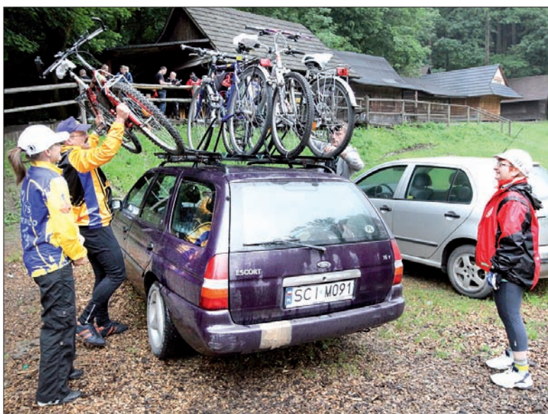
Rower można przewozić m.in. na dachu samochodu.