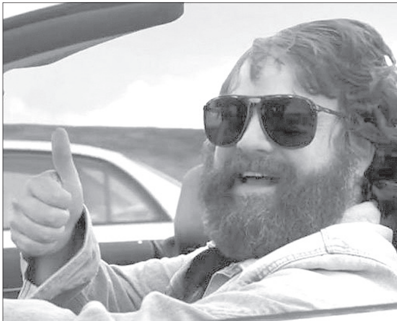
Kac Vegas 3

(wybitny po raz kolejny Zach Galifianakis) w trzecim Kacu daje pokaz definitywnego debilizmu, ale czyż właśnie nie brodaty Grek z syndromem uzależnienia emocjonalnego postarał się o sukces pierwszych dwóch odsłon tej komedii? Zaraz na wstępie Allan za kierownicą ciężarówki uśmierca przewożoną w przyczepie żyrafę, ustawiając poprzeczkę znów bardzo wysoko. Członkowie Greenpeace i Towarzystwa Ochrony Zwierząt mogą jednak spać względnie spokojnie. Tym razem zdecydowanie mniej jest w filmie zwariowanych scen ze zwierzakami w roli głównej. Zapomnijcie o tygrysie z Kaca 1, o małpce z „dwójki” w Bangkoku, w ostatniej części trylogii śmieszny tylko żyrafa i bojowe koguty. Twórcy filmu zdecydowali się też na nieco inny schemat fabuły. Nie ma wątku wesela, a „komedia drogi” sprowadza się do krótszych, bardziej lub mniej wypointowanych scen i dialogów dotyczących ratowania Douga z siateł Johna Goodmana. Lubię Todda Phillipsa, bo to reżyser, który nie boi się krytyków filmowych. Próżno szukać w Kacach intelektualnego przekaz – nie ma powiewu Woody’ego Allena ani elegancji Jiřego Menzela. Mimo wszystko przyziemny humor też może być śmieszny. Nie wstydę się łez, które wylałem w kinie krztuszając się ze śmiechu. Każdy facet marzy o paczce, w której hasło „jeden za wszystkich, wszyscy za jednego” nie sprowadza się wyłącznie do wspólnego chłania wódki.