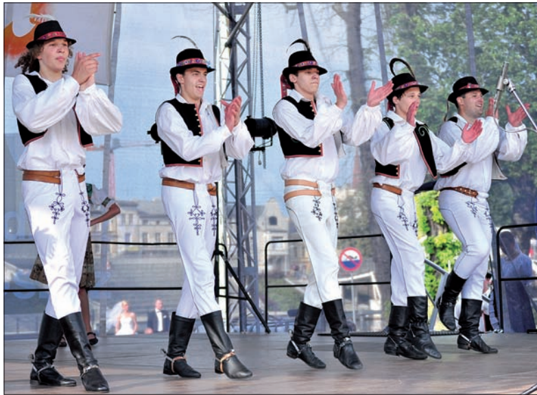
Tańce wschodniosłowackie, zwane „čapáše”.

W poniedziałek po przyjeździe do Bydgoszczy tancerze „Bystrzycy” wzięli udział w Wieczorze Narodowym, podczas którego po raz pierwszy spotkali się w plenerze z pozostałymi uczestnikami. Kolejne dni to były próby i występy w Bydgoszczy i Tucholi. – Piękny był wtorkowy wieczór inauguracyjny w bydgoskiej Operze Nova, poprzedzony prze-