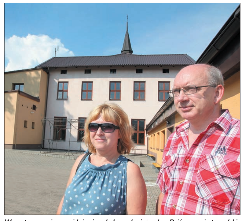
W centrum gminy znajduje się szkoła pod wieżyczką. Dziś uczą się tu polskie i czeskie dzieci oraz przedszkolaki.