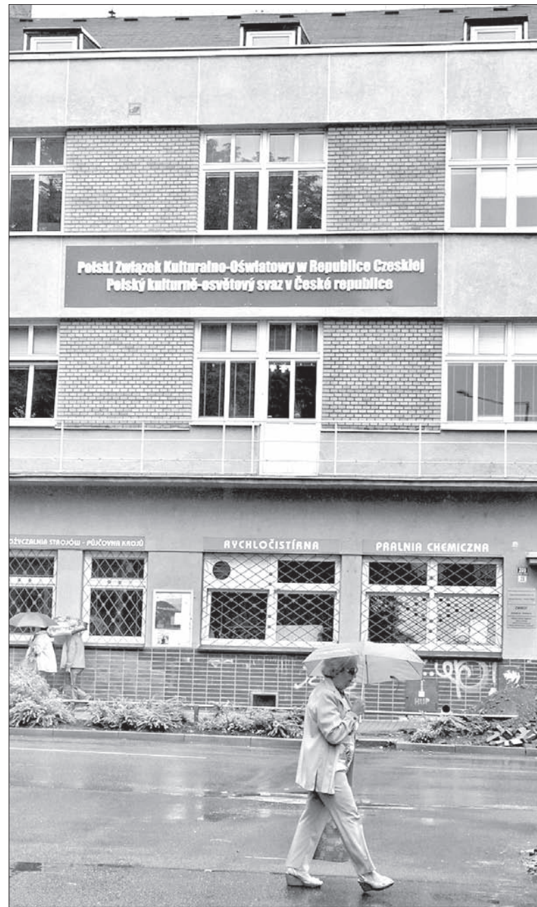
Na fasadę siedziby ZG PZKO przy ul. Strzelniczej powróciła nazwa organizacji.

– Obecnie czekamy na reakcję ze strony władz czeskich w ramach programu „Zielona dla oszczędności”. My z tej strony wszystkie obowiązki spełniliśmy: zaciepliliśmy budynek i strych, odremontowaliśmy dach, wymieniliśmy okna i drzwi. Teraz czekamy na to, jak wywiąże się z obowiązków czeskie państwo – podkreśla prezes ZG PZKO. (kor)