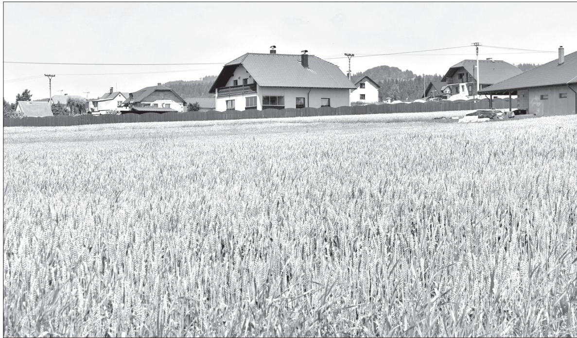
W górskich miejscowościach tany zboża sąsiadują z nowo budowanymi domami, których właściciele nie uprawiają już roli. Ilustracyjne zdjęcie z Piosecznej.

No cóż – czasy się zmieniają, a zachowanie ludzi w dużym stopniu uwarunkowane jest szeroko pojętymi układami ekonomicznymi. Niemniej jeszcze parę tygodni temu żyłam w przekonaniu, że wioska, w której mieszkam, jest naprawdę wsią, a nie