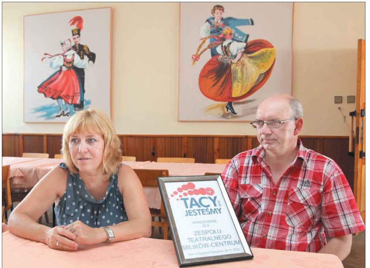
Przy miejscowym kole działa znany na całym Zaozliu teatr amatorski. W 2012 roku wygrał plebiscyt „Tacy jesteście”.