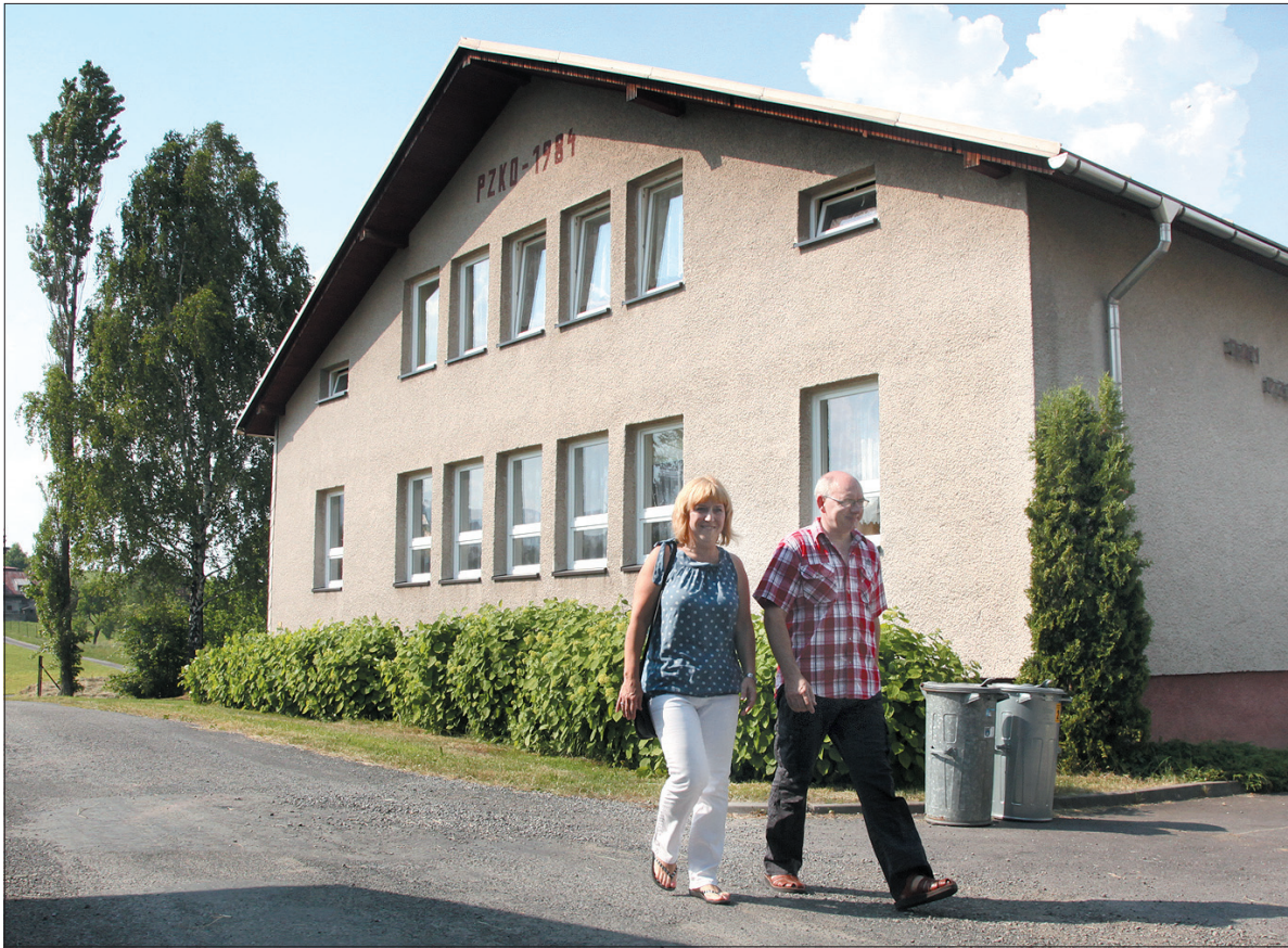
Przed domem PZKO w Milikowie-Centrum.