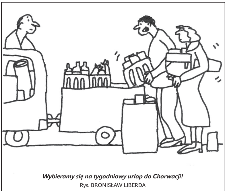
Wybieramy się na tygodniowy urlop do Chorwacji! Rys. BRONISŁAW LIBERDA