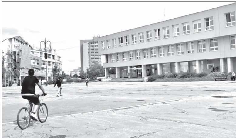
Popękany beton i pusta przestrzeń. Tak wygląda centralny plac w Orłowej-Lutyni.