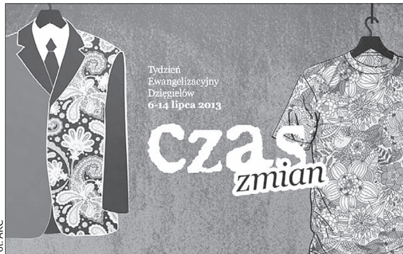
Plakat zapowiadający tegoroczny TE.

Podczas wernisażu wystawy (dziś, godz. 16.00) Krajca nie tylko prezentuje swoje zdjęcia, ale zagra ponadto na typowym australijskim instrumencie didgeridoo oraz przeczyta swoje wiersze zainspirowane piękną beskidzką przyrodą. (kor)