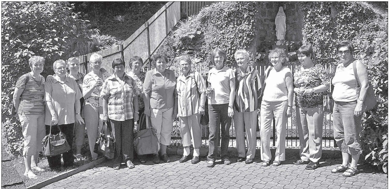
Członkinie Klubu Kobiet z Karwiny-Raju przed źródłem „z wieczną wodą” w Górnej Łomnej.

zmu wodą ze źródła i pieśń „Płyniesz Olzo”. W godzinach popołudniowych zatrzymano się w Koniakowie w celu zwiedzenia muzeum koronek i spożycia późniejszego obiadu. Po wspólnej pogawędce na tarasie restauracji