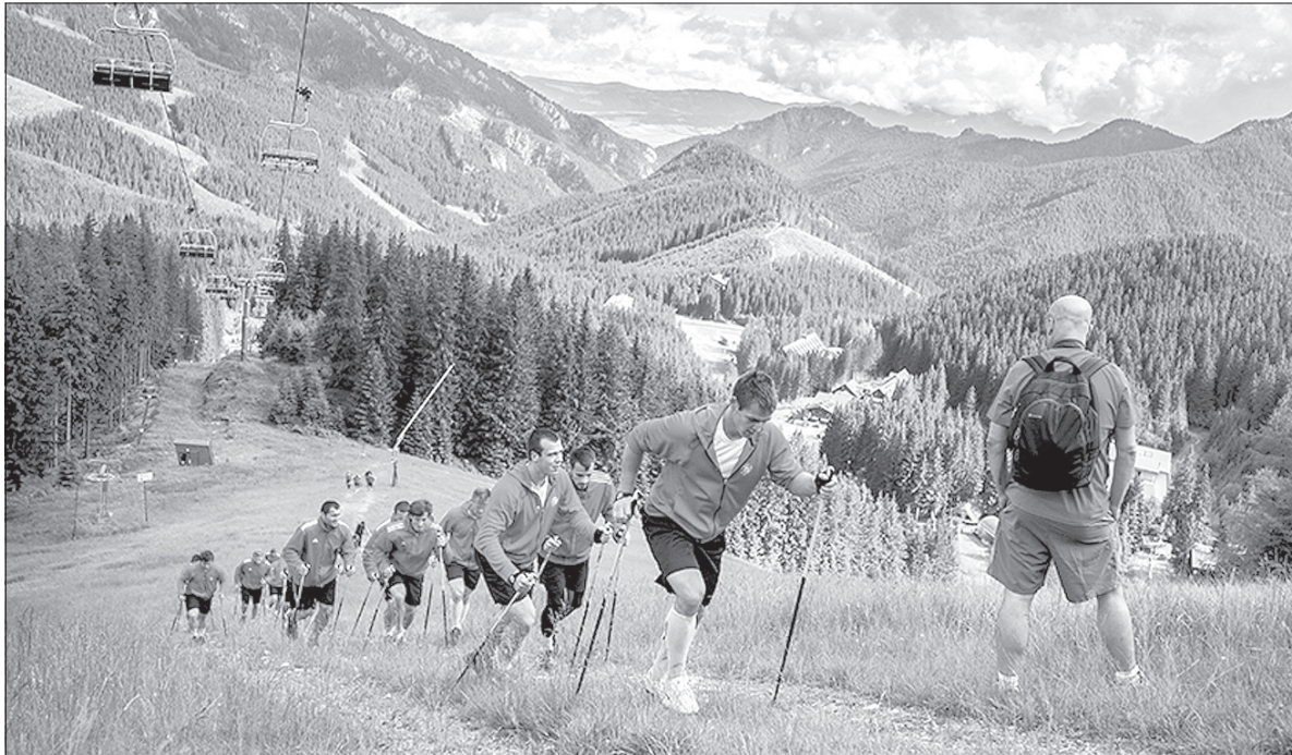
Peleton trzyńskich hokeistów w Niskich Tatrach.