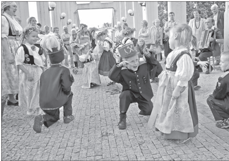
Przedszkolaki z Karwiny-Frysztatu tańczyły na Darkowskim Moście.