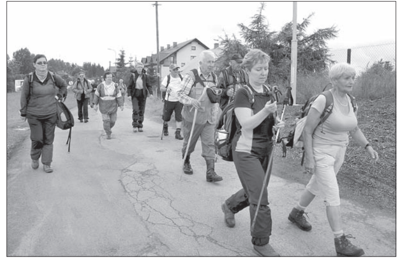
Piesi turyści z PTTS „BS” w RC do źródeł Olzy wędrowali z Koczego Zamku.