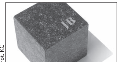
Tak wygląda statuetka dla profesora Jerzego Buzka.