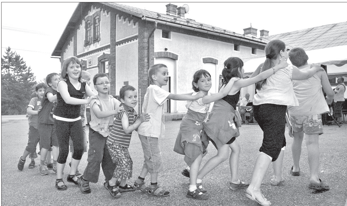
Dzieci podczas zabawy w rytmie muzyki zespołu Old Boys Band w parku obok Domu Robotniczego.