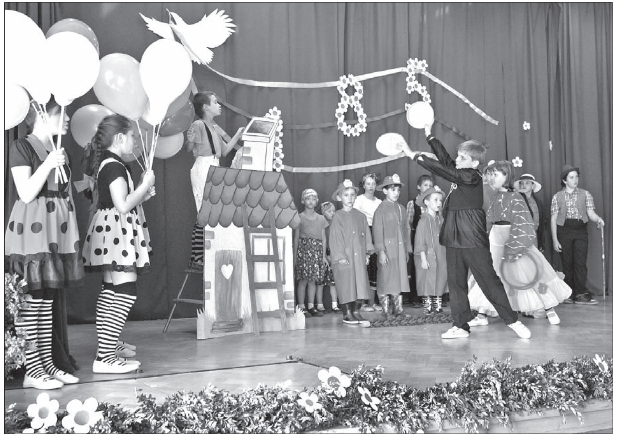
Migawka z przedstawienia „Tadek Niejadek”.

Część festynowa imprezy jubileuszowej, której wyjątkowo w tym roku sprzyjała pogoda, trwała do godzin