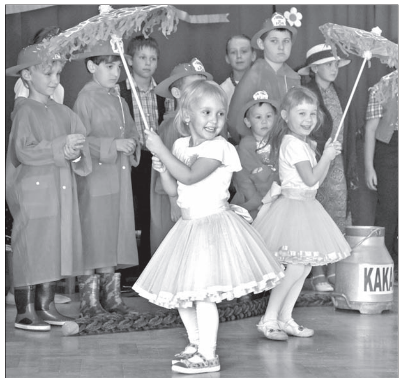
Na scenie przedszkolaki – narybek szkoły.