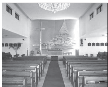
Remont obejmie wnętrze kościoła.

Według proboszcza, celem przebudowy wnętrza kościoła jest uzyskanie większego komfortu przeżywania mszy św., zapewnienie lepszego kon-