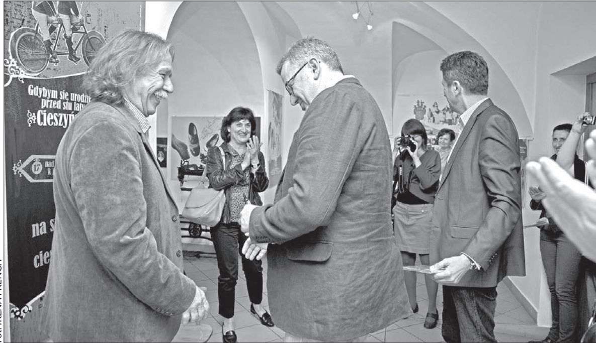
Jaromír Nohavica (z lewej) i Artur Andrus podczas spotkania w Muzeum Śląska Cieszyńskiego.