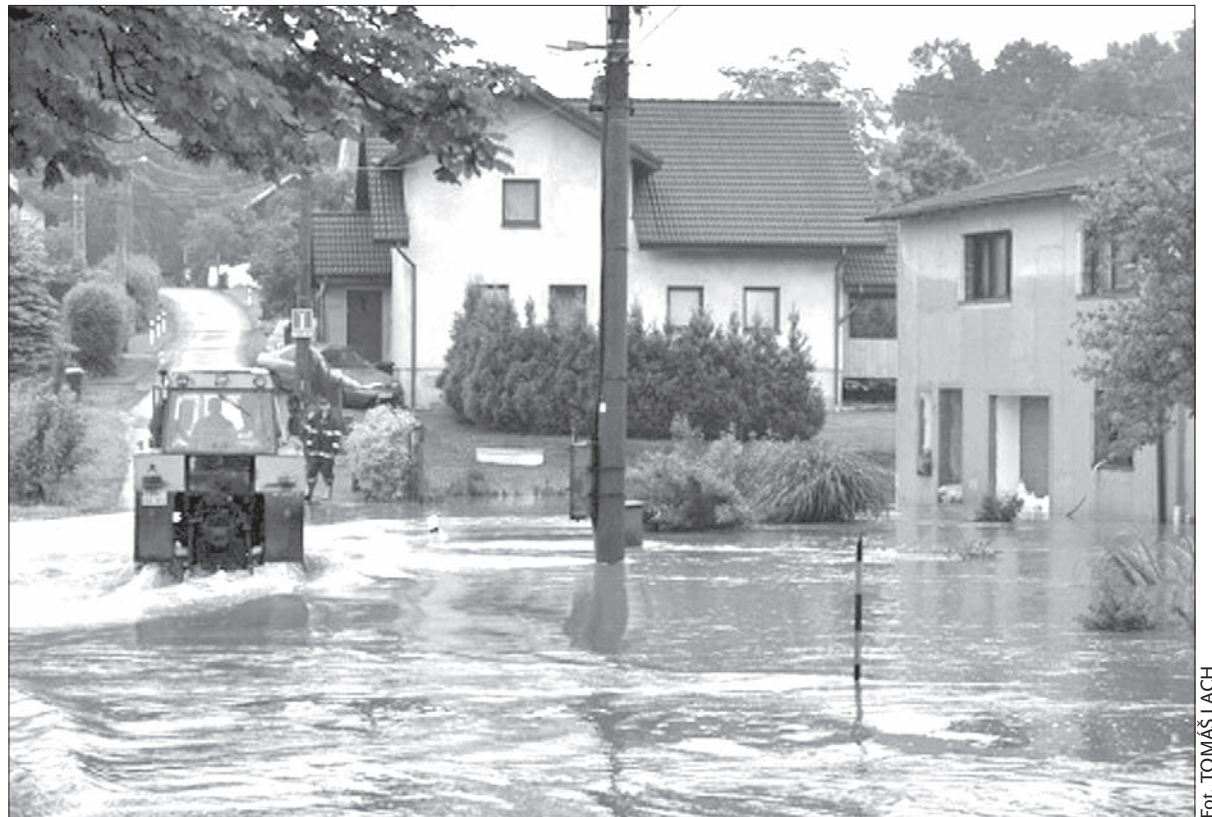
Powódź w Piotrowicach.

W Piotrowicach zdał egzamin wybudowany dwa lata temu betonowy wał, chroniący przed wzburzoną rzekę zabudowania w pobliżu centrum gminy. W Zawadzie również ma być