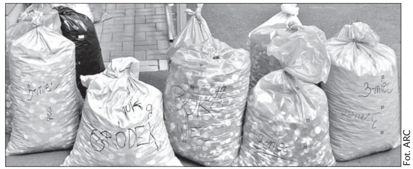
Dla dzieci ze szkoły specjalnej w Trzyńcu udało się zebrać aż 53 worki z nakrętkami.