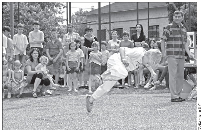
Nie zabrakło takich popisów wśród najmłodszych.