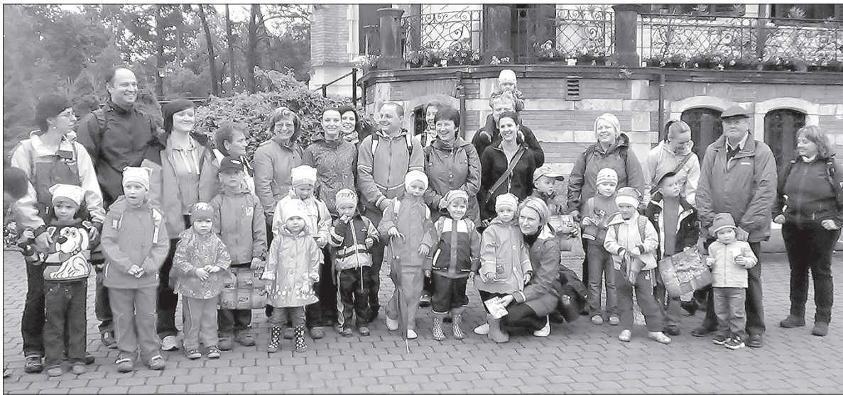
Przedszkolaki z Suchej Górnjej.