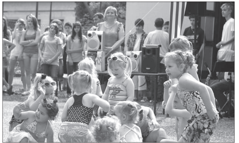
Zabawa była przednia.

Byłem jednym z tych, którzy uczestniczyli w powstaniu Zrzeszenia Muzyczno-Śpiewaczego i całą kadencję reprezentowałem je jako członek komisji rewizyjnej Unii českých pěveckých zboru. Potem zrezygnowałem z uczestnictwa w tych, niezbyt dla mnie zrozumiałych, grach ambicyjnych, a teraz trzeźwo patrząc na to wszystko, nie dziwię się, że postanowiono zlikwidować tę organizację, bo stoi na glinianych nogach. Wynika to bowiem z zasad termodynamiki, które wskazują, że wszystko zmierza do entropii, czyli