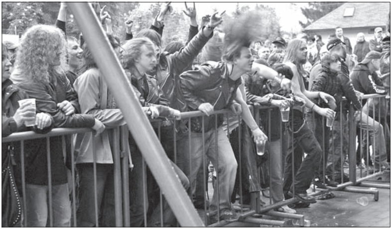
Fani muzyki mocnego uderzenia.

W 1976 roku po raz pierwszy zagrała w Bystrzycy. W sobotę, po 37 latach tu wróciła. Legendarny zespół Krzysztofa Cugowskiego, Budka Suflera była gwóździem IX Bystrzyckiego Złotu. To ona sprawiła, że ok. godz. 20 do miejscowego Parku PZKO ciągnęły tłumy gości.