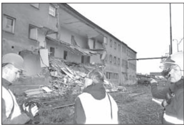
Zdjęcie z wczorajszej akcji.

OSTRAWA (dc) – W pobliżu centrum miasta zawaliła się część trzykondygnacyjnego budynku, który w przeszłości służył jako biurowiec. Budynek od pięciu lat nie był wy-