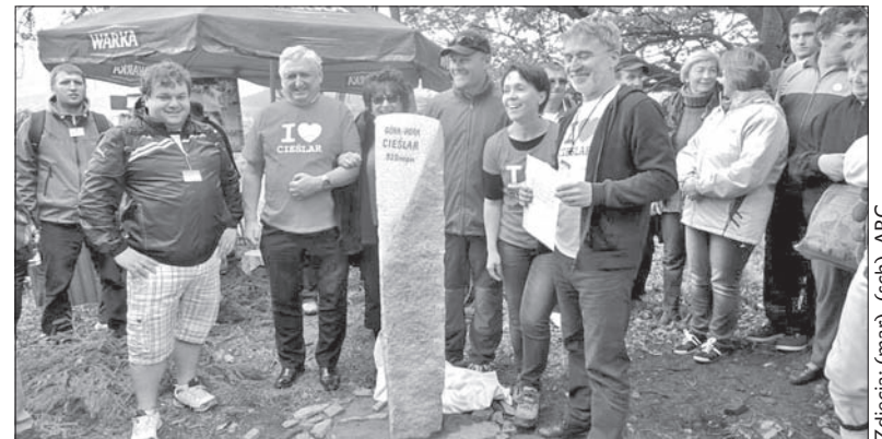
Także w niedzielę na górze Cieślar spotkali się Cieślarowie z całego świata. Jednym z punktów uroczystości było odsłonięcie pamiątkowego obelisku.