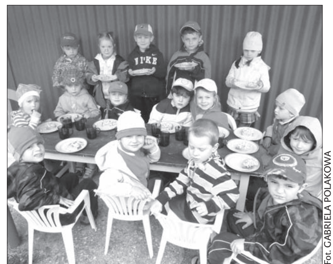
(r) Pełne brzuchy, więc wszyscy zadowoleni.

Przedszkolaki z przedszkola POGODA w Oldrzychowicach wzięły udział w smażeniu jajecznicy. – Choć słońce się schowało, to smażenie jajecznicy w ogrodzie się udało. Wszystkim przedszkolakom z POGODY w Oldrzychowicach jajecznica bardzo smakowała – wiadomość tej treści otrzymaliśmy na redakcyjną skrzynkę.