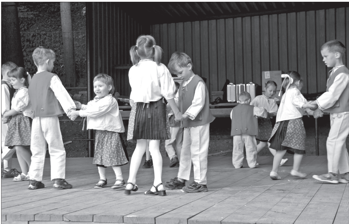
Nieborowskie przedszkolaki na podium.

– Cieszę się, że przyszlście w tak dużym gronie i że zawsze bez względu na pogodę tutaj przychodzą – powiedział pod adresem uczestników 60. Oszeldówki prezes Studnicki. Pogoda na szczęście w Nieborach się utrzymała i nie pokrzyżowała szyków zarówno organizatorom, jak i biesiadującym gościom. (sch)