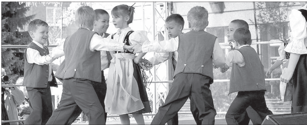
Dzieci z przedszkola na ul. Moskiewskiej w Czeskim Cieszynie.

Jako pierwsi na scenie pojawili się tancerze z zespołu „Młode Oldrychowice”. Zatańczyły, zagrały i zaśpiewały także dzieci z przedszkola na