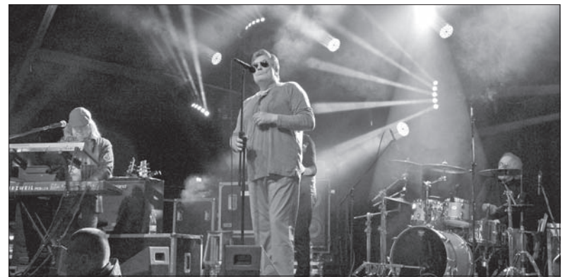
Gwiazdą sobotniego Bystrzyckiego Złotu była legenda polskiej muzyki – grupa Budka Suflera.

Ostatni weekend maja obfitował w imprezy na całym Śląsku Cieszyńskim. Niemożliwością było uczestniczenie we wszystkich wydarzeniach. Oto fotograficzna relacja z trzech z nich, więcej o imprezach piszemy na stronach 3, 4 i 5.