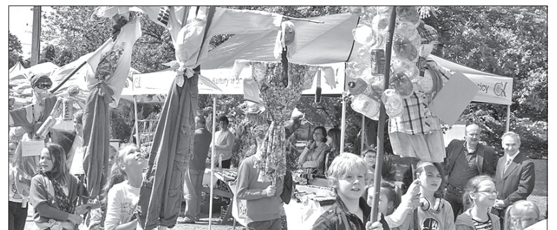
W niedzielę w Rudzicy w powiecie bielskim odbyło się kolejne Święto Stracha Polnego. Gośćmi byli członkowie Miejscowych Kół PZKO w Czeskim Cieszynie-Sibicy oraz Lesznej Dolnej, którzy współpracują z Gminnym Ośrodkiem Kultury w Jasienicy.