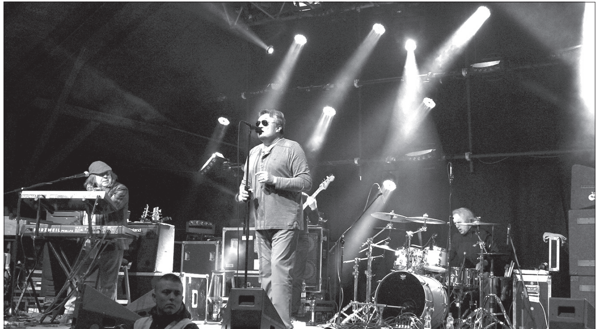
Krzysztof Cugowski i Budka Suflera.

decka grupa mocnego uderzenia The End. Po nich wystąpiła Porta Inferi z ciężkim demonicznym metalem. – Szkoda że grała przy tak małej publiczności, bo to, co prezentowa-