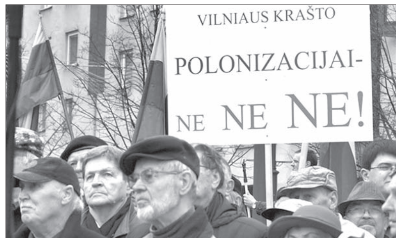
Uczestnicy akcji protestacyjnej w Wilnie przeciwstawiają się spełnieniu przez rząd postulatów polskiej mniejszości.

Na Litwie wciąż głośno jest o postulatach tamtejszej mniejszości Polskiej. W ostatnich miesiącach w Wilnie zorganizowano kilka akcji protestacyjnych „Za naszą ziemię, język, państwo”. Na ostatnim wieceu pod litewskim sejmem protestowano przeciw postulatowi litewskich Polaków, głównie przeciwko wprowadzeniu ulg na egzaminach maturalnych z języka litewskiego dla szkół mniejszości narodowych, dwujęzycznym tablicom nazw ulic oraz pisowni imion i nazwisk w oryginalnym brzmieniu.