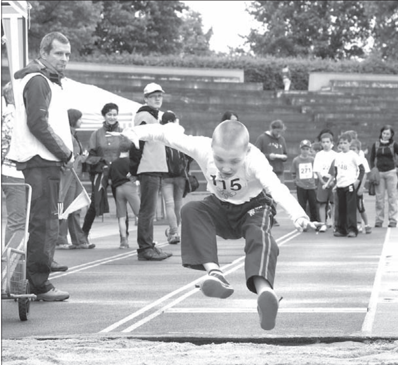
W sektorze skoku w dal w 2012 roku.