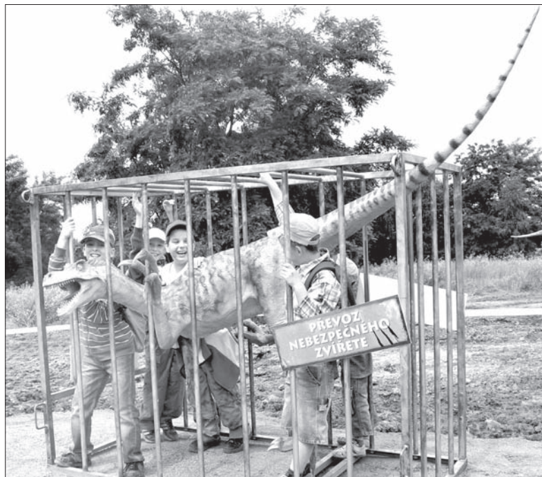
W Dąbrowie możecie zajrzeć do parku pełnego dinozaurów. Otwarcie sezonu już w sobotę.

więc wybrać do parku pełnego dinozaurów w najbliższą sobotę. Na odwiedzających czeka dużo atrakcji, wśród nich także kilka nowości. Dino Expres, który już w poprzednich latach woził dzieci po parku, umożliwiając zagłębienie w miejsca, do których ciężko dotrzeć pieszo,