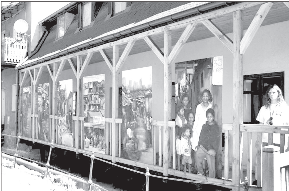
Cieszyńska Wenecja dziś raczej nie tętni życiem.

W moim przekonaniu cieszyńska Wenecja byłaby dobrym miejscem na lokalizację naszego Stodolní. Znajduje się blisko centrum, a jednak trochę na obrzeżach miasta. Zlokalizowanie tutaj klubów i knajp nie powinno wiązać się z takimi uciążliwościami jak na Rynku czy ulicy Głębokiej. Proszę zobaczyć, co dziś dzieje się w Cieszynie. Zamykane są lokale. Imprezy organizowane w ścisłym centrum spotykają się z protestami mieszkańców. Częściowo je rozu-