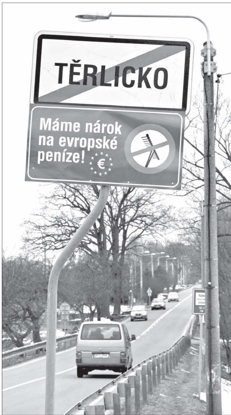
Tablice protestacyjne pojawiły się wczoraj także w gminach naszego regionu.

Republika Czeska w latach 2014-2020 ma otrzymać z Unii Europejskiej 20,5 miliarda euro, czyli ponad 500 miliardów koron. Priorytetem mają być biedne regiony i wieś. Sa-