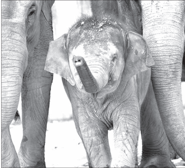
W najbliższą sobotę w ostrawskim zoo możecie zobaczyć imprezę urodzinową dwuletniej słońcy Rashmi.

W najbliższą sobotę w pawilonie słoń i odbędzie się... prawdziwa impreza urodzinowa. Jubilatką będzie dwuletnia słońca Rashmi. O 14.30 można będzie obejrzeć karmienie z komentarzem właśnie słoń, pojawi się też specjalny tort urodzinowy dla małej Rashmi.