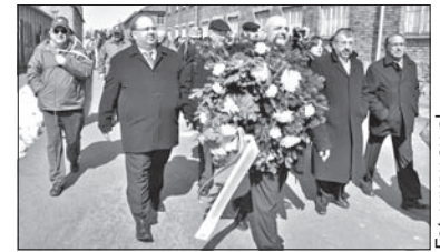
Delegacja województwa morawsko-śląskiego w byłym obozie zagłady w Auschwitz.