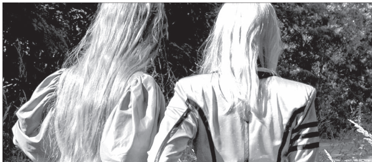
Szwedzki duet The Knife stawia na anonimowość.

Sigur Rós (Islandia), Tomahawk (USA), Jamie Cullum (W. Brytania), Damien Rice (Irlandia), Asaf Avidan (Izrael), Woodkid (Francja), Devendra Banhart (USA), Dub FX (Australia), Tiken Jah Fakoly (Wybrzeże Kości Słoniowej), Rokia Traoré (Mali), Inspiral Carpets (W. Brytania), Jon Hassell (USA), Sara Tavares (Portugalia), Submotion Orchestra (W. Brytania), Skip The Use (Francja), Acoustic Africa (Wybrzeże Kości Słoniowej, Kamerun, Mali), Fanfara Tirana meets Transglobal Underground (W. Brytania/ Albania), Botanica (USA), Girls Against Boys (USA), The Bots (USA), Maria Peszek (Polska), Ladi6 (Nowa Zelandia), Sam Lee (W. Brytania), Aziz Sahmaoui & University of Gnawa (Maroko), Savina Yannatou & Primavera en Salonik (Grecja), Dhafer Youssef (Tunezja), The Kill Devil Hills (Australia), Anna Maria Jopek (Polska), Mich Gerber (Szwajcaria), Mama Marjas (Włochy), Irie Révoltés (Niemcy), Gin Ga (Austria), OKA (Australia), Man Man (USA), Russkaja (Austria), Tata Bojs, Zrní, Umakart, Vojtěch Dyk & B-Side Band bandleader Josef Buchta, Květy, Pražský výběr, Sunflower Caravan, Psí vojáci, Aneta Langerová, The Prostitutes, Luno, The Pipes and Pints, Xindl X, Lesní zvěř, Poletíme?, Wanastowi Wjeczy (wszyscy RC).