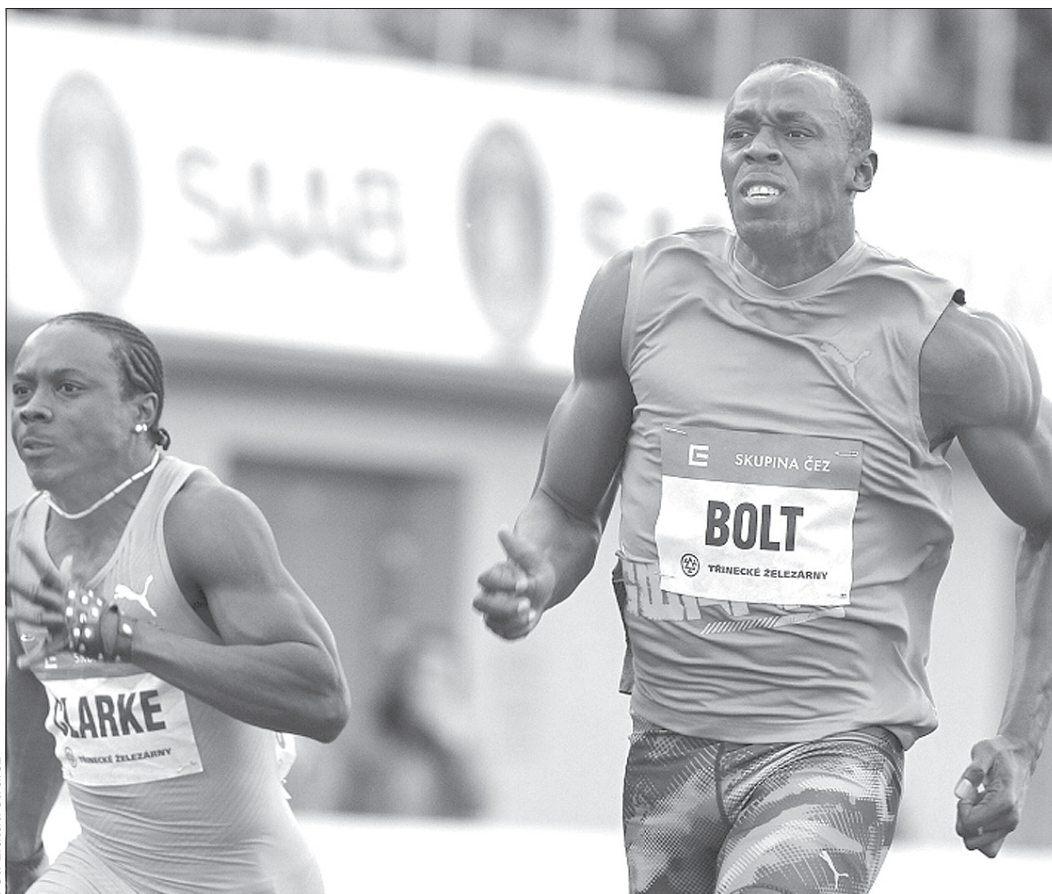
Usain Bolt podczas ubiegłorocznej edycji Złotych Kolców.