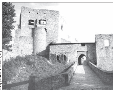
Palenie czarownic odbędzie się na przykład w zamku Hukwalty.

Przyszła wiosna, a wraz z nią – zwyczaj palenia czarownic. Na prawdziwie czarodziejską imprezę potrzebne jest odpowiednie miejsce. Idealnie nadawać się będą do tego zamki. W niedzielę 28 kwietnia możecie zajrzeć do zamku Hukwalty. Kostium – obowiązkowy, w końcu na zamek zlecą tego dnia czarownice z całej okolicy. Będą gry i zabawy dla dzieci – małych czarodziejek i czarodziejów oraz wybór najlepszego kostiumu. Będzie przedstawienie rycerskie i inne atrakcje. Przede wszystkim jednak – spalenie najstraszniejszej czarownicy! Komu byłoby mało, może kilka dni później, 30 kwietnia, wybrać się na Zamek Śląsko-Ostrawski. Tam również, z okazji powitania wiosny, w ostatni dzień kwietnia odbędzie się palenie czarownic. Zanim jednak czarownice spłoną na stosie przy asyście sztucznych ogni, dzieci i dorośli będą mogli bawić się w rytm ciekawego programu. Możecie cieszyć się na przykład na malowanie twarzy, konkursy i zabawy czy czarodziejską dyskotekę oraz konkurs na najładniejszą, najstarszą oraz ogólnie „naj” czarownicę. (ep)