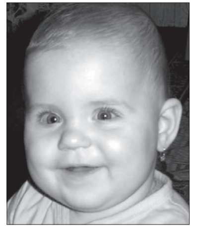
Naomi Klein czy sławna żeglarka z Nowej Zelandii, Naomi James.

Naomi to jeden z wielu wariantów imienia Noemi, mającego pochodzenie hebrajskie. Noemi występuje w starotestamentowej księdze Ruth. Forma Naomi używana jest najczęściej w krajach anglojęzycznych oraz w Japonii. Znane kobiety noszące to imię to m.in. brytyjska modelka Naomi Campbell, pisarka kanadyjska