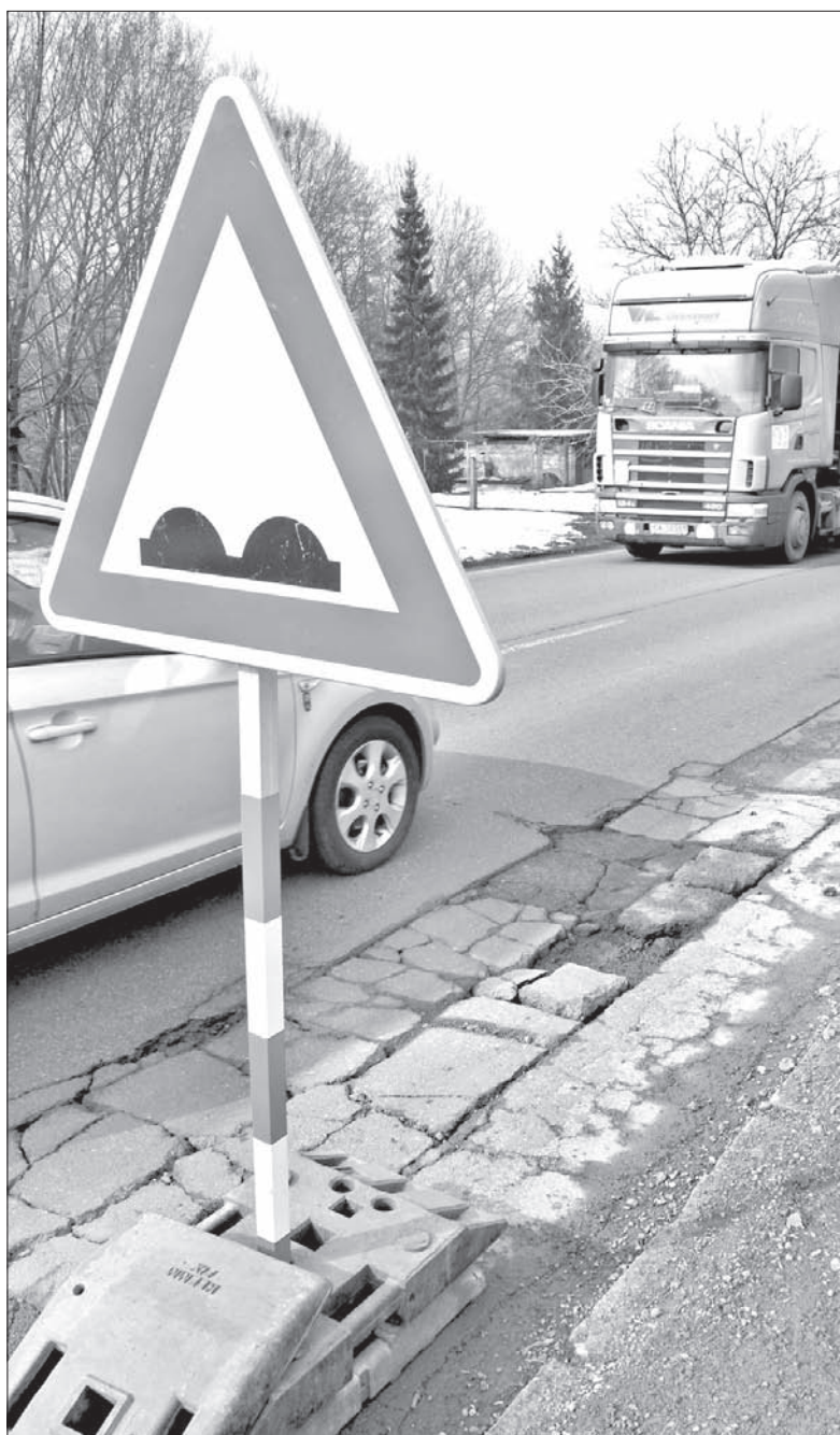
Fragm. drogi I/11 w Wędryni.

– Na podstawie wstępnych konsultacji z przedstawicielami miasta, inwestorem i wykonawcą, ustaliliśmy, że samochody ciężarowe nie będą podczas remontu drogi I/11 zjeżdżać z trasy. Ruch sterowany będzie wahadłowo za pomocą sygnalizacji