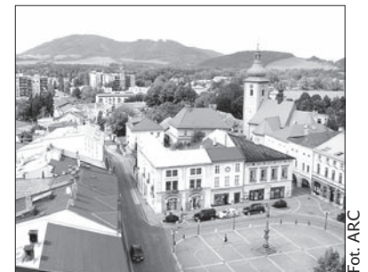
Rynek we Frenszacie p. Radhoszczem.