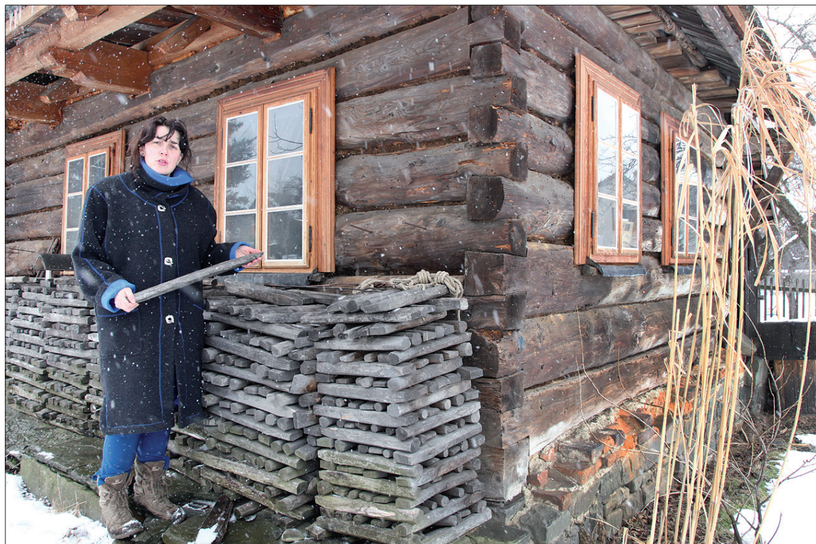
Najstarszy warsztat kołodziejski w RC stoi na gruncie Sabelów „z łąki”.