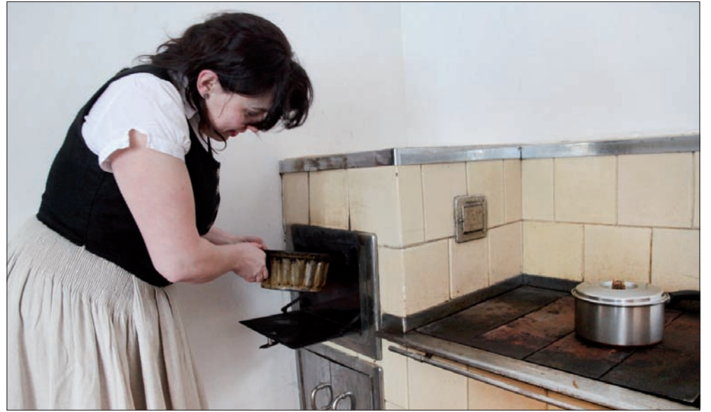
W nowocześnie umeblowanej kuchni i... przy starym kachloku.

z samego Wiednia – stwierdza z dumą wnuczka ostatniego kołodzieja z Sabelów, biorąc do ręki stare szpice, które nabijano do kół ku wozom drabiniastym, tzw. drabiniokom. – Łękocie i szpice robiono z drzewa jesionowego, które ścinano z kilku letnim wyprzedzeniem, żeby dobrze wyschło – wyjaśnia.