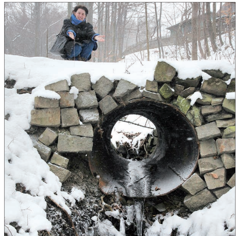
Tędy przepływa Jordan.