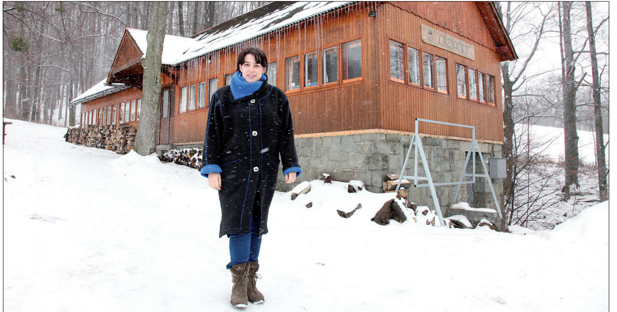
Kąpiele ziołowe – miejsce, które przyciąga turystów.