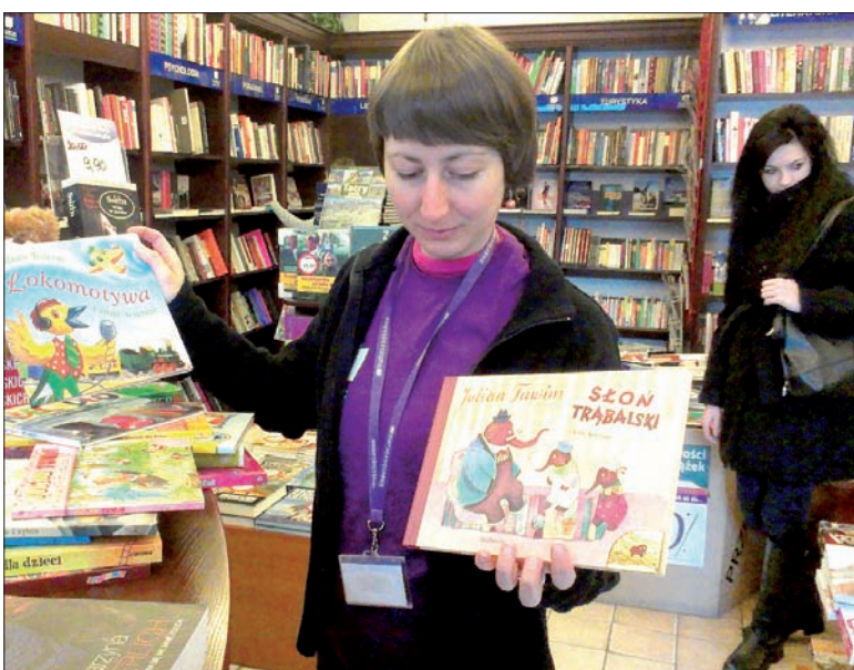
Księgarnie oferują szeroki wachlarz książek Juliana Tuwima.

Cieszynie można nabyć cały zbiór wierszy Tuwima z twardymi okładkami. Dodatkowym walorem „Wierszy i wierszyków dla najmłodszych” są bardzo miłe ilustracje (dziewczynka z psem z okładki chwyci za serce najmłodszych czytelników). Jest też „Lokomotywa i inne wiersze”