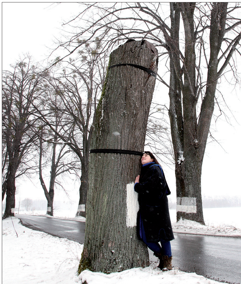
Czarne paski na pniach lip przypominają żałobę.