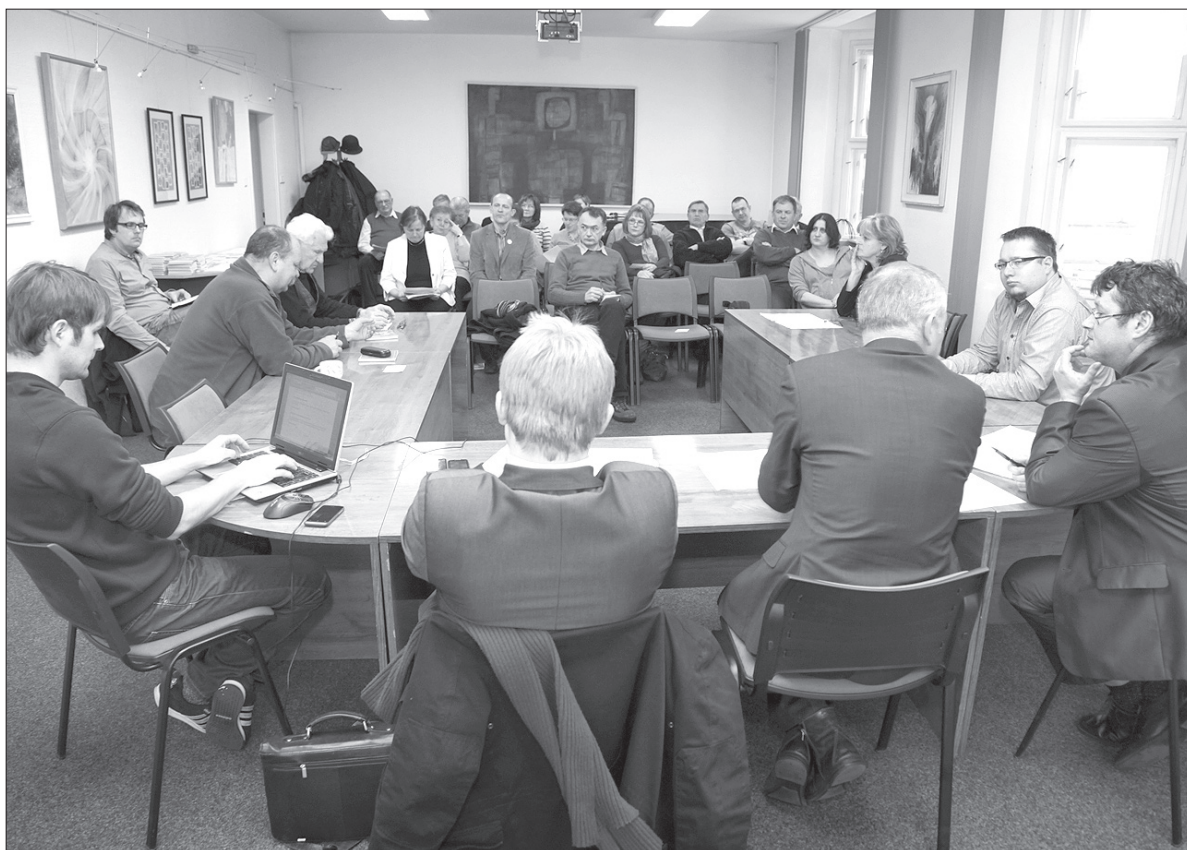
Czwartkowa sesja Rady Przedstawicieli Kongresu Polaków w RC.