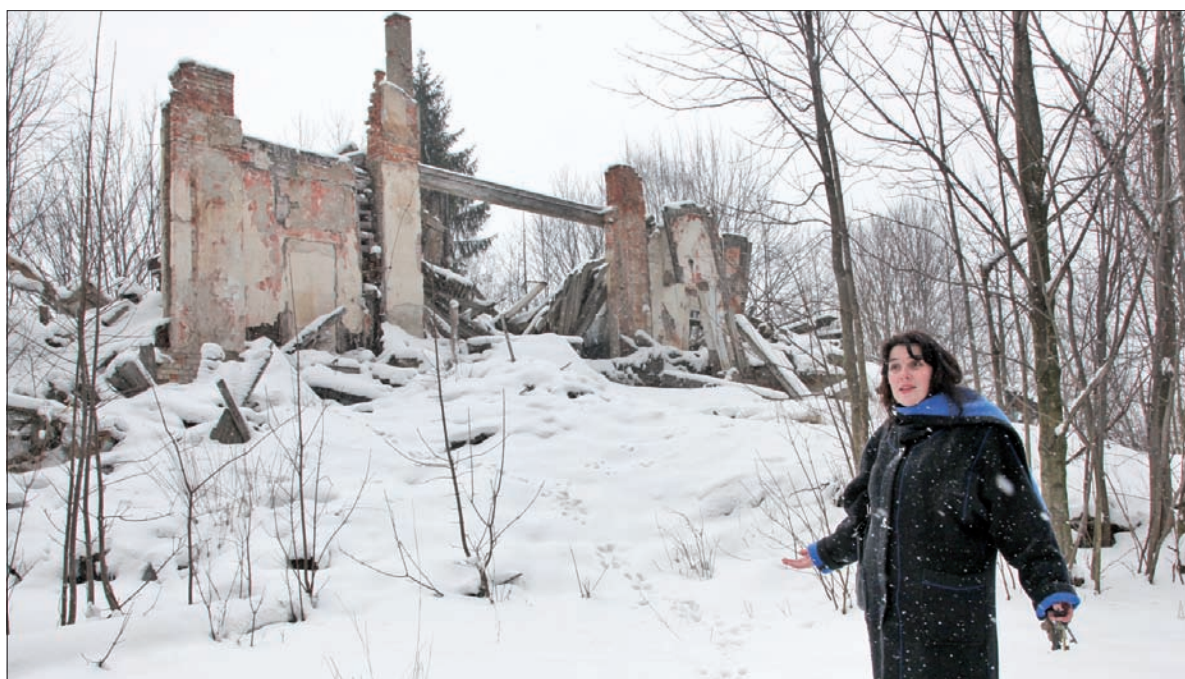
Po willi Prochazki z końca XIX wieku pozostała tylko smętna ruina.

wejściem do willi, w którym razem z rodzeństwem łapaliśmy małe traszki i jaszczurki. Spędzaliśmy tu wiele godzin. Sam dom też robił na nas niesamowite wrażenie. Kiedy wchodziło się do willi, przed oczami otwierał się fantastyczny widok na podwójne kręcone schody z pięknymi metalo-