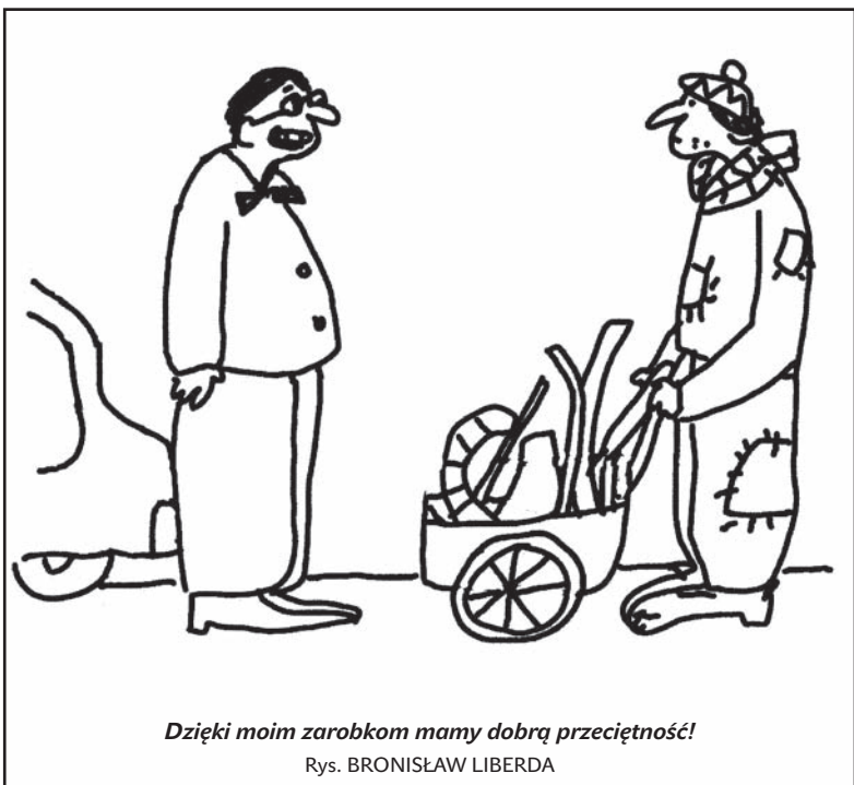
Dzięki moim zarobkom mamy dobrą przeciętność!