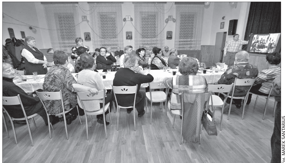
Obecni na wtorkowej „Śledziówce” w Olbrachcicach obejrzeni nagranie wideo z balu ostatekowego „Pochowani basy”.