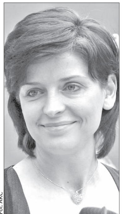
Minister Joanna Mucha