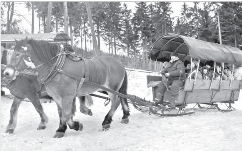
Kulig wyruszył z Kubalonki i dotarł przez Szarculę na Stecówkę.

no! Na Stecówce czekał na wyprawę smaczny rosół, zabawa w poszukiwanie skarbu, wspólne gry i zabawy, a nawet bitwa śnieżna. Potem jeszcze opiekanie kiełbasek, gorąca herbata i powrót do Bystrzycy, gdzie na młodych podróżników czekali rodzice. (ep)