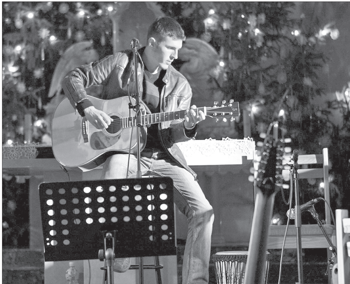
Kapela „Zacheusz” wystąpiła ostatnio w jabłonkowskim kościele św. Józefa przy klasztorze sióstr elżbietanek.