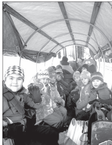
Było naprawdę super!