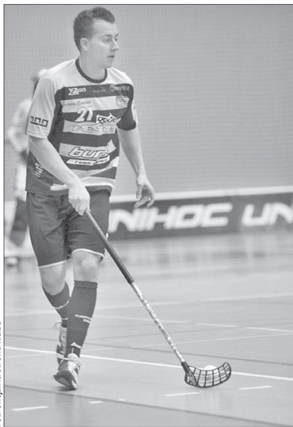
Torpedo przeżywa koszmarny okres.