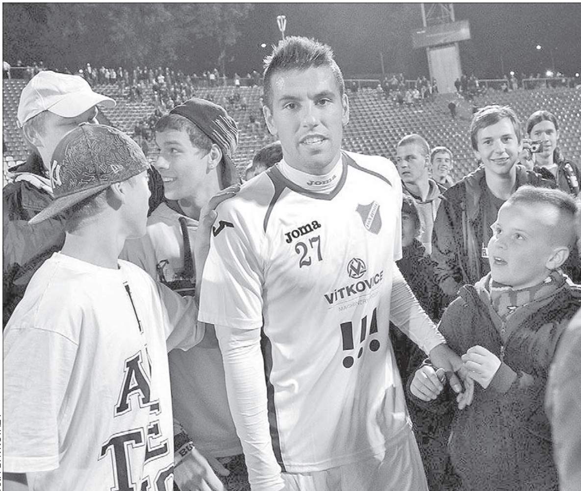
Milan Baroš w otoczeniu młodych fanów po jesiennym meczu charytatywnym na Bazalach.

31-letni Milan Baroš nie schodzi ostatnio z czołówek czeskich gazet sportowych. Takiego medialnego szumu wokół jego osoby nie było od czasów zwycięstwa w Lidze Mistrzów. Baroš w 2005 roku sięgnął z FC Liverpool po puchar dla najlepszego klubu Starego Kontynentu. Wspólnie z Vladimírem Šmicerem zostali pierwszymi Czechami, którym poszczęściło się wygrać prestiżową Ligę Mistrzów. Niestety później z Barošem było już coraz gorzej. Transfery do Aston Villi, Olympique Lyon i Portsmouth nie należały do udanych, wręcz przeciwnie. Światło w tunelu zabłysnęło Barošowi dopiero w tureckim Galatasaray Istanbuł, gdzie trafił w 2008 roku. Początki w słynnym tureckim zespole wyglądały bardzo obiecująco, w miarę dobre czasy skończyły się jednak wraz z przyjściem trenera Fatiha Terima. Zdaniem tureckich dziennikarzy Terim definitywnie zrezygnował z czeskiego piłkarza po zimowych transferach Drogby i Sneidera. W tym przekonaniu utwierdziła tureckiego trenera namacalna słaba dyspozycja Baroša