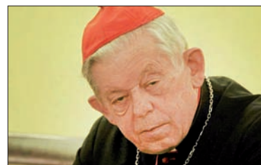
Kardynał Józef Glemp

Nie żyje wieloletni osobisty sekretarz prymasa Stefana Wyszyńskiego, później prymasa Polski (1981-2009) i wieloletni przewodniczący Konfederacji Episkopatu Polski, ks. kardynał Józef Glemp. Od kilku miesięcy zmagał się z chorobą nowotworową. Zmarł w czwartek wieczorem w Warszawie. Pochowany zostanie najprawdopodobniej w Panteonie Wielkich Polaków w krypcie pod Świątynią Opatrzności. Pomimo choroby w ostatnich miesiącach kardynał Glemp uczestniczył w najważniejszych uroczystościach kościelnych, nie unikał także kontaktu z mediami, brał udział w sierpniowej wizycie patriarchy Moskwy i całej Rusi Cyryla I w Warszawie. Ostatnie lata życia prymas senior spędził w swojej rezydencji w warszawskim Wilanowie. Kardynał Glemp zainicjował tam budowę Świątyni Opatrzności Bożej, w której znajduje się Panteon Wielkich Polaków. Prymas senior był honorowym obywatelem Warszawy. Kardynał Glemp urodził się 18 grudnia 1929 w Inowrocławiu. W kwietniu 1979 roku