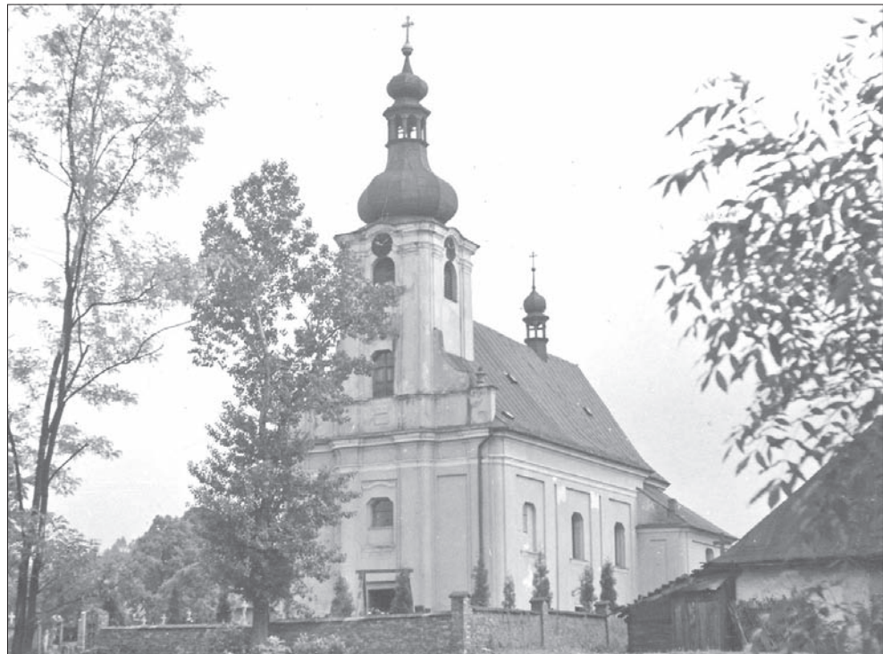
Kościół parafialny pw. św. Trójcy w Cierlicku Górnym, w 1962 roku został wysadzony w powietrze.