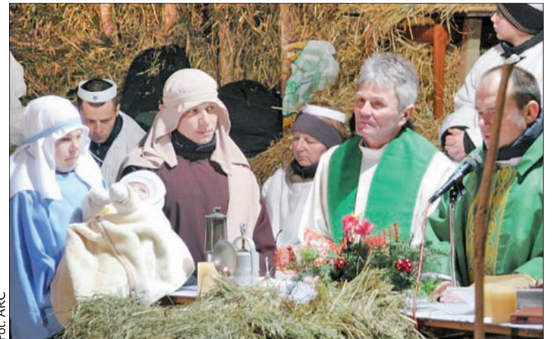
Święto Trzech Króli w nietypowym amfiteatrze.

Ciekawym miejscem jest przedsiębiorstwo społeczne założone przez fundację „Być Razem” z Cieszyna. Prowadzi wielobranżową działalność w dawnych halach produkcyjnych fabryki „Polifarb”. Miasto wyremontowało je za fundusze unijne, po czym wynajęło fundacji. Od tego momentu sama musi zarobić na siebie. W pralni, stolarni, szwalni i zakładzie ślusarskim pracują ludzie z różnymi rodzajami niepełnosprawności, a także bezdomni, którzy mieszkają w ośrodku pomocy, terapii i edukacji