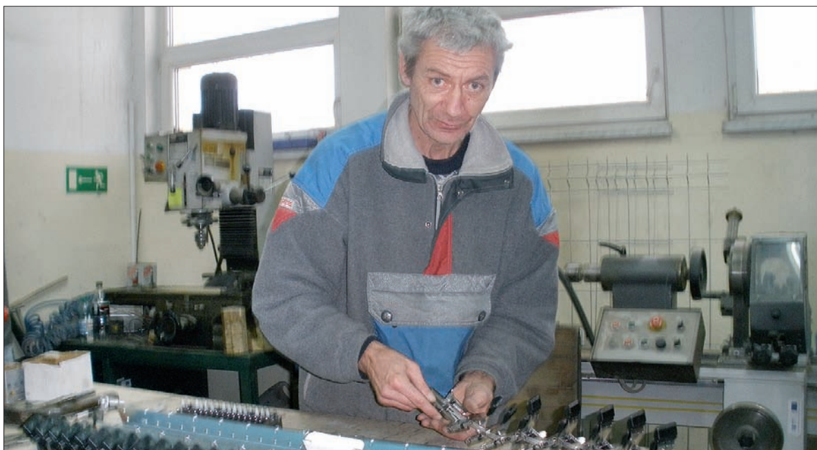
Bezdomny z Cieszyna znalazł dach nad głową i pracę dzięki stowarzyszeniu „Być Razem”.