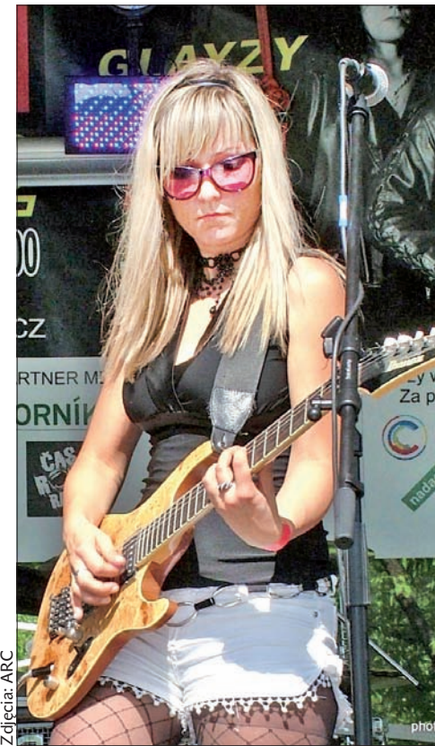
„Glajzy” to rockowe granie.