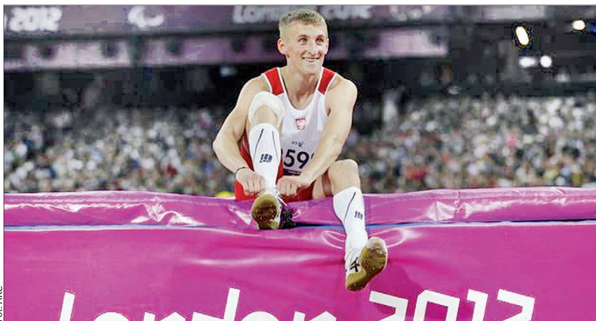
W Wędryni pojawi się m.in. Maciej Lepiato – paraolimpijski mistrz z Londynu.