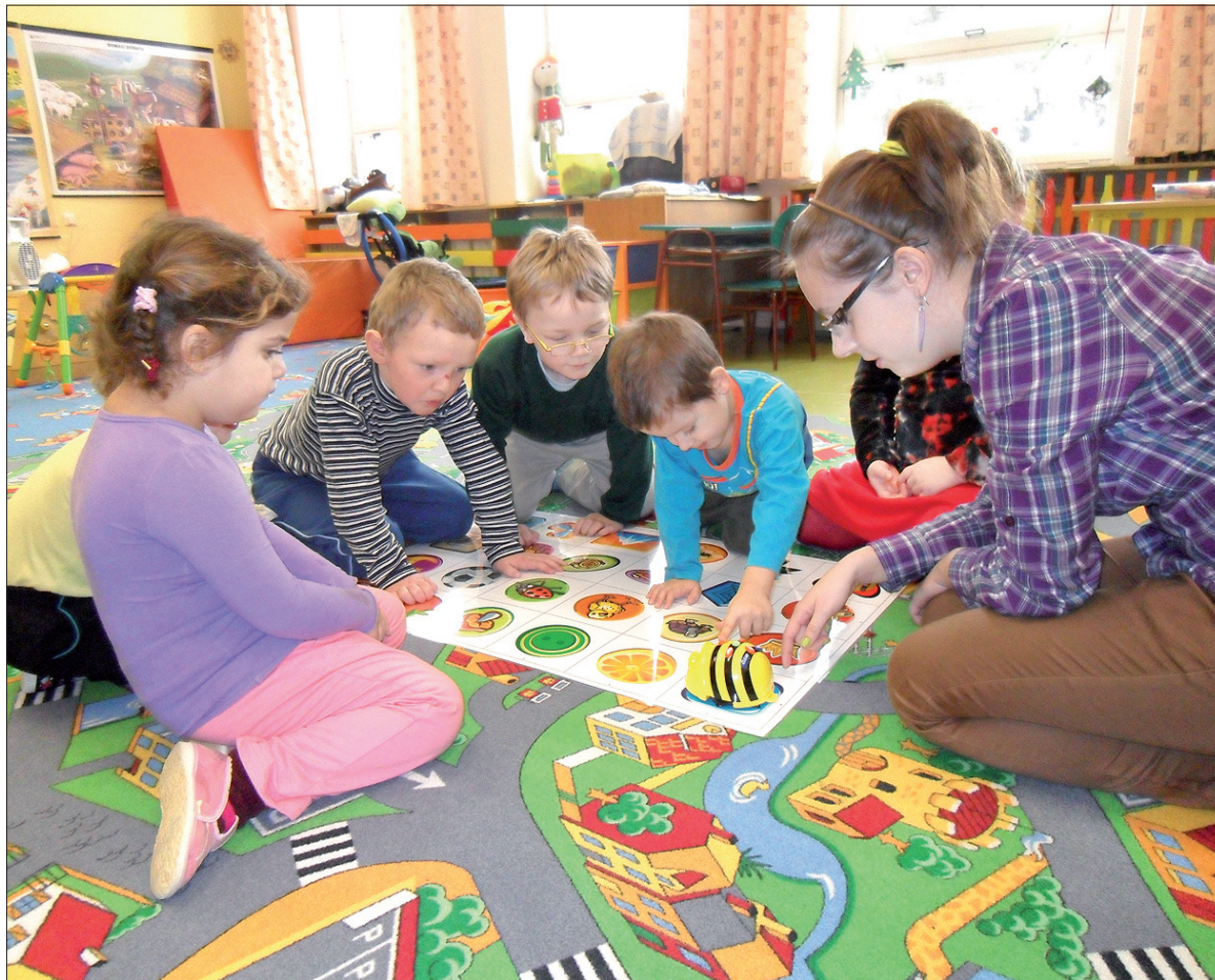
Przedkolaki podczas zabawy edukacyjnej.