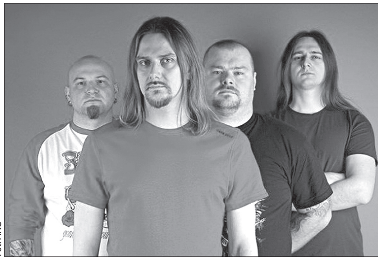
Warszawska formacja Riverside.