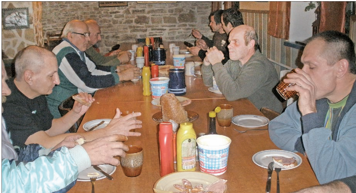
Mieszkańcy „Barki” wspólnie zasiadają do posiłków.