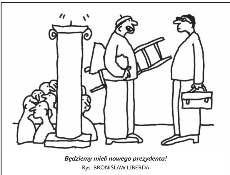
Będziemy mieli nowego prezydenta!