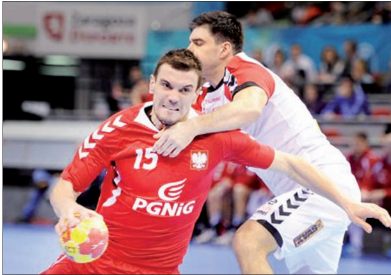
Polacy dziś zmierzą się z Koreą Południową.

Zwycięskiego gola w meczu ze Serbią zdobył Robert Orzechowski. Polska drużyna wygrała z wdzięczą jednak przede wszystkim kapitalnej obronie Sławomira Szmała, który zatrzymał ostatnią akcję ofensywną Serbów i właśnie z kontry w wykonaniu biało-czerwonych padła kluczowa bramka czwartkowego spotkania. – Przede wszystkim trzeba pochwalić cały zespół. W tym meczu mieliśmy upadki i wzloty, ale na koniec była wielka radość. Druga połowa w naszym wykonaniu była niesamowita, zwłaszcza w obronie. Zostawiliśmy na boisku serce – stwierdził szczęśliwy Sławomir Szmał, jeden z najbardziej doświadczonych zawodników w polskiej ekipie. – Mam nadzieję, że takie zwycięstwo zbuduje ten zespół i w kolejnych meczach będziemy rosnąć w siłę – dodał. Przed dzisiejszym meczem z Koreą Południową sytuacja