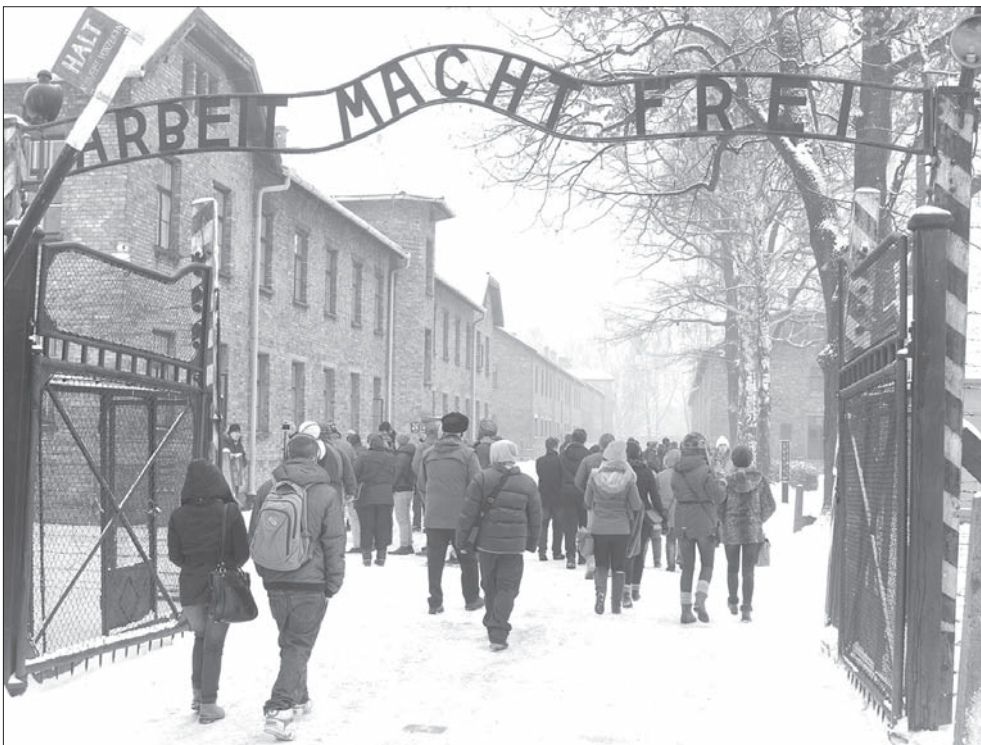
Do obozu wchodzimy przez bramę ze słynnym napisem „Praca czyni wolnym”.