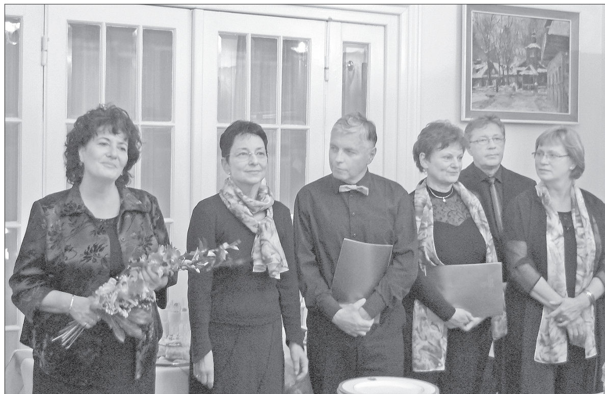
Spotkanie noworoczne PTM-u w siedzibie Konsulatu RP w Ostrawie.

W pierwszej połowie lutego odbędzie się walne zebranie, na którym wybrana zostanie nowa rada oraz nowy prezes towarzystwa. Dlatego trudno teraz mówić o konkretnych planach na 2013 rok, choć z całą pewnością kontynuowane będą nasze miesięczne spotkania. Mają one charakter naukowy, kulturalny czy krajoznawczy. W maju planujemy wysłać kilku delegatów na Kongres Polonii Medycznej w Krakowie. Chcemy w nim wziąć aktywny udział, wygłosić referat, żeby zaistnieć. Oprócz tego chcemy rozwijać współpracę z Towarzystwem Lekarskim Krakowskim, z którym nawiązaliśmy kontakt przed trzema laty. Uważam, że kondycja PTM jest dobra, choć zawsze może być lepsza. Staramy się pozyskiwać młode osoby związane ze służbą zdrowia. Choć w ostatnich latach udało nam się obniżyć średnią wiekową PTM, to mam nadzieję, że dołączą do nas kolejni młodzi członkowie.