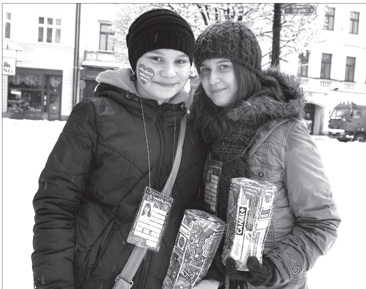
Takie obrazki już wkrótce będziemy obserwować na ulicach całej Polski, a właściwie świata.