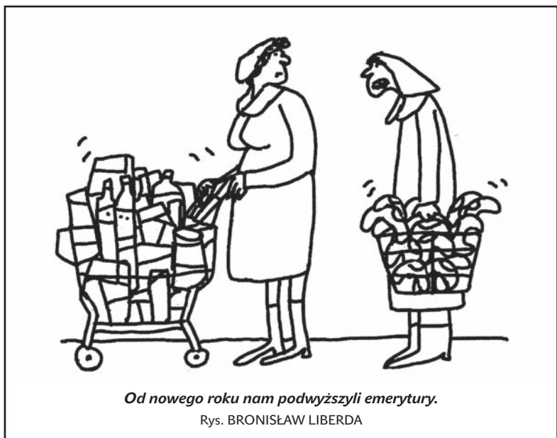
Od nowego roku nam podwyższyli emerytury. Rys. BRONISŁAW LIBERDA

atrakcji, nie tylko dla dzieci, ale także dla dorosłych. Obszar podzielony zostanie na dwie strefy: w części odpoczynkowej pojawią się ławki, pergola, grill, a druga część przeznaczona będzie na sport i aktywność ruchową, powstanie tam np. boisko do siatkówki plażowej. (ep)