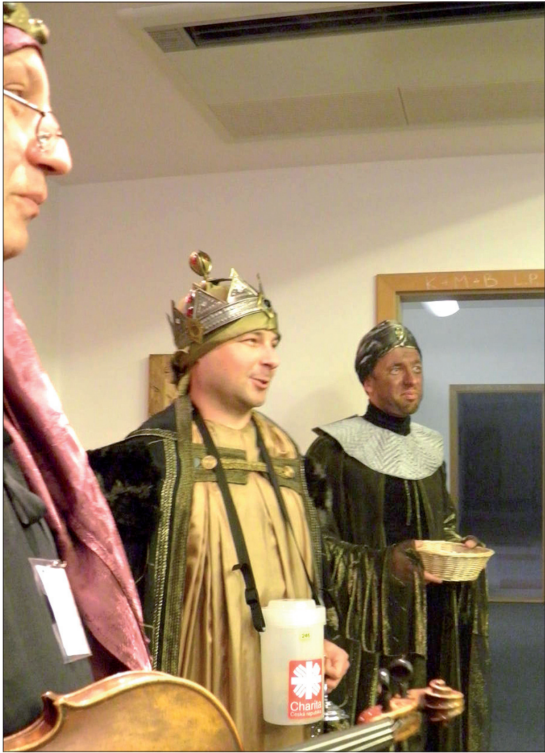
Z członkami kierownictwa Caritasu Diecezji Ostrawsko-Opawskiej odwiedzili ze skarbonkami szereg instytucji w Ostrawie.

Kwesta Trzech Króli odbywa się już po raz trzynasty. W zeszłym roku tylko w naszej diecezji zebrano 12 mln koron. (dc)