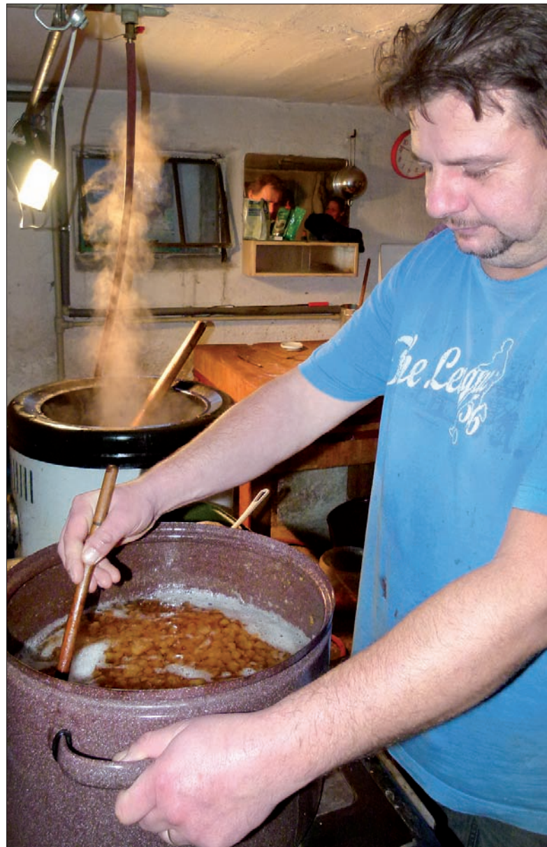
W powietrzu unosił się zapach gotowanych wyrobów.

Oczywiście. Jeżeli dobrze pamiętam, to chyba trzy lata temu spotkaliśmy się w jabłonkowskiej szkole, by w sali gimnastycznej dokonać montażu drewnianego obicia na ścianach znajdujących się za bramkami do piłki nożnej. Natomiast dwa lata temu za uzyskane z dotacji pieniądze szkoła zakupiła