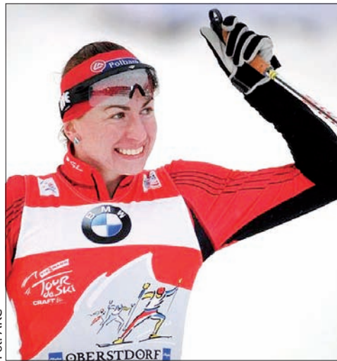
Justyna Kowalczyk

Najgroźniejsze rywalki Kowalczyk, czyli Charlotte Kalla i Therese Johaug, wyraźnie męczyły się podczas całego biegu. Szwedka Charlotte Kalla przystępowała do piątkowego wyścigu w pozycji wicelidera klasyfikacji generalnej, linię mety przecięła natomiast dopiero na 9.