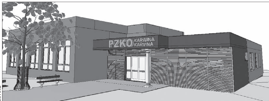
Tak ma wyglądać nowy Dom PZKO w Karwinie-Frysztacie.

– Dużo osób dowiadywało się o projekcie przebudowy domu z naszej strony internetowej. Mie-