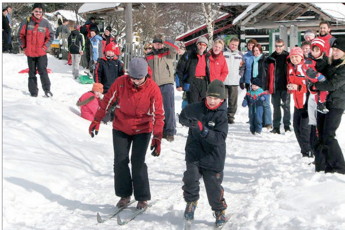
W Jabłonkowie stawiają także na sport.

Oczywiście bal szkolny, na który wszystkich serdecznie zapraszam. Odbędzie się on 12 stycznia w jabłonkowskim Domu PZKO. Zapewniam, że staniemy na wysokości zadania i jak co roku będziemy bawić się do białego rana.