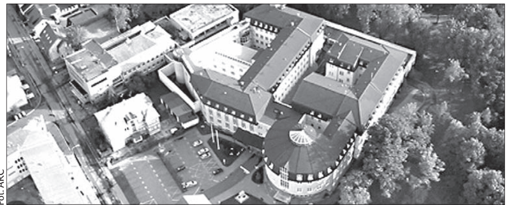
Karwińskie więzienie z lotu ptaka.