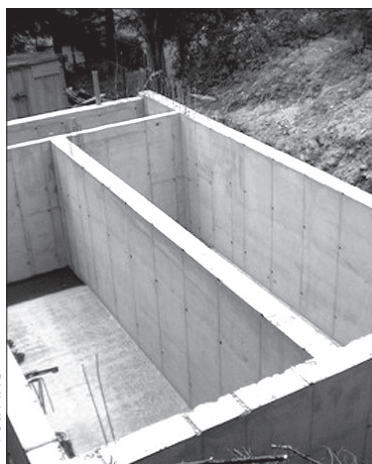
Nowy dwukomorowy zbiornik będzie zaopatrywał w wodę głównie Milików.

Szkandera, do nowych zbiorników zostały już podłączone 148 posesje, kolejne uczynią tak w przyszłym roku. – Nowe zbiorniki pomogą nam zwłaszcza latem, kiedy coraz częściej nasza wieś boryka się z powodu suszy z brakiem wody – dodaje wójt Szkandera. (kor)