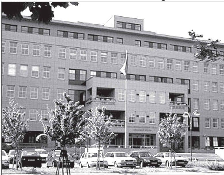
Gmach Urzędu Wojewódzkiego w Ostrawie.