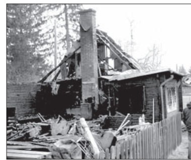
Tyle zostało z restauracji po pożarze.

We wtorek nad ranem paliła się popularna country restauracja w Trzyńcu-Kanadzie. Strażacy zostali wezwani do pożaru ok. godz. 2.30. Na pomoc wyjechali zawodowi strażacy z Trzyńca oraz ochotnicy z Lesznej Dolnej, Gutów i Bystrzycy. Kiedy dotarli na miejsce, drewniany budynek cały był w płomieniach. Choć strażakom udało się w 20 minut opa-