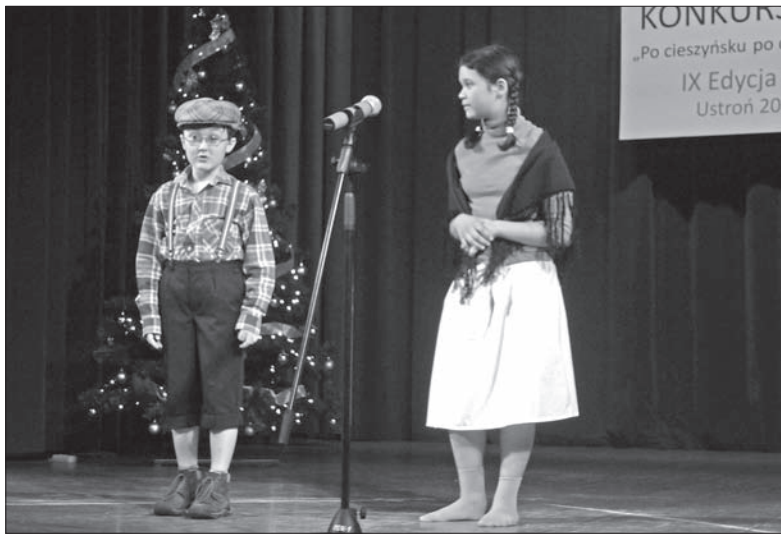
Zespół „Gizdy” z Karwiny zdobył pierwsze miejsce.

oraz grupa „Żacy z Gródka” (PSP Jabłonków). (maki)