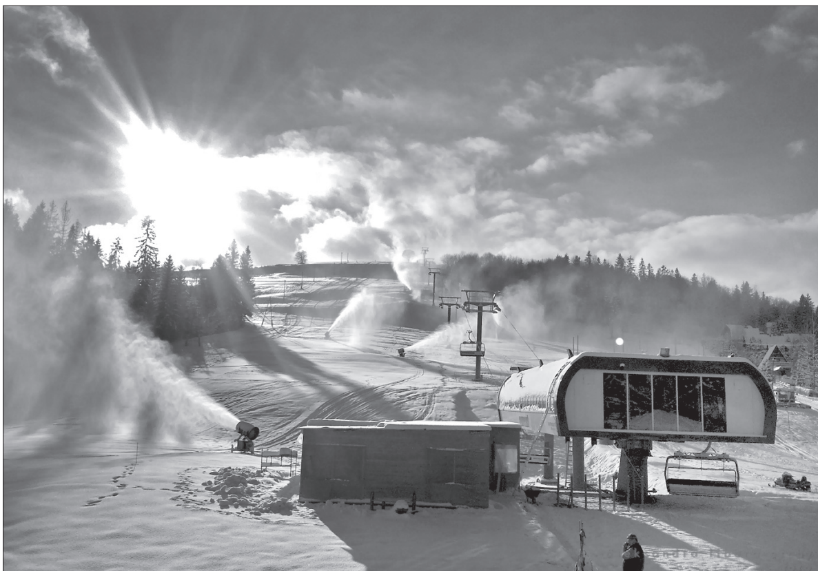
O taką scenę proszą narciarze.

Komu Istebna wydaje się zbyt odległa (leży 16 km od Jabłonkowa), może nadchodzące świąteczne dni spędzić w czeskiej części Beskidów. Ze śniegiem na nartostradach jest jednak jak na razie krucho. Od ub. tygodnia działa co prawda ośrodek „Kempaland” w Bukowcu, a także w Bilej czynna jest już kolejka kanapowa na głównym stoku oraz kilka mniejszych wyciągów, w pozostałych ośrodkach jest raczej nieciekawie. Na kłopoty ze śniegiem narzeka nawet mosteczki „Skiareal”, który ze względu na odwilż nie może kontynuować naśnieżania nartostrad i czynny jest tylko w godzinach wieczornych. – Sytuacja zmienia się z dnia na dzień. Wszystko zależy od pogody. Co rano, zaraz o godz. 7, podajemy aktualną informację dotyczącą funkcjonowania wyciągów – dowiedzieliśmy się wczoraj