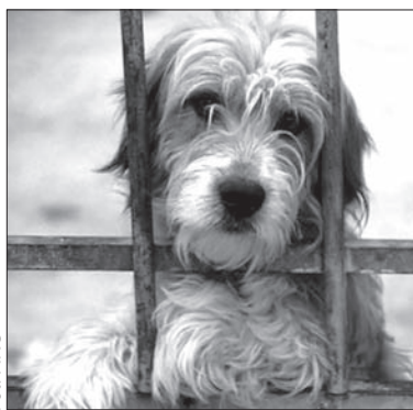
Spojrzenie z głębi psiej duszy...

Mieszkańcy Czeskiego Cieszyna mają w domach ponad dwa tysiące psów. Warto dodać, że od 2009 roku miasto ma do dyspozycji specjalny odkurzacz do usuwania psich ekskrementów. (kor)