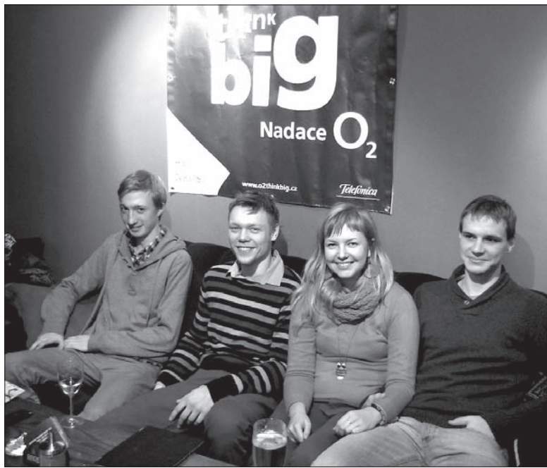
Młodzież nie jest wobec „Psiska” obojętna.

Praca wolontariuszy polegała zarówno na pisaniu projektu, jak i jego realizacji. Dzięki ich zaangażowaniu zorganizowana została zbiórka charytatywna, przygotowany też został sobotni koncert. Ich zadaniem będzie również przekazanie zebranych rzeczy do konkretnych schronisk. Z racji tego, że każde schronisko ma nieco inne potrzeby, do niektórych pędurują przede wszystkim koce i materace, do innych z kolei karmy dla szczeniaków. W klubie „Dziupla”, który związany jest z „Psiskiem” od samego początku, zainstalowana została także wystawa fotografii psów z trzynieckiego schroniska. Dzięki konkretnym informacjom umieszczonym pod zdjęciem każ-