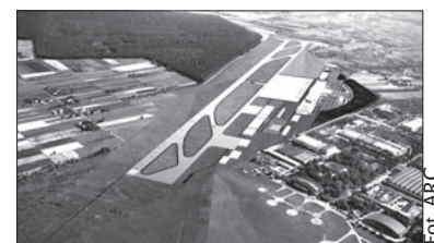
Port Lotniczy w Lublinie z lotu ptaka.

Już w piątek polskie lotnictwo miało powody do świętowania. Swój pierwszy rozkładowy lot, z Warszawy do Pragi, odbył nowy Boeing 787 Dreamliner w barwach Polskich Linii Lotniczych LOT. Podróż trwała 57 minut. Nowoczesny samolot po odbyciu serii promocyjnych lotów po Europie będzie obsługiwał linie transatlantyckie. – Cieszę się, że pasażerowie z Czech jako pierwsi będą mieli okazję doświadczyć komfortu podróży na pokładzie najnowocześniejszego pasażerskiego samolotu świata należą-