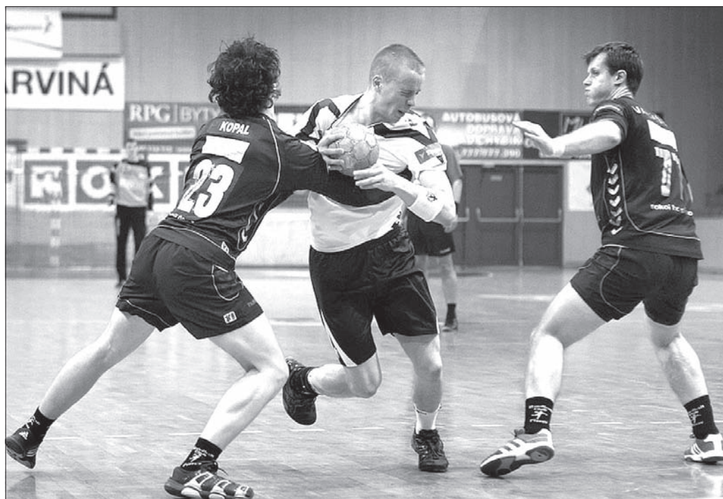
Pojedynki z rosyjskimi obrońcami Przerowa bołaty i to bardzo.