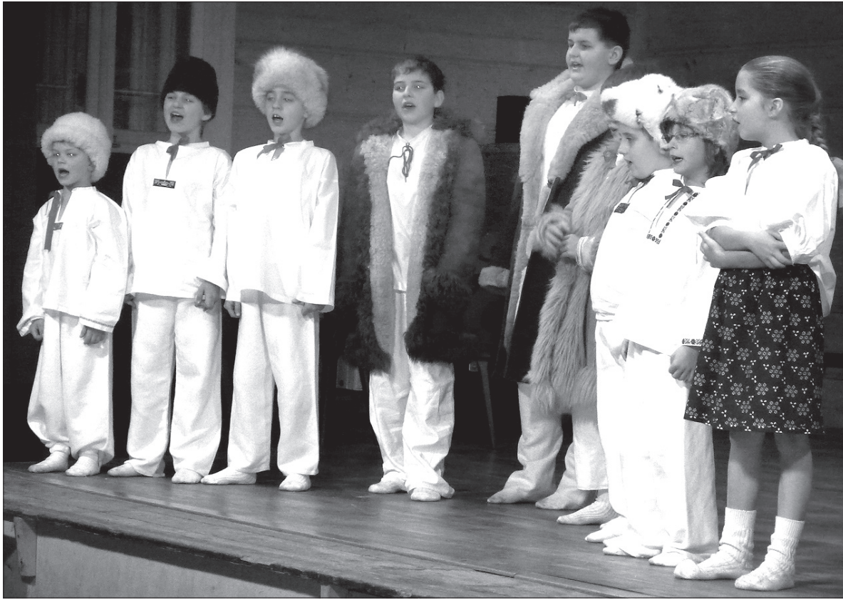
Scena mosteckiego Domu PZKO należała w niedzielę do dzieci.

– Wszystkie imprezy, w których nasi uczniowie występują wraz z przedszkolakami, odbywają się zazwyczaj w miejscowym Domu PZKO, gdyż pomieści on wiele osób. Program świąteczny przygotowujemy na przemian z obchodami Dnia Matki, dlatego w przy-