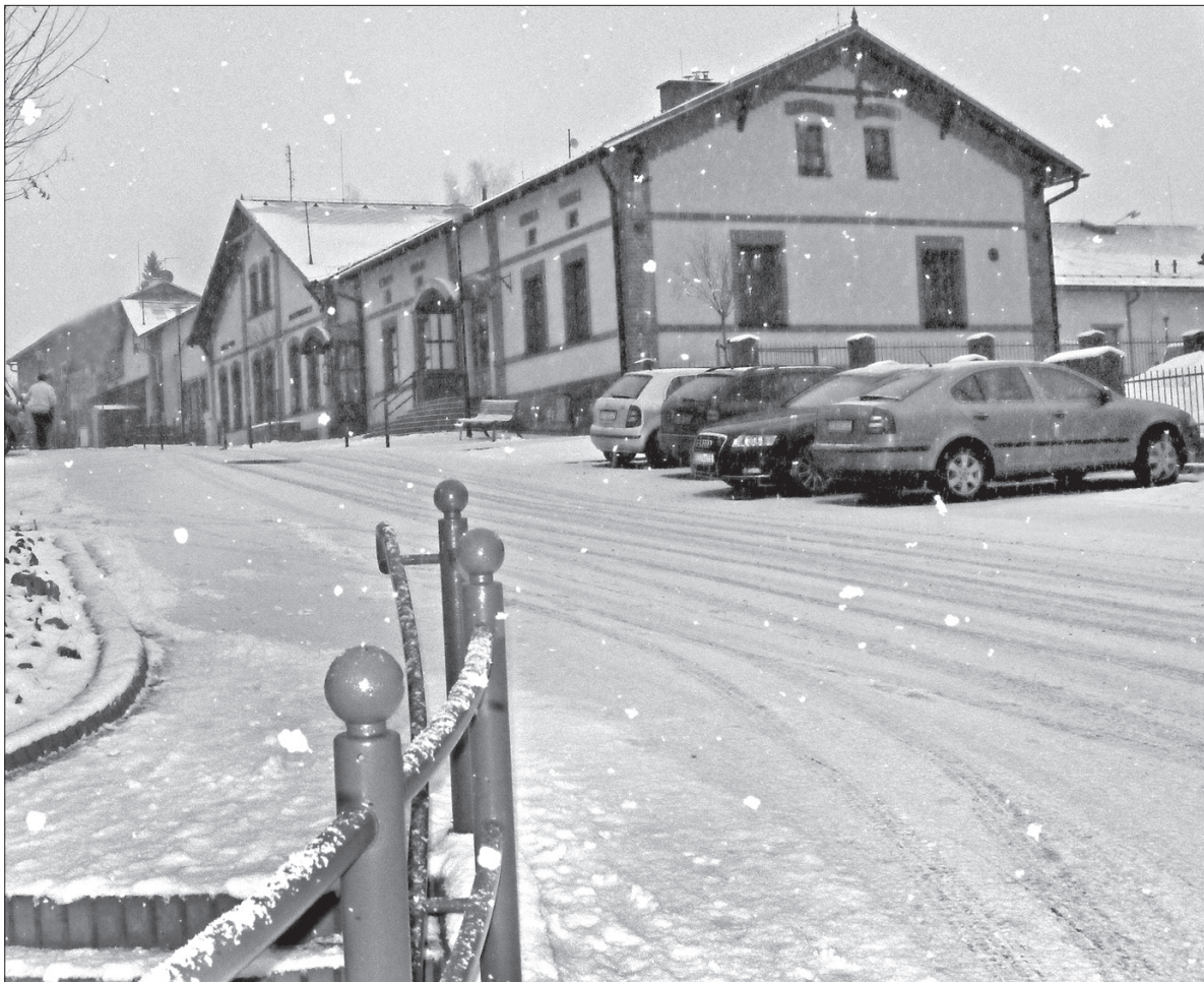
Centrum Suchej Górnej w zimowej szacie.