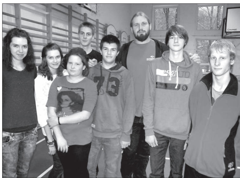
Tomasz Majewski w gronie swoich młodych kibiców.