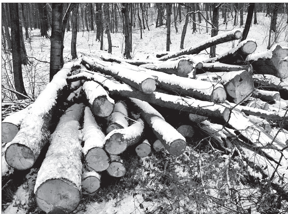
Powycinane drzewa w rezerwacie Wielkie Doły.