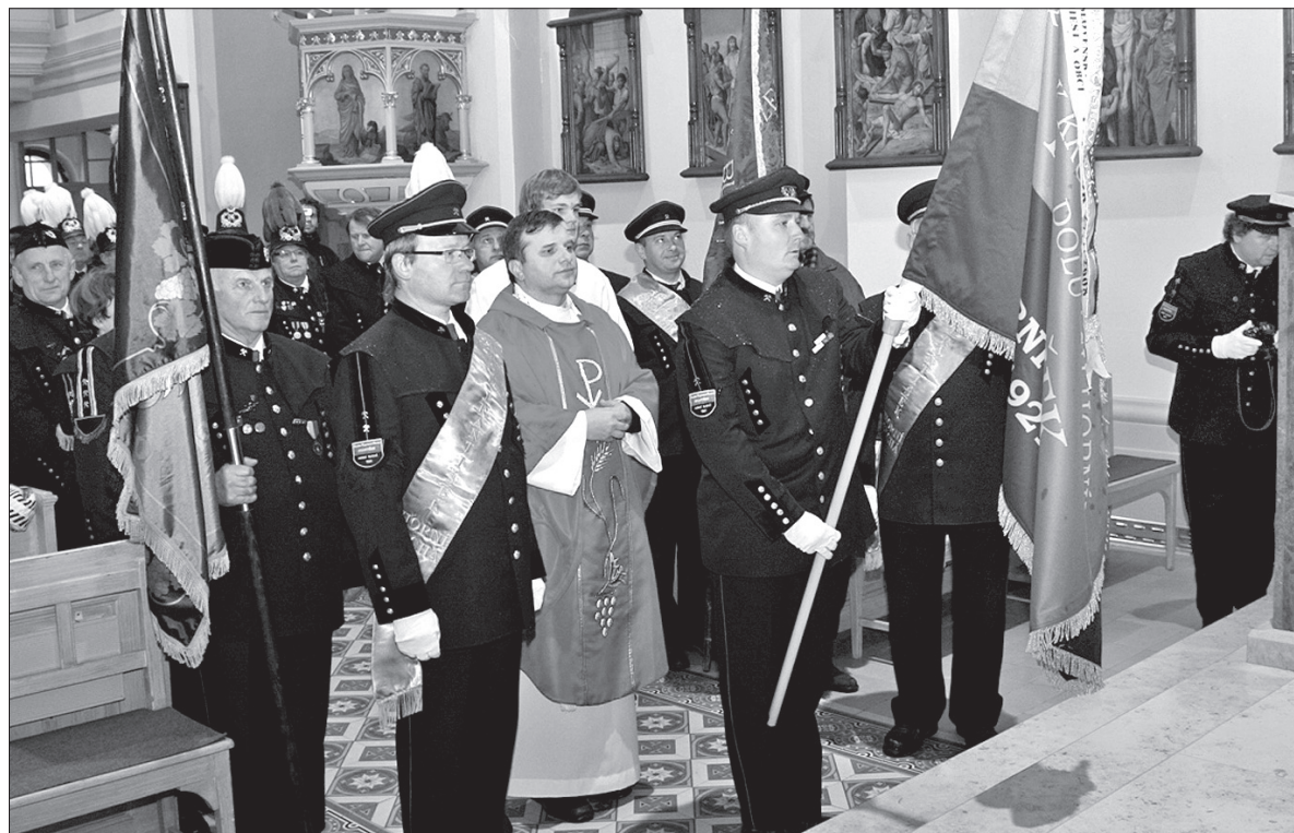
Umundurowani górnicy Kopalni „Franciszek” przyszli do kościoła, żeby poświęcić nowy sztandar.

Oprócz nowego sztandaru umundurowanym górnikom Kopalni „Franciszek” udało się w tym roku kupić również nowe czapki z odznakami. 10 tys. koron uzyskali na ten cel z grantu Fundacji OKD. (sch)