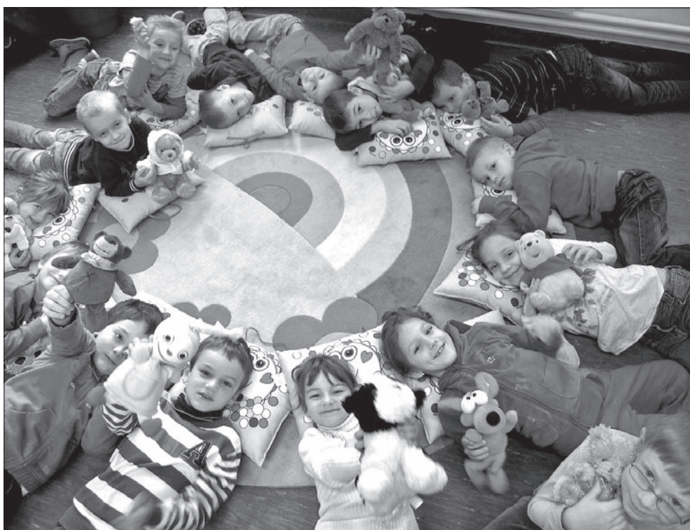
Fot. ANDREA OPLUŠTILOVÁ