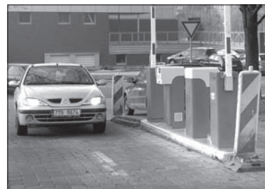
Już za kilka dni za parking trzeba będzie płacić.

Już w przyszłym tygodniu trzeba będzie płacić za postój na głównym parkingu przy Szpitalu z Polikliniką w Hawierzowie. Opłaty będą stosunkowo wysokie: 10 koron za każdych rozpoczętych 30 minut, a począwszy od trzeciej godziny trwania postoju – 10 koron na godzinę. Obowiązujące będą zarówno w dni powszednie, jak i w weekendy. Szlabany i kasy są już gotowe. Mają zostać uruchomio-