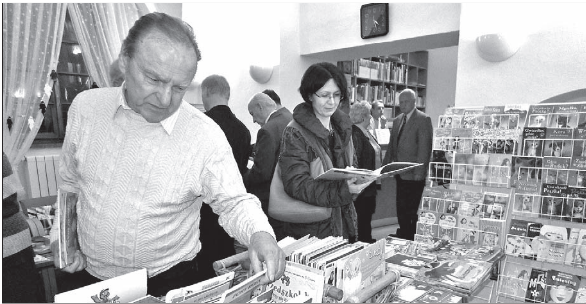
Przez dwa tygodnie można oglądać i kupować polskie książki.