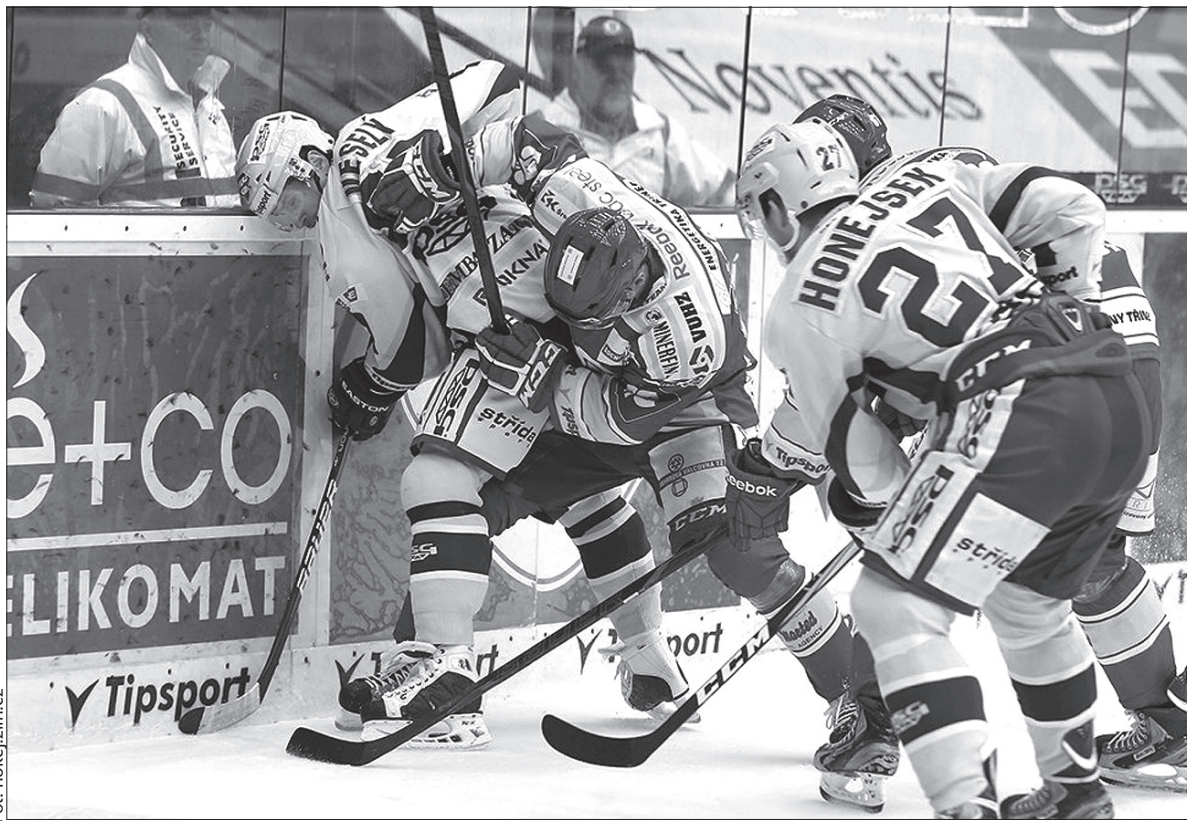
Trzyniecianie przegrali drugi mecz z rzędu. Tym razem na wyjeździe ze Zlinem.

Gospodarze po strzale Čajánka w przewadze liczebnej wyszli na prowadzenie. Trzyniecianie rozpoczęli spotkanie od wysiadania na ławce kar, ale w 11. minucie sami w prze-