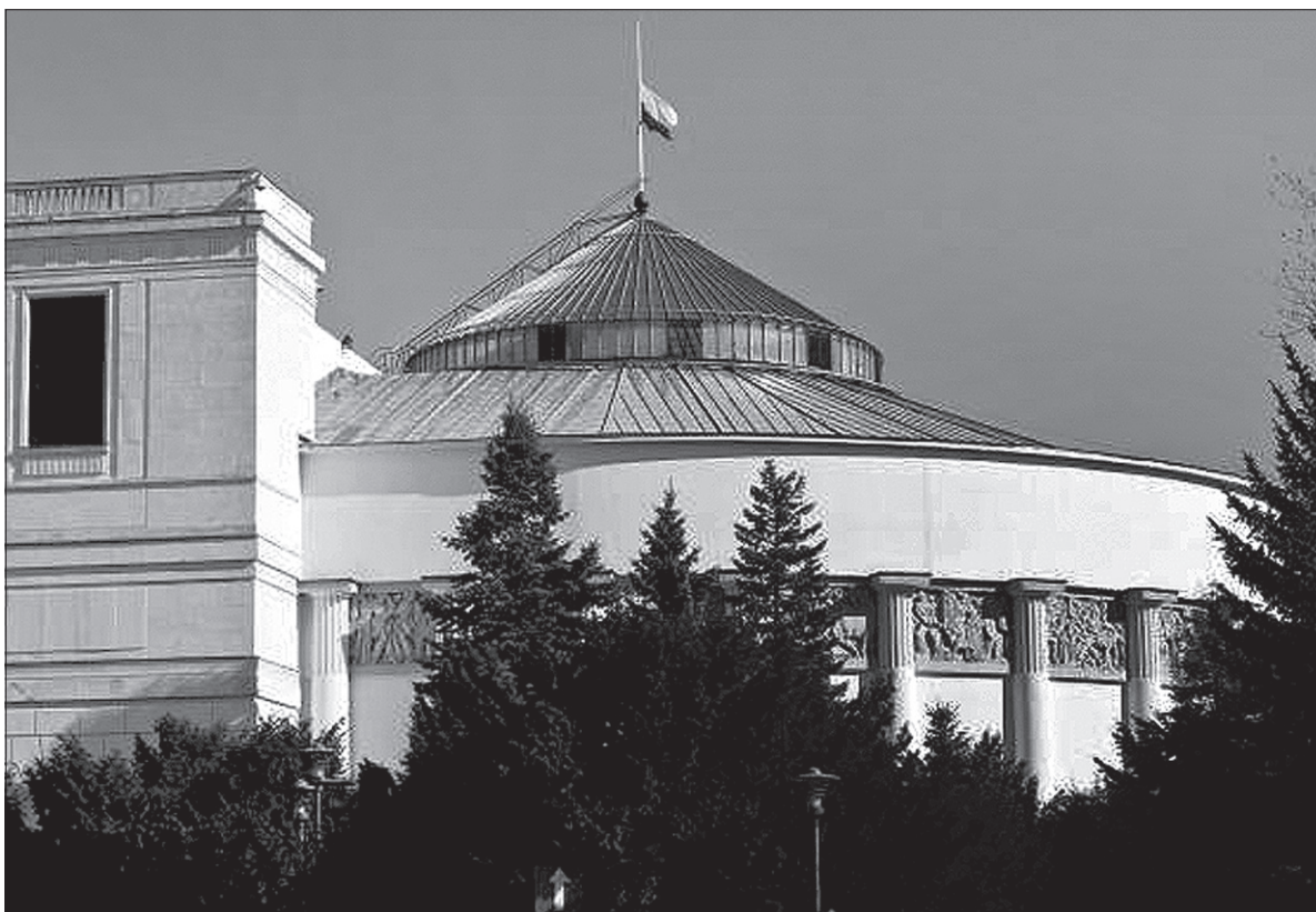
Brunon K. chciał przeprowadzić zamach przed Sejmem.

Jak poinformował dziennikarzy rzecznik prasowy ABW, ppłk Maciej Karczyński, działania operacyjne potwierdziły wcześniejsze informacje. Za pomocą prowadzonych wykładów Brunon K. zamierzał pozyskać osoby o podobnych poglądach politycznych i negatywnym nastawieniu do władz Rzeczypospolitej Polskiej. Następnie przy udziale tych osób planował dokonanie przestępstwa