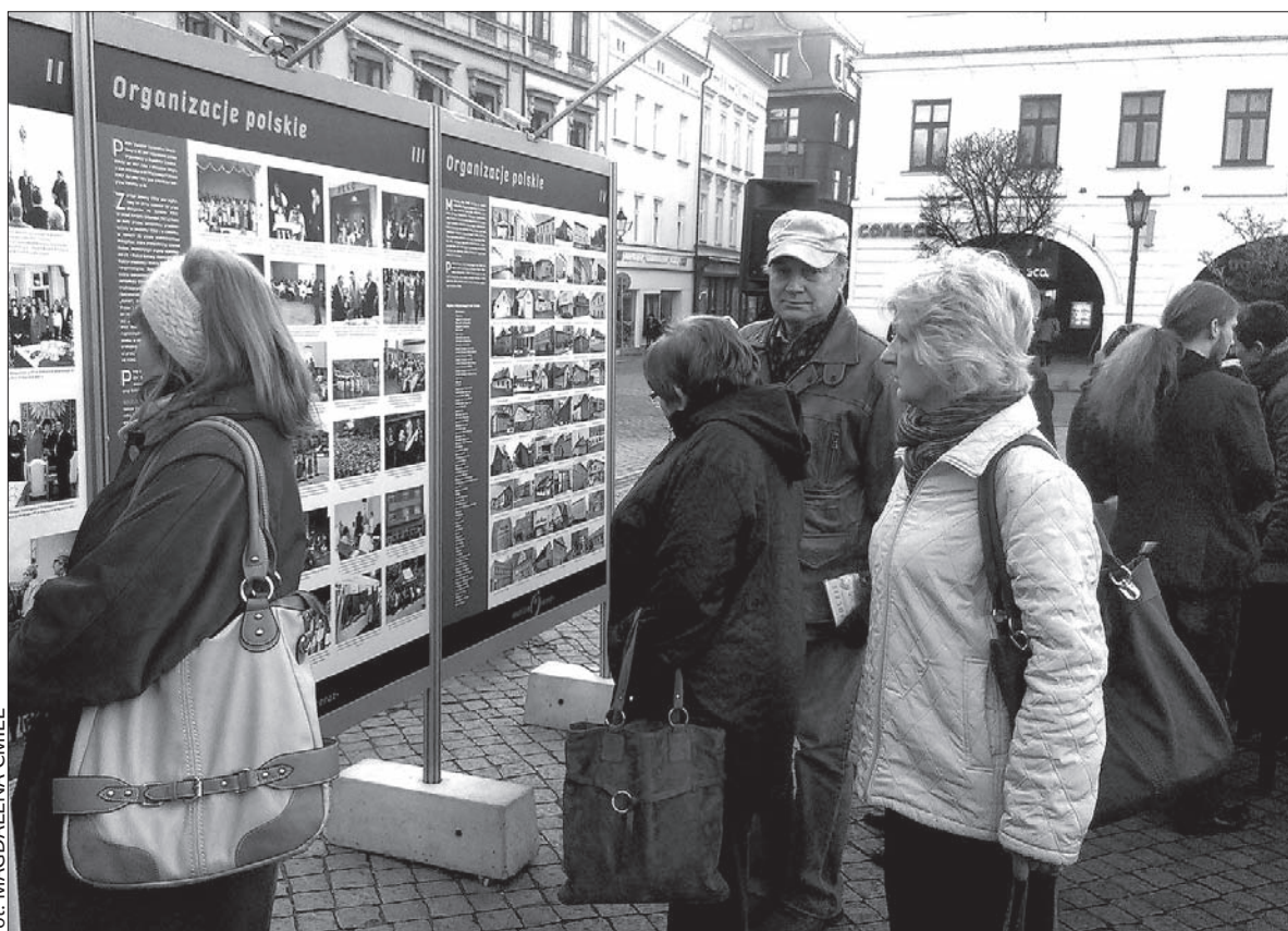
Wystawę plenerową na cieszyńskim Rynku można oglądać do końca roku.

– Wystawa pokazuje współczesne oblicze polskiej grupy narodowej. Na 20 planszach można zobaczyć ponad 600 różnorodnych reprodukcji: foto-