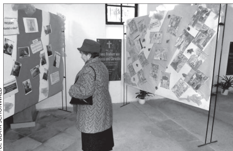
Uroczystościom jubileuszowym kościoła w Gnojniku towarzyszyła wystawa rysunków dzieci pn. „Kościół we wsi”.