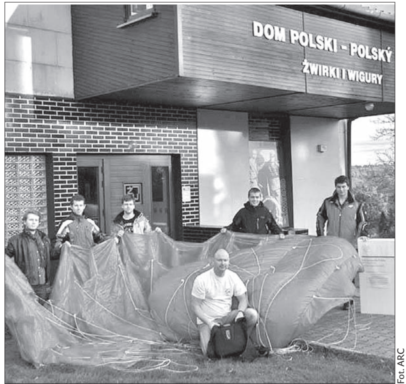
Uczestnicy szkolenia spadochronowego.

W obchody 200-lecia poświęcenia kościoła włączyła się również gmina w Gnojniku, przekazując parafii dar finansowy w wys. 200 tys. koron. Pieniądze zostaną przeznaczone na wymianę systemu zegarowego na wieży kościelnej oraz zawieszenia dzwonów. (sch)