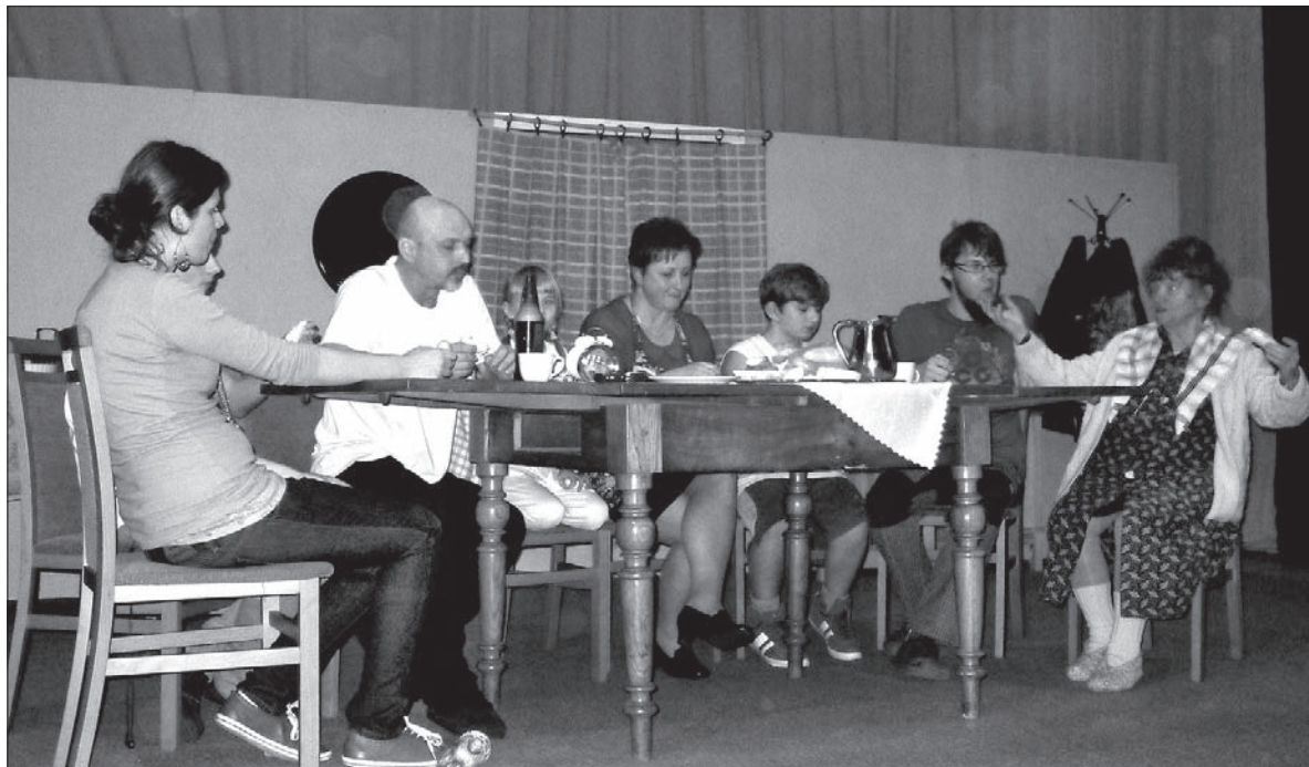
Wielopokoleniowa rodzina w sztuce „Jo zaś nic nie wiym”.

„Jo zaś nic nie wiym” jest jej pierwszą sztuką i pierwszą pracą reżyserską. – Czego ja nie domyśliłam jako autorka scenariusza, domyśleli