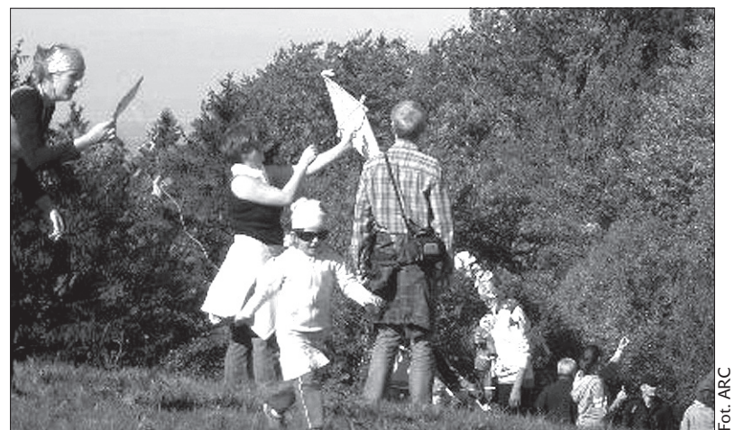
Przedszkolaki z Czeskiego Cieszyna puszczały latawce na Filipce.

bardzo przyjemnie, w doborowym towarzystwie, pośród przyrody, która nas na każdym kroku zadziwiała – a to przepięknym słońcem, a to kolorami liści na drzewach, to znowu widokami czy ogromnymi muchomorami rosnącymi tuż przy drodze. Gdy dotarliśmy na łąkę, na górze czekała nas najtrudniejsza część wycieczki – sprawdzenie, czy nasze latawce wzbiją się w niebo. Niektóre błyskawicznie poszybowały wysoko, inne były odporne, ale rodzice nie dawali za wygraną i w końcu nawet niektóre własnoręcznie robione latawce szybowały. W przyszłym roku