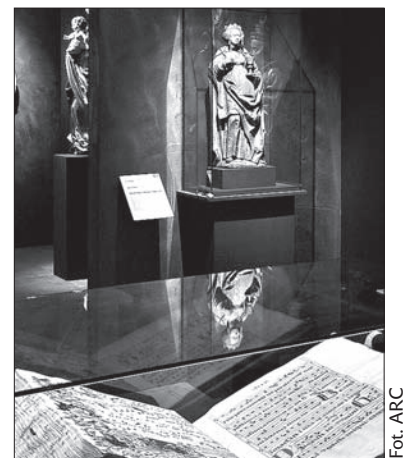
Fragment wystawy w Kutnej Horze.

Wystawa jest już w toku przygotowań w Zamku Królewskim i Muzeum Narodowym w Warszawie. (o)