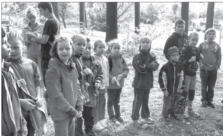
Uczniowie mosteckiej szkoły na ścieżce edukacyjnej w Jabłonkowie.