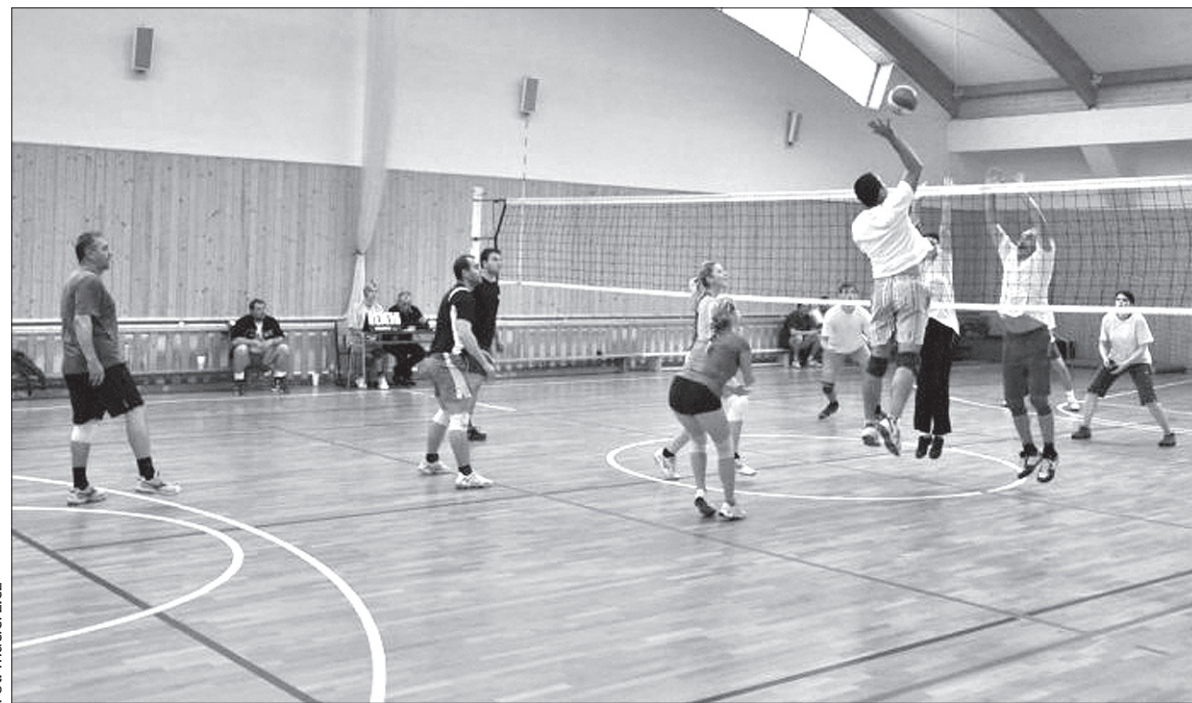
Mecze stały na zaciętym poziomie.