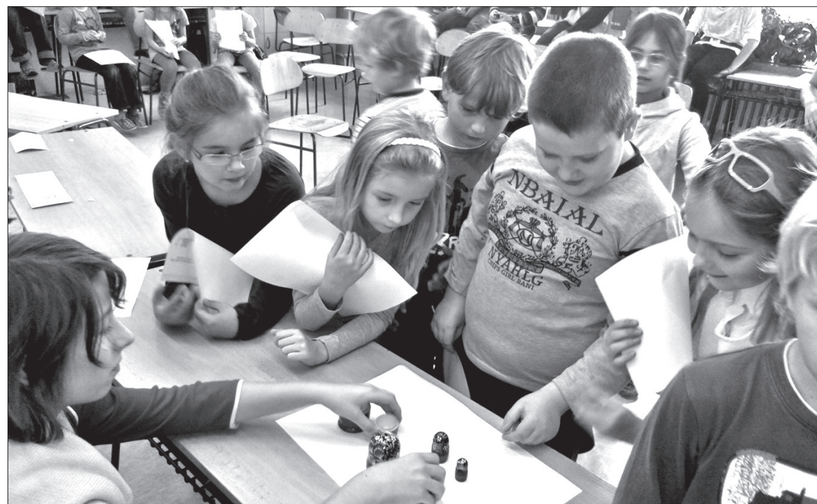
Dzieci zafascynowane matrioszką.