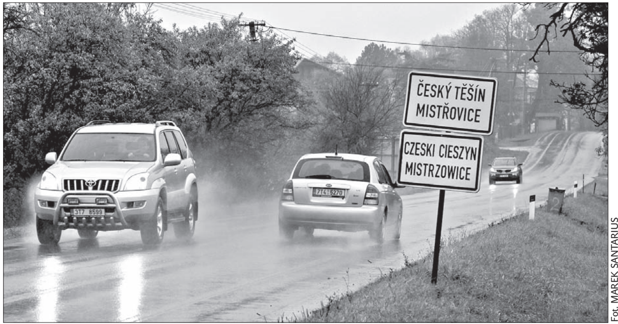
Czytelny polski napis na tablicy wjazdowej do Mistrzowic to zasługa Jana Walicy.

Tym razem postanowił wykorzystać ściereczki na wyczyszczenie tablicy w Mistrzowicach. W poniedziałek ok. 16.30 podjechał samochodem przed tablicę. – Na szczęście polski napis jest umocowany dosyć nisko, bez problemu mogłem go dosięgnąć. Zużyłem cztery ściereczki