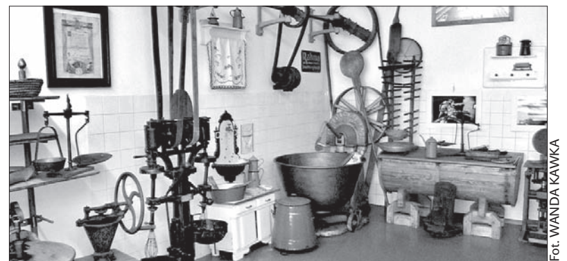
W muzeum znajduje się wiele ciekawych i zabytkowych eksponatów.

Dalszą część muzeum wypełniają najróżniejsze i ciekawe ekspozycje, które można dziś nazwać starociami albo rupieciami z domu, ogrodu, warsztatu. Mam na myśli stare pomoce w gospodarstwie domowym od różnego rodzaju wag, talerzy, serwetek, form do pieczenia ciast począwszy, poprzez kołowrotki, żelazka, maszyny do szycia, aż po aparaty fotograficzne. Żeby zwiedzanie było dla uczestników bardziej atrakcyjne, przewodnik niektóre ekspozycje nie tylko prezentował, ale też zadawał nam pytania. Np. „Czy państwo wiedzą, do czego to służyło?”. Więc zgadywaliśmy. Często sam był zaskoczony i zdziwiony, iż znaleźliśmy prawidłową odpowiedź. Bowiem wiele starych rzeczy nasi uczestnicy znali i pamiętali z domu dziadków, rodzi-