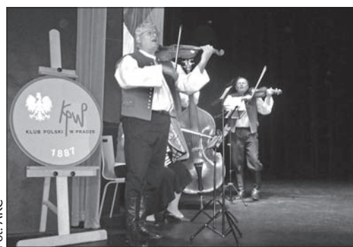
W Pradze zagrała też Kapela „Olza”.