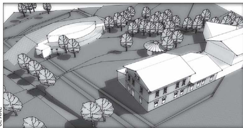
Śmiała koncepcja ośrodka w Bażanowicach.

Do końca roku pomysłodawcy budowy ośrodka chcą zamknąć etap przygotowania architektonicznego. (wot)