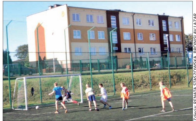
...oraz rywalizacji sportowej.