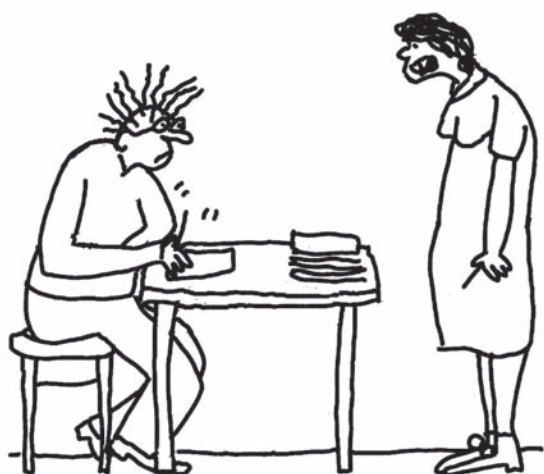
Już masz wybranych kandydatów?