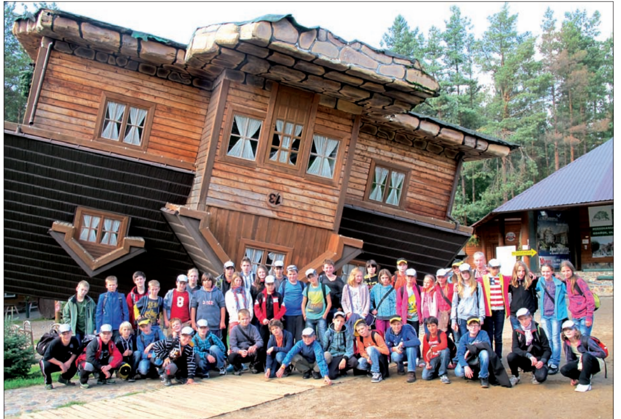
Dom do Góry Nogami w Szymbarku.