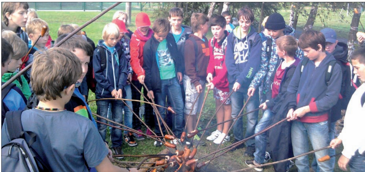
Tradycyjne piekanie parówek.