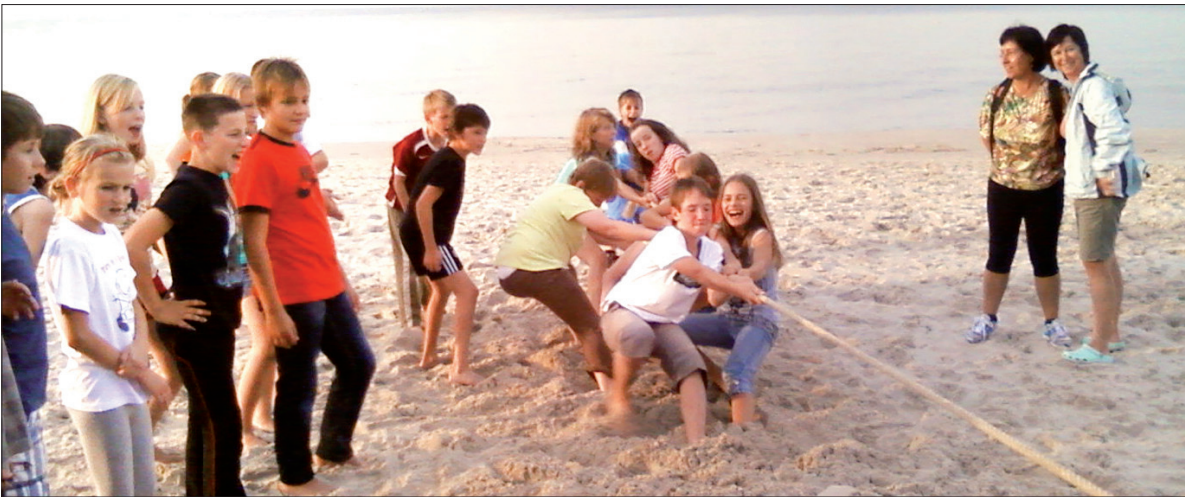
Podczas pobytu nie może zabraknąć zabaw na plaży...