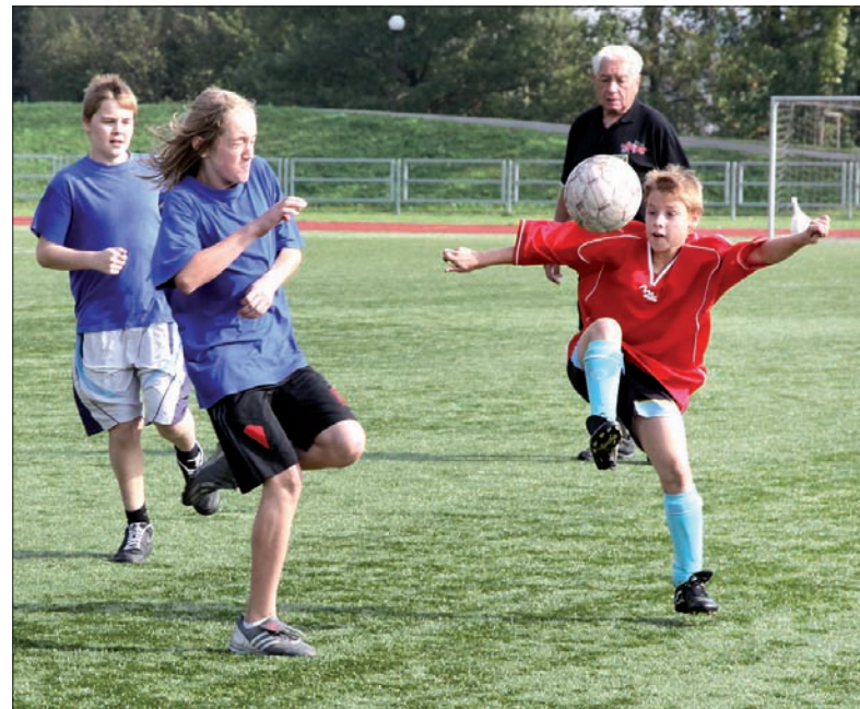
Spotkanie Czeskiego Cieszyna B z Błędowicami.