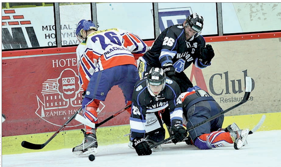
Hokeiści Hawierzowa kontynuują zwycięską passę. W ostatniej kolejce pokonali 6:2 Nowy Jiczyn.