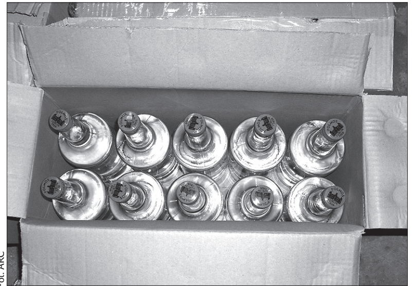
Alkohol zatrzymany przez celników w Czeskim Cieszynie.

Mężczyzna nie przedstawił żadnych dokumentów o legalnym zakupie alkoholu. Ten zaś został umieszczony w strzeżonym magazynie Urzędu Celnego. Celnicy oszacowali, że w przypadku zatrzymanego towaru, państwo straciłoby na podatkach blisko 160 tys. koron. (kor)