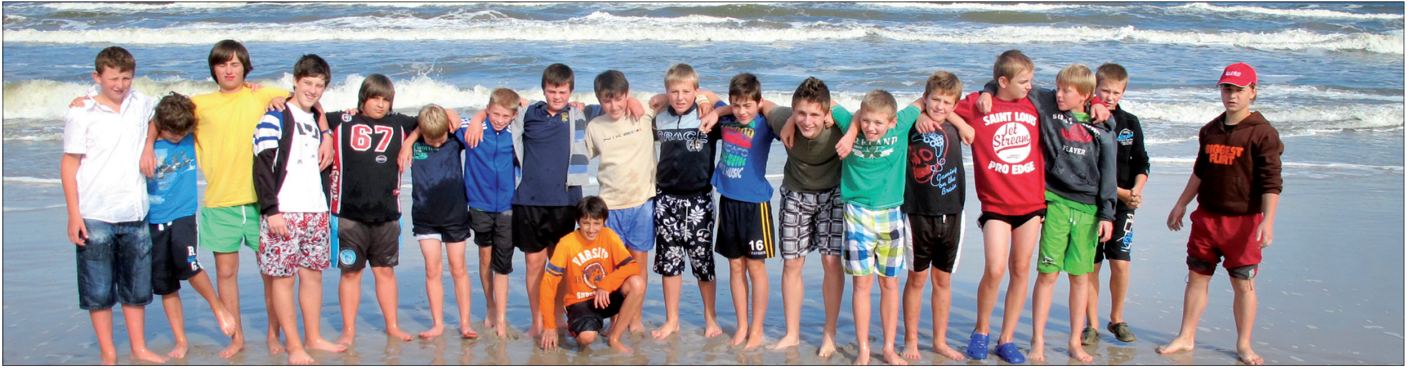
Zdjęcie na tle Bałtyku – bezcenne...