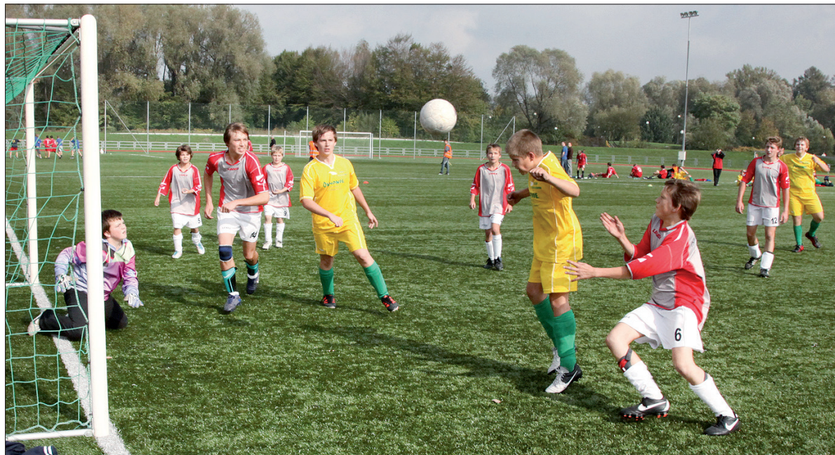
Sytuacja podbramkowa z meczu Jabłonków B – Sucha Górna.