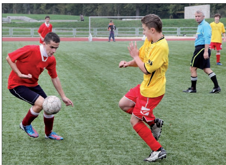
Mecz Jabłonków – Bystrzyca.