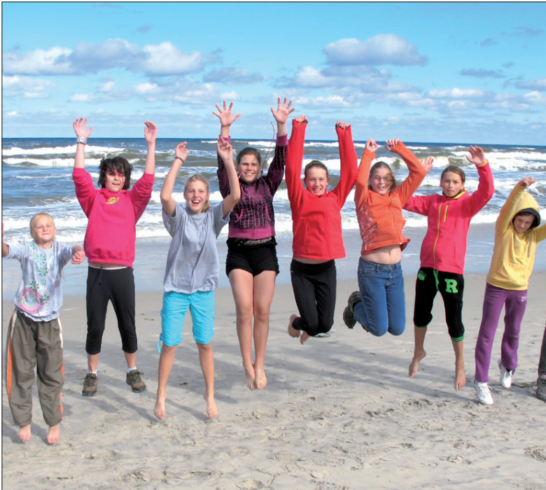
Jak tu się nie cieszyć z pobytu w tak pięknym miejscu.