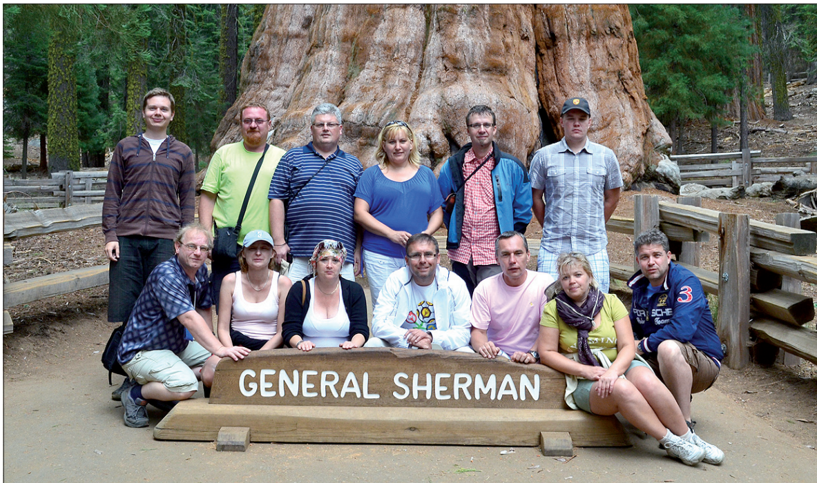
Wspólne zdjęcie w Sequoia National Parku.

Zebrała się całkiem spora grupa, z liczącej 38 uczniów klasy do Stanów wyjechało 14. Przeważali panowie, choć udział wzięły również cztery panie. Pierwsza niespodzianka spotkała uczestników już na dworcu