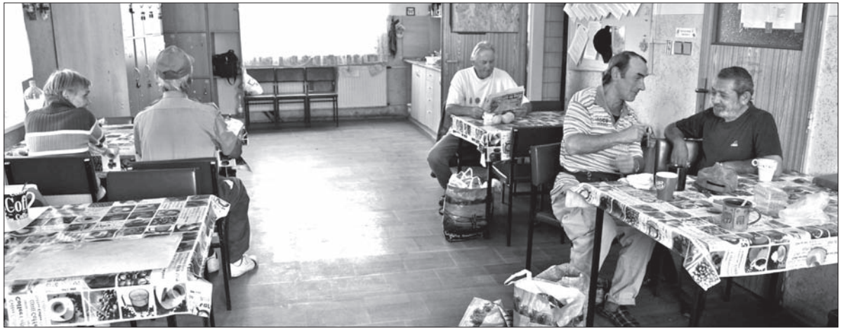
W ośrodku dziennym dla bezdomnych w Czeskim Cieszynie.

W naszym województwie policzono 2 574 bezdomnych, co przedstawia 21,5 proc. bezdomnych w skali kraju. Zaskakuje, że w Pradze jest ich o połowę mniej. – Osobiście jestem przekonany, że w Pradze jest sytuacja podobna, jak u nas, tak samo w województwie usteckim. Liczby, które uzyskaliśmy, zależne są od całego szeregu czynników: zaangażowania rachmistrzów, tego, jak rozległa jest sieć placówek dla bezdomnych i innych – powiedział Kartous. – Naszym zadaniem było przede wszystkim zdobyć dane charakteryzujące bezdomnych – ile mają lat, jakie mają obywatelstwo i tak dalej,