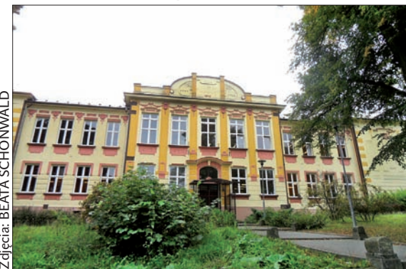
Obecnie w budynku dawnej Polskiej Szkoły Górniczej mieści się czeska podstawówka.

Polska Szkoła Górnicza w Dąbrowie była prywatną dwuletnią szkołą średnią, do której – aby zostać przyjętym – trzeba było zaliczyć co najmniej dwa lata praktyki lub cztery klasy szkoły średniej. Szkołę utrzymywał Związek Górników i Hutników Polskich w Austrii, subwencjonował rząd oraz niektóre kopalnie. Ukończyło ją 120 absolwentów, z których 65 proc. pochodziło ze Śląska Cieszyńskiego, a 35 proc. z za-