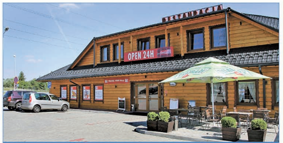
Sklep mieści się w budynku Restauracji Wygoda przy ul. Granicznej 53 w Cieszynie.

Sieć sklepów Travel FREE Shop hołduje hasłu „Witamy w raju oszczędności”. Decydując się na zakupy w tej placówce szybko przekonamy się, że nie jest to tylko zwykły slogan reklamowy. A zakupy zrobimy tu codziennie od 7.00 do 21.00.