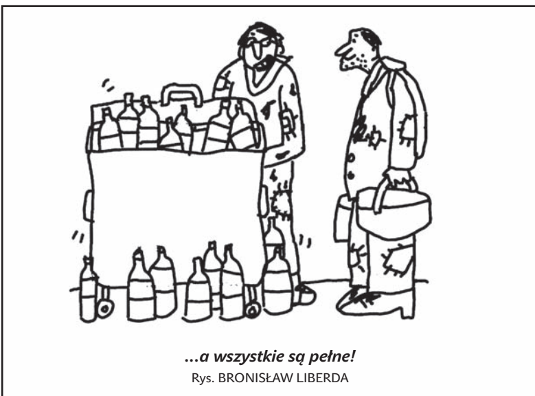
...a wszystkie są pełne! Rys. BRONISŁAW LIBERDA