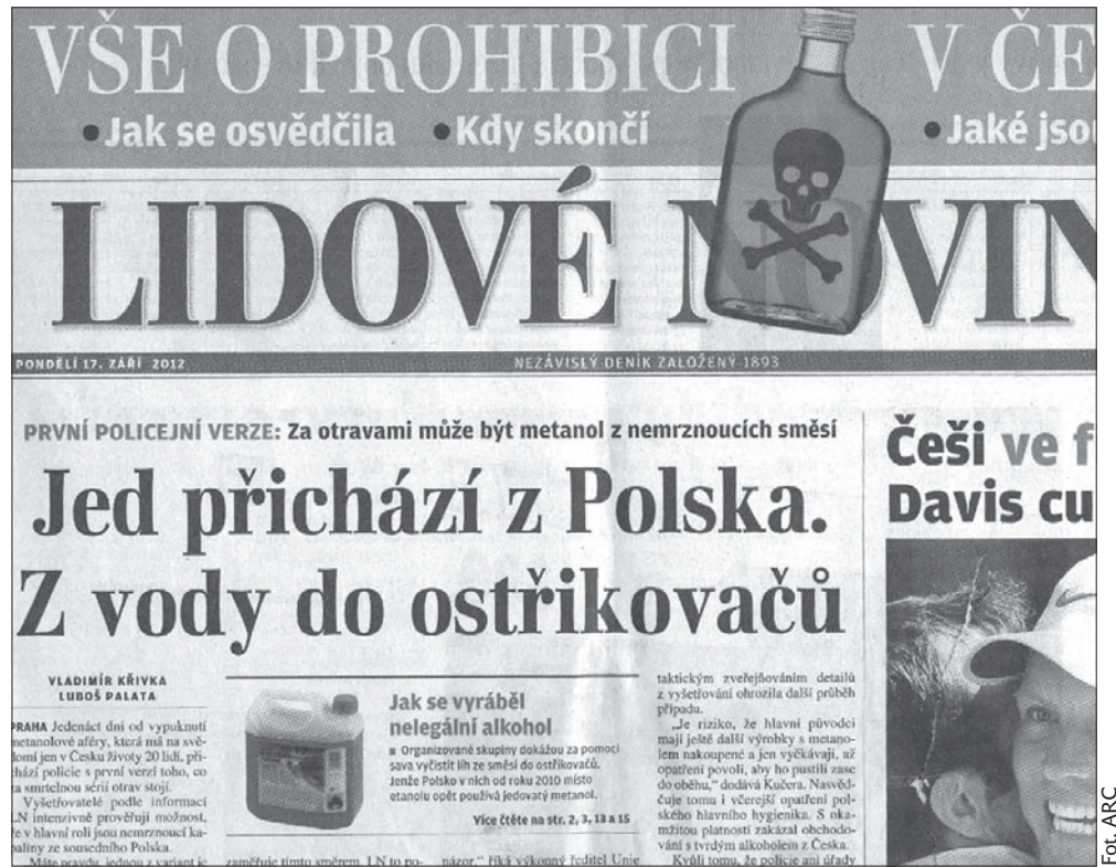
Pierwsza strona dziennika „Lidové noviny” z dnia 17 września.

W zachwycie aktora nad miążdzącą komunistyczną siłą czeskiego ducha rewolucyjnego oraz w jego pogardzie dla wdychających ku niebu Polaków tli się załazek czeskiego mitu założycielskiego demokratycznego państwa. Ma on uzmysławiać rodakom, że wyzwolenie spod czerwonej dyktatury i zaprowadzenie demokratycznego porządku dokonało się niezależnie od procesów destrukcyjnych rozsadzających od wewnątrz cały blok komunistyczny, zaśługą tylko i wyłącznie samych Czechów.