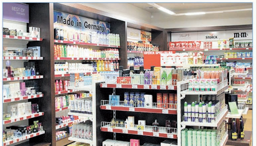
Najtańsze oryginalne produkty prosto z Niemiec.