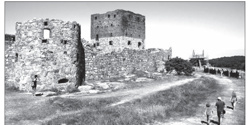
Zamek Hammershus to największa warownia na północy.

tych. Wewnątrz oglądać można malowidła przedstawiające sceny z męki Jezusa oraz średniowieczne kamienie runiczne. Oprócz rotundy w Nyker, na wyspie znajdują się jeszcze trzy inne, wszystkie z XII w. Są dziś jedną z najciekawszych atrakcji turystycznych Bornholmu. Początkowo kościoły pełniły również rolę obiektów obronnych, o czym świadczy ich trzypoziomowa konstrukcja. Tylko najmłod-