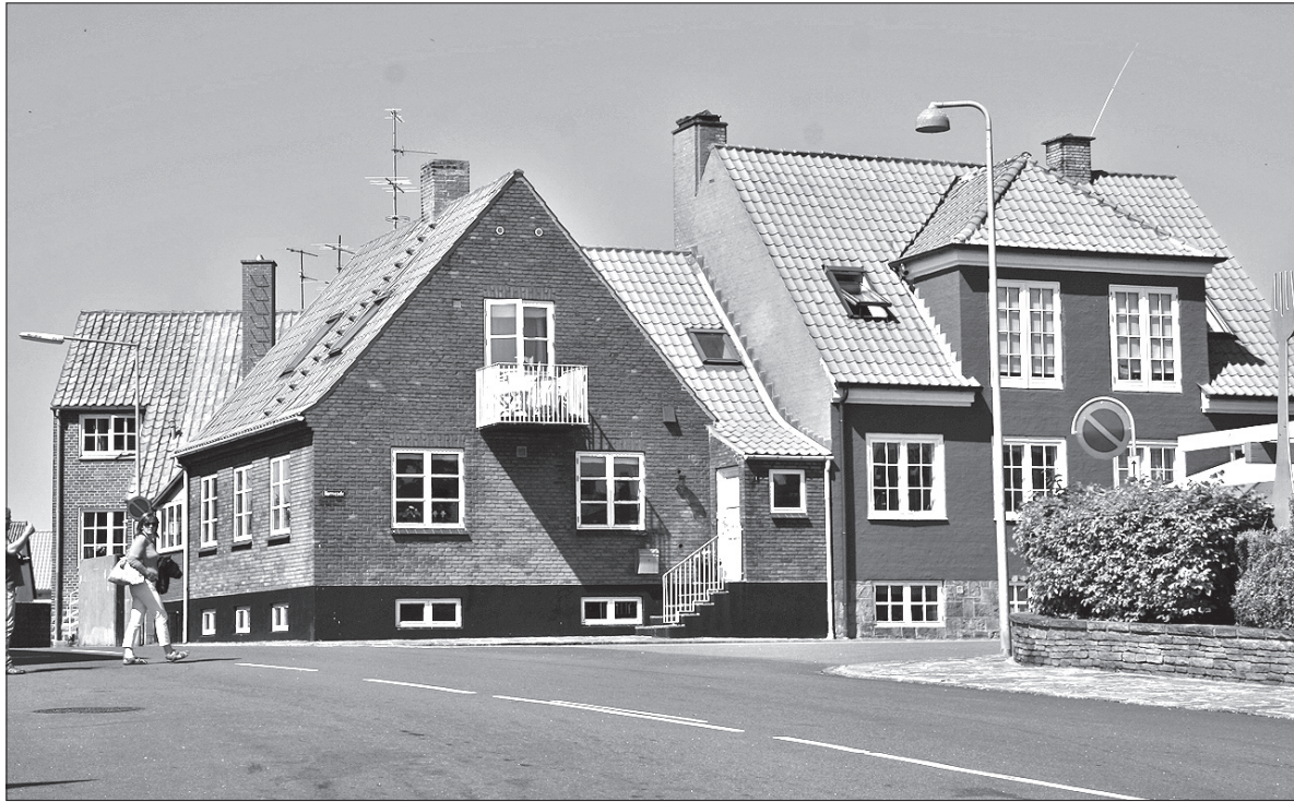
Miasteczko portowe Nexø. Tutaj można dotrzeć z polskiego wybrzeża.

Wyprawa do tej części Danii z Kołobrzegu to koszt około 180 złotych. Tyle kosztuje bowiem bilet katamaranem „Jantar” z Kołobrzegu do duńskiego portu Nexø. Rejs z polskiego wybrzeża na Bornholm trwa ok. 4,5 godziny. Wyspę „w pigułce” można zwiedzić autokarem. Taka krótka wycieczka trwa 4 albo 5 godzin, w zależności od długości trasy i, rzecz jasna, zasobności portfela. Najlepiej jednak wyruszyć na wyprawę rowerem i w ten sposób zajrzeć do wszystkich przepięknych zakątków tej wyspy. Zresztą Bornholm nazywany jest rajem dla rowerzystów. Prawie 250 km ścieżek rowerowych, prowadzonych z daleka od ulicznego ruchu, z pewnością zadowoli każdego, nawet najbardziej wybrednego amatora tego sportu. Skrajne punkty wyspy dzieli ok. 40 km, a więc bardziej wytrawni rowerzyści mogą ją okrążyć w jeden dzień. Poruszanie się po tzw. cyklowej jest komfortowe. Trasa jest dobrze oznakowana tablicami, na których podawana jest m.in. odległość do najbliższego celu, węzła szlaków itd. Dzięki temu dojazd do