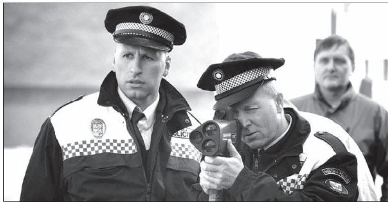
Bogumińscy strażnicy czyhają na kolejnego zmotoryzowanego grzesznika.

Bogumiński radar-cud namierzy pojazd na odległość 400 metrów. Jego możliwości techniczne są jednak o wiele większe. (sch)