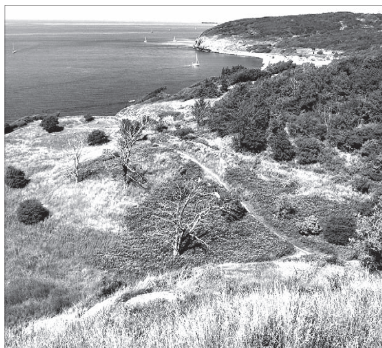
Urokliwe wybrzeże Bornholmu.

Cudowna natura bornholmska, klify, lasy, plaże, nadmorskie wioski i miasteczka, wszystko to aż się prosi, by wyspę bliżej poznać. Wyznaczone są specjalne ścieżki dla wędrowców pieszych, obejmujące najciekawsze miejsca widokowe i umożliwiające dotarcie do najpiękniejszych zakątków Bornholmu. Wielką atrakcją tej wyspy jest też park zabaw i wypoczynku Joboland z dużym aquaparkiem. Zwiedzić można też liczne bornholmskie muzea, galerie, warsztaty mieszkających na wyspie wielu artystów i twórców rzemiosła artystycznego oraz kompleks Natur Bornholm, prezentujący historię i bogactwo przyrody wyspy. Bornholm to po prostu harmonijne połączenie natury i kultury.