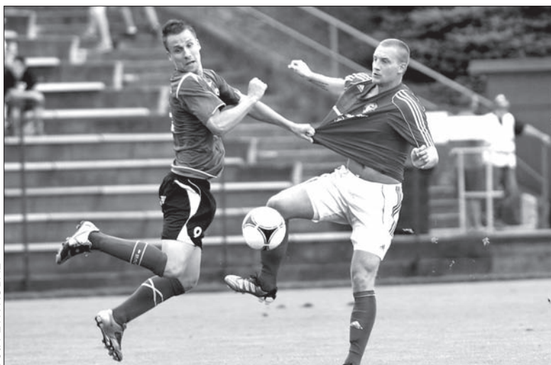
W Trzyńcu na Lešnej zagościł prawdziwy balet.

Joukl, 4. Gavlák, 15. Lisický, 84. Vlachovič. Trzyniec: Lipčák – Lisický, Švec (46. Joukl), Cigánek, Sporysz (56. Christu) – Malif, Motyčka, Hupka, Kyselý (70. Vlachovič), Eisermann – Gavlák.