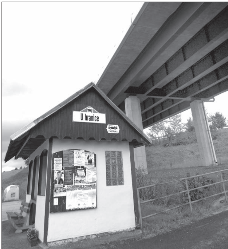
Pierwszy za granicą przystanek autobusowy w RC.

Za płotem obok szkoły 67-letni emerytowany nauczyciel oraz były