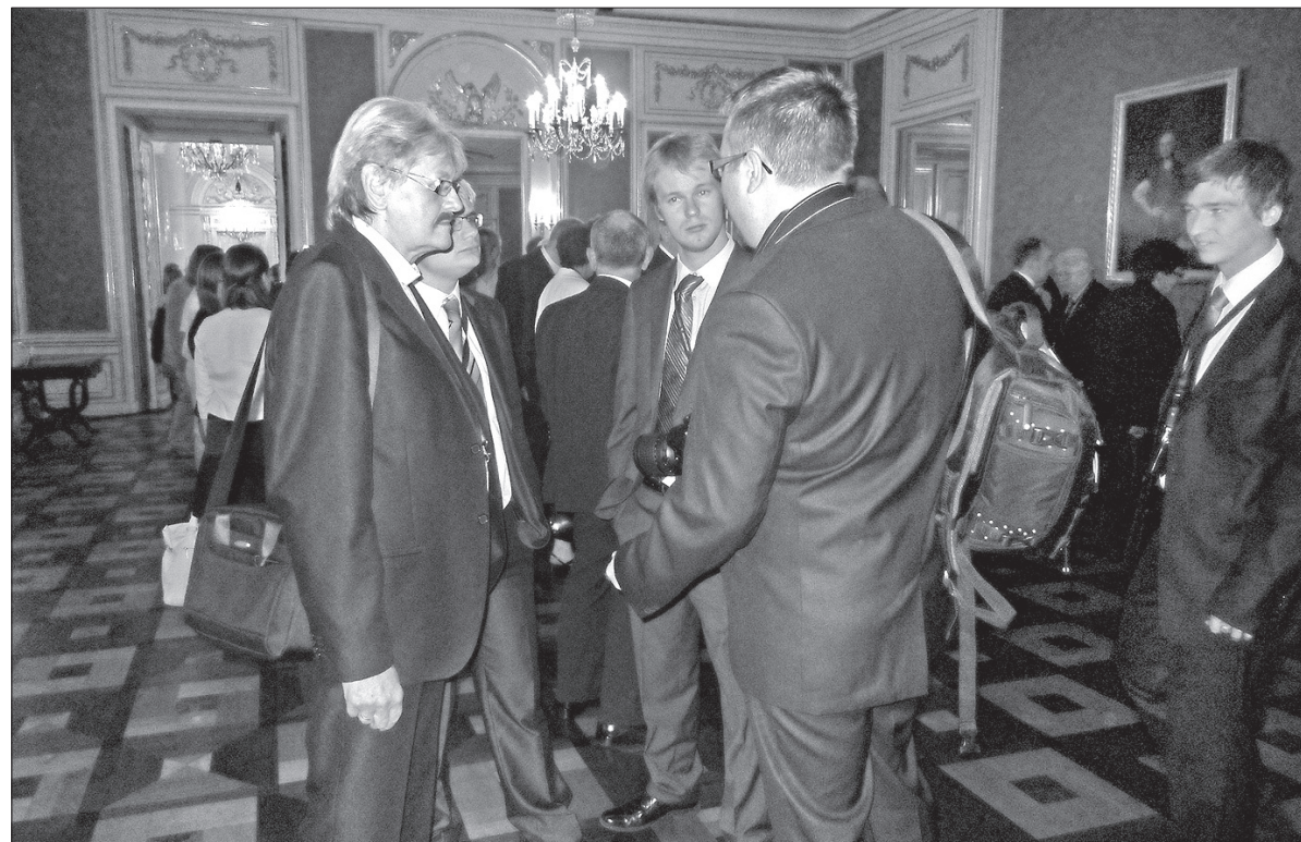
Część delegacji Kongresu Polaków w RC i PZKO w kuluarach Zamku Królewskiego.