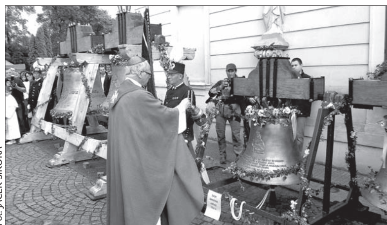
Dzwony zostały poświęcone w niedzielę.

Świątynia otrzymała nowe dzwony w ramach remontu kapitalnego, który pochłonął niemiłe 14 mln koron (11,5 mln pokryła dotacja z Unii Europejskiej). Odnowiono m.in. tynki zewnętrzne i część dachu, okna oraz drzwi. (kor)