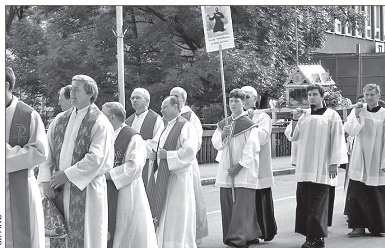
Tradycyjnie już wierni z diecezji bielsko-żywieckiej i ostrawsko-opawskiej spotkają się na moście Przyjaźni.

ogłosił beatyfikację trzech Męczenników Koszyckich, a w lipcu 1995 r. w Koszycach Jan Paweł II dokonał ich kanonizacji. (www.ox.pl)