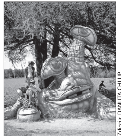
Bajkowy Hamroń jest symbolem Hamrów nad Sazawą.

Jeżeli wędrując z rodzicami czy dziadkami po Czechach, Polsce czy innych krajach natknęliście się na coś ciekawego (a z pewnością tak było), napiszcie do nas o tym. Być może z waszych propozycji skorzystają inne dzieci i ich rodzice – jeżeli nie od razu, to w przyszłe wakacje. Głosik i Ludmiłka czekają na wasze listy. (dc)