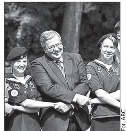
Bronisław Komorowski z harcerzami.

Jako pierwszy protektorat nad polskim harcerstwem objął Naczelnik Państwa Marszałek Józef Piłsudski. Zwyczaj ten kontynuowali następnie prezydenci Stanisław Wojciechowski i Ignacy Mościcki. Po 1989 roku tradycja ta odrodziła się za sprawą najpierw Lecha Wałęsy w 1993 roku. Następnie protektorat nad harcerstwem obejmowali Aleksander Kwaśniewski (1996 r.) i Lech Kaczyński (2008). (t)