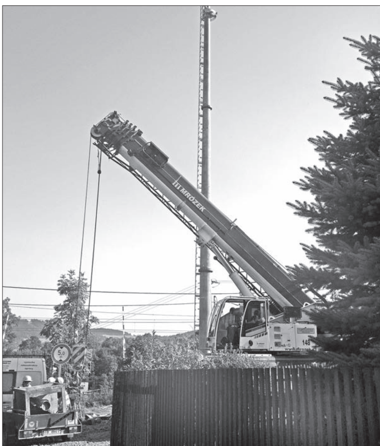
Plac budowy w Boconowicach.

Właśnie dobiega końca budowa wieży GSM na dworcu w Boconowicach. Kilka tygodni temu na terenie dworca rozpoczęto wykopy i przygotowywanie fundamentów pod przyszły przekaźnik telekomunikacyjny. W zeszły poniedziałek zbudowano w Boconowicach maszt, na którego wierzchołku zostaną umieszczone anteny i inne urządzenia lokacyjne. Budowę wykonuje firma Teplotekna Ostrava a.s. Chodzi o projekt pn. GSM-R III, węzeł Ostrava – Przerów. Projekt powinien zostać w całości zrealizowany do końca marca 2013 roku. W tym czasie na wybranych dworcach kolejowych zostaną wzniesione podobne maszty telekomunikacyjne. W przyszłości te urządzenia będą monitorowały i ułatwiały przekaz danych pomiędzy poszczególnymi stacjami kolejowymi, ale niewykorzystane, że urządzenia zostaną wykorzystane również do innych celów nie związanych bezpośrednio z koleją. Może chodzić przede wszystkim o udostępnienie przekaźników innym podmiotom gospodarczym w celu poszerzenia usług związanych z cyfryzacją okolicznych miejscowości. (ms)