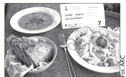
Zwycięski bogumiński stół.