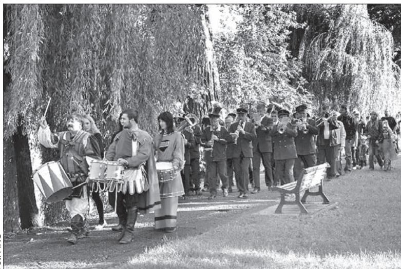
Korowód straszdył wyruszy z Czeskiego Cieszyna.

Kto nie będzie miał jeszcze dość straszdył i upiorów na cieszyńskim Wzgórzu Zamkowym, może ostatniego dnia wakacji wybrać się nieco dalej – do Ostrawy. Na Zamku Śląskoostrawskim odbędzie się ciesząca się co roku dużym zainteresowaniem impreza pod znakiem zamkowych strachów. Ale uwaga – tylko dla odważnych!