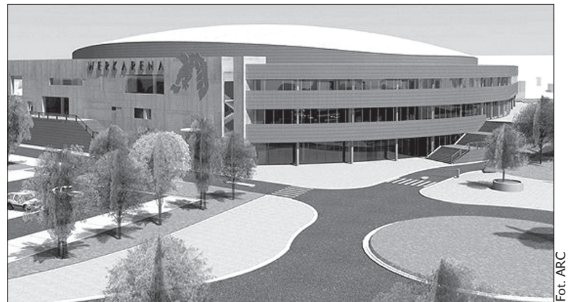
Tak ma wyglądać przyszła Werk Arena.