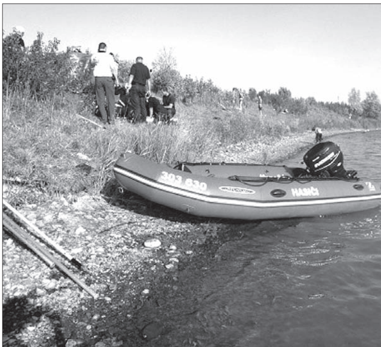
Ratownicy już dwukrotnie w tym tygodniu wyjeżdżali nad „darkowskie morze”.

– Mężczyzna przyjechał nad jezioro ze znajomym. Od razu po wyjściu z samochodu poszedł do wody. Po gwałtownym ochłodzeniu ciała prawdopodobnie zasnął – opisała