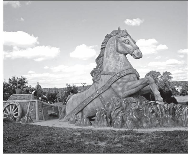
Koń z wozem obok drogi ze Żdziaru do Przybysławia.

– bo trzeba wiedzieć, że na rzeźby, o których mowa, można się wspinać, z czego wszystkie dzieci chętnie korzystają. Głosika i Ludmiłkę zainteresował natomiast Hamroń