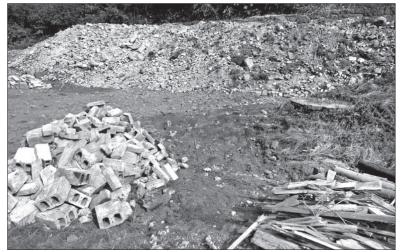
Dzisiaj po Elżbietance pozostała... kupa gruzu.