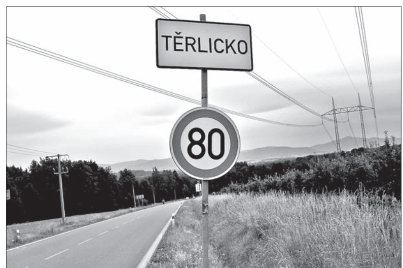
W Cierlicku nie ma już ani jednej polskojęzycznej tablicy wjazdowej.

Najprawdopodobniej oznacza to koniec Cierlicka w Těrllicku, albowiem nie należy się spodziewać,