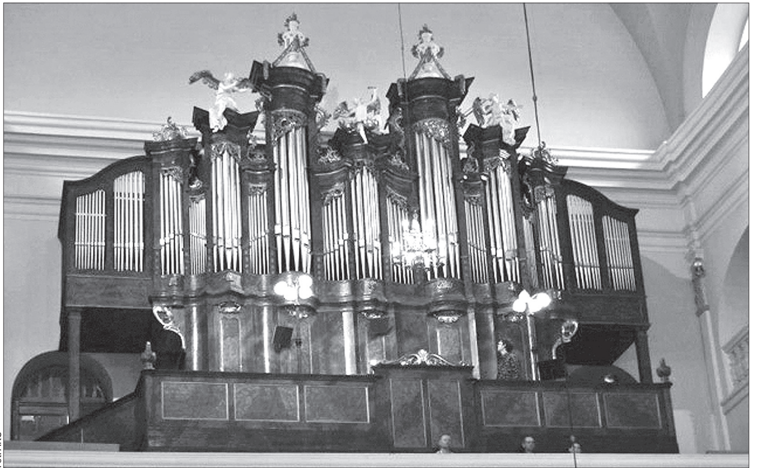
Zabytkowe organy czekają na remont.

Dokładna wysokość kosztów remontu będzie znana dopiero po rozbiórce organów. Całkowite koszty wynieść mogą nawet osiemset tysięcy zł. Prace remontowe polegać będą na całkowitej rozbiórce instrumentu, pozbyciu się żerujących w nich szkodników, naprawie bądź rekonstrukcji uszkodzonych elementów, konserwacji wszystkich jego części oraz ich ponownym złożeniu, zakończonym strojeniem i intonacją organów, mającą na celu przewrócenie im w stopniu możliwie najwyższym oryginalnego brzmienia. Organom muszą zamilknąć może nawet na dwa