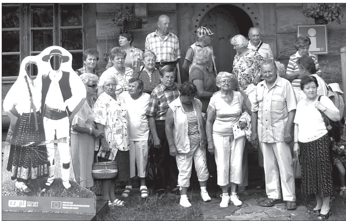
Gmina Mosty koło Jabłonkowa oferuje wiele atrakcji. Błędowiczy PZKO-wcy spędzili tutaj udany dzień.