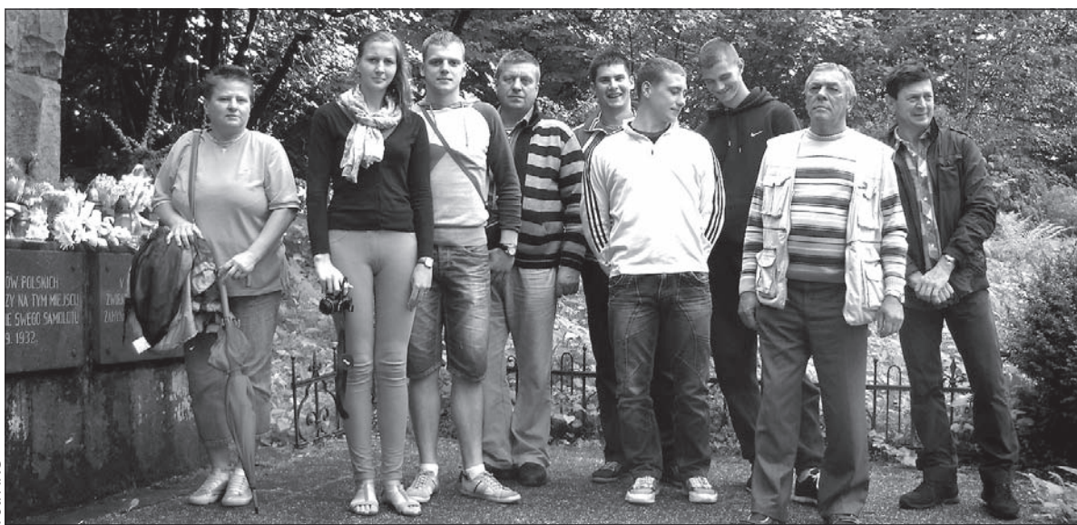
Goście z Litwy podczas wizyty na Kościelcu.