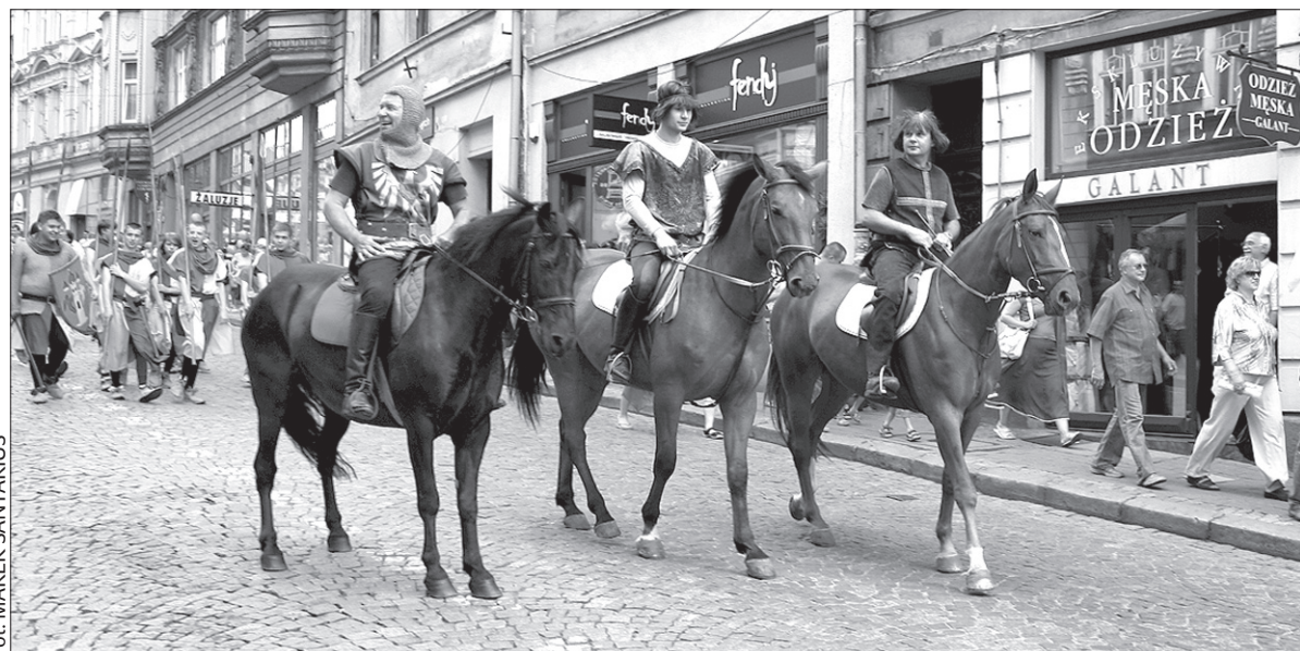
Święto Trzech Braci w Cieszynie. Na czele pochodu Czech, Lech i Rus.