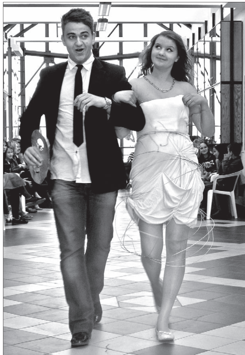
Kwiat Morwy 2011 w Gimnazjum Polskim w Czeskim Cieszynie.

Choć modelki nie będą chodziły po wybiegu, jakie znamy z profesjonalnych pokazów mody, to w najbliższy poniedziałek w Gimnazjum Polskim