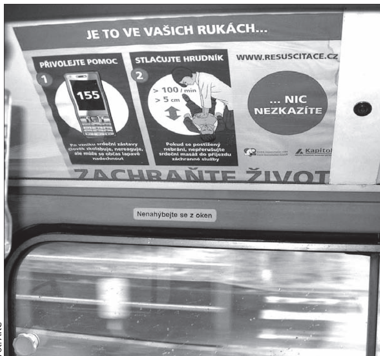
W pojazdach ostrawskiej komunikacji miejskiej wiszą już ulotki instruktażowe.