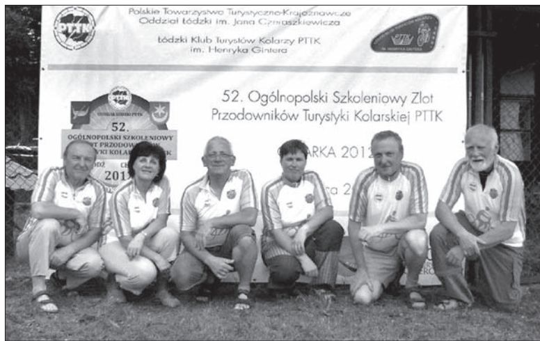
Towarzystwo Rowerowe Olza na mecie w Łodzi.

2012 jest rokiem turystyki rowerowej. Postanowiliśmy więc, że nasz „Beskid Śląski” – Towarzystwo Rowerowe Olza współpracujący z bratnim Klubem Kolarskim Ondraszek z Cieszyna weźmie udział w tegorocznym 52. Ogólnopolskim Zlocie Przodowników Turystyki Kolarskiej, który odbył się w miejscowości Stryków koło Łodzi. W tym roku po raz pierwszy aż sześciu kolarzy TR OLZA stworzyło samodzielną grupę z Republiki Czeskiej wśród około pięciuset uczestników zlotu. Program tygodniowego pobytu (od 2 do 9 czerwca) był bardzo bogaty. Zwiedzaliśmy mnóstwo zabytków historycznych (Walewice, Nieborów, Arkadię), muzea w Łodzi. Byliśmy w Łódzkiej Wytwórni Filmów Animowanych „Semafor”. Zwiedzaliśmy miasta Łódź, Łowicz i parę innych