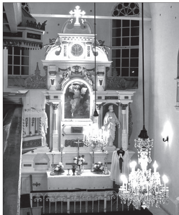
Wnętrze kościoła ewangelickiego w Orłowej.

Fundacja zorganizowała w kościele dotąd dwa koncerty – w zeszłym roku wystąpiło Zrzeszenie Śpiewacze Morawskich Nauczycieli, w marcu br. chór „Canticum Novum” z Czeskiego Cieszyna. W najbliższą sobotę o godz. 18.30 będzie koncertował znany karwiński chór „Permonik”. Organizatorzy zapraszają na koncert każdego, kto chce posłuchać dobrej muzyki, a zarazem, ofiarując chociażby drobny datek, przyczynić się do remontu kościoła. (dc)