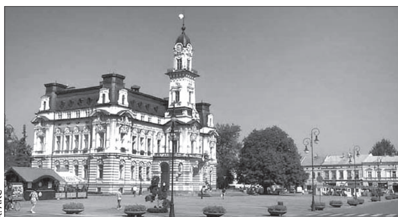
Nowy Sącz będzie gościł naszą młodzież.