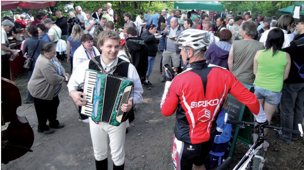
Cieślarski to niepozorny szczyt. W niedzielę zmieściło się na nim naprawdę dużo osób, chyba najwięcej w historii.

Blisko 3000 Cieślarsów żyje na Śląsku Cieszyńskim, najwięcej w Wiśle. Według danych z 31 grudnia 2010 roku Wiśla miała nieco ponad 11 tysięcy mieszkańców, w tym 989 Cieślarsów. Jak łatwo policzyć, niemal co dziesiąty wiślanin jest Cieślarskim. Jak się odróżniają od siebie? Problem mogą mieć na przykład Janowie Cieślarscy, których jest... 71.