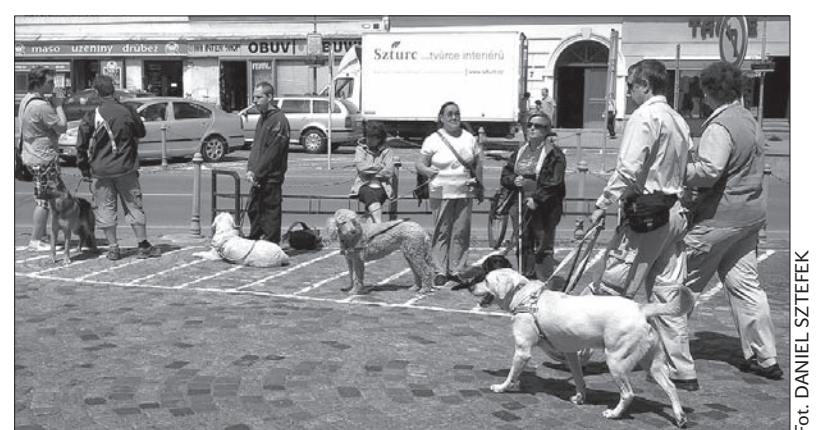
Czworonożni pomocnicy człowieka ze swoimi niewidomymi panami na Rynku Mariackim w Jabłonkowie.