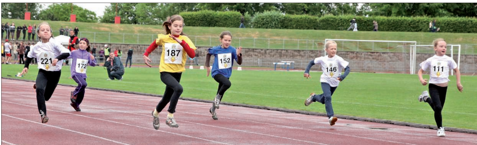
Dziewczyny w biegu na 50 m.