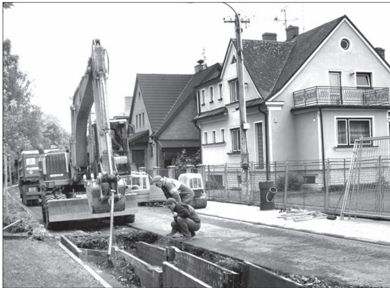
Aleja Wolności jest rozkopana. Robotnicy kładą nowe rury kanalizacyjne.

W Alei Wolności, ciągnącej się wzdłuż Olzy, prace budowlane już trwają. Na połowie szerokości drogi zdjęto nawierzchnię. Mieszkańcy okolicznych domów rozumieją, że nowa kanalizacja jest potrzebna, ponieważ dotychczasowa miała zbyt małą przepustowość, co regularnie sprawiało im problemy. – Kiedy podnosił się poziom Olzy, woda zalewała nam piwnice – mówi starszy mężczyzna mieszkający w tym miejscu od kilkudziesięciu lat. – Ale przecież kierownictwo miasta musiało wiedzieć o zaplanowanej budowie, więc dlaczego położono nowy asfalt?