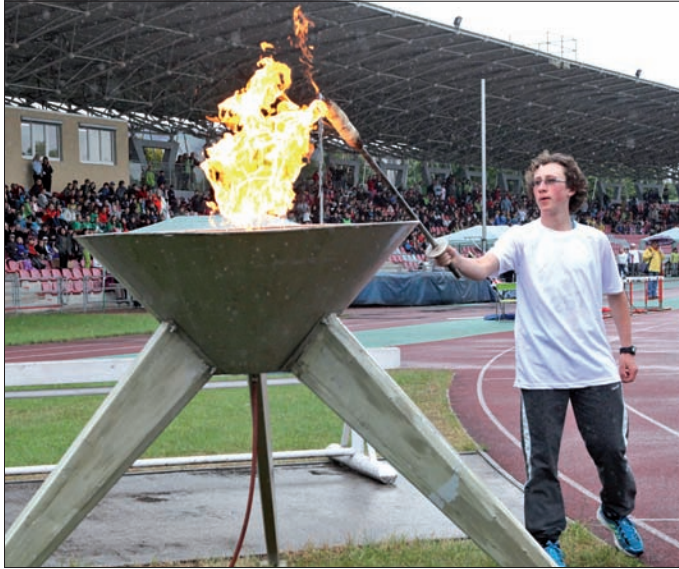
Uroczyste zapalenie znicza igrzysk.