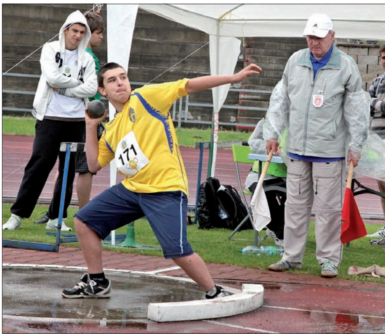
Pchnięcie kulą najstarszych chłopców.