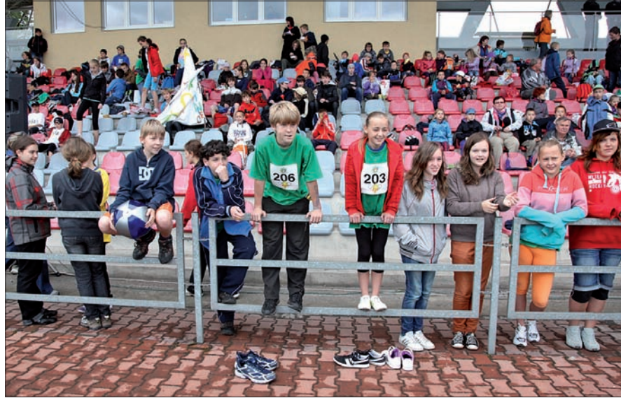
Dopingują swoich. Kto najlepszy?