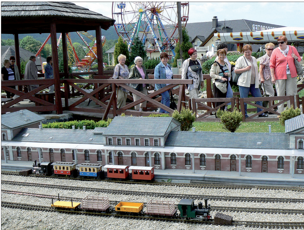
Czeskokoczyński element krajobrazu w Inwaldzie.