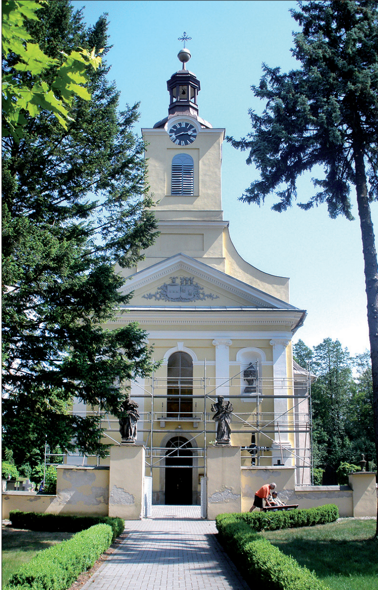
W Ropicy są dwa budynki wpisane na listę zabytków. Jednym z nich jest kościół katolicki, który właśnie przechodzi remont.