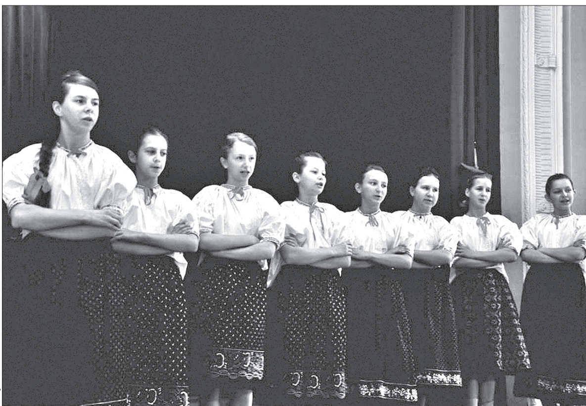
Na scenie zespół wokalny Polskiej Szkoły Podstawowej w Gnojniku.