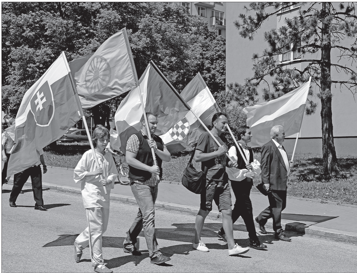
Festiwalowy korowód zmierza w kierunku orłowskiego amfiteatru.

Festiwal Kultur Narodowych wpisali się w kalendarz sztandarowych imprez miasta Orłowej, w którym bierze udział coraz więcej osób. Z powodu bardzo wysokich