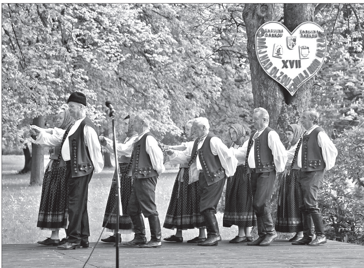
W niedzielę 6 maja organizatorzy „Maja nad Olzą” zaprosili do Darkowa m.in. Zespół Folklorystyczny „Odra” Sokół Witkowiec.

Warto dodać, że w najbliższą niedzielę, 13 maja, będziemy mogli się w Darkowie bawić przy dźwiękach orkiestry dętej „Naladicka” Bronisława Palowskiego z Suchej Górnjej. Wystąpi też Zespół Regionalny „Strumień” ze Strumienia. (kor)