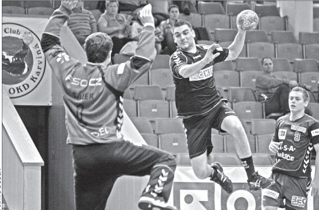
Banik Karwina pokonał u siebie Lowosice, umacniając się na brązowej pozycji w tabeli.