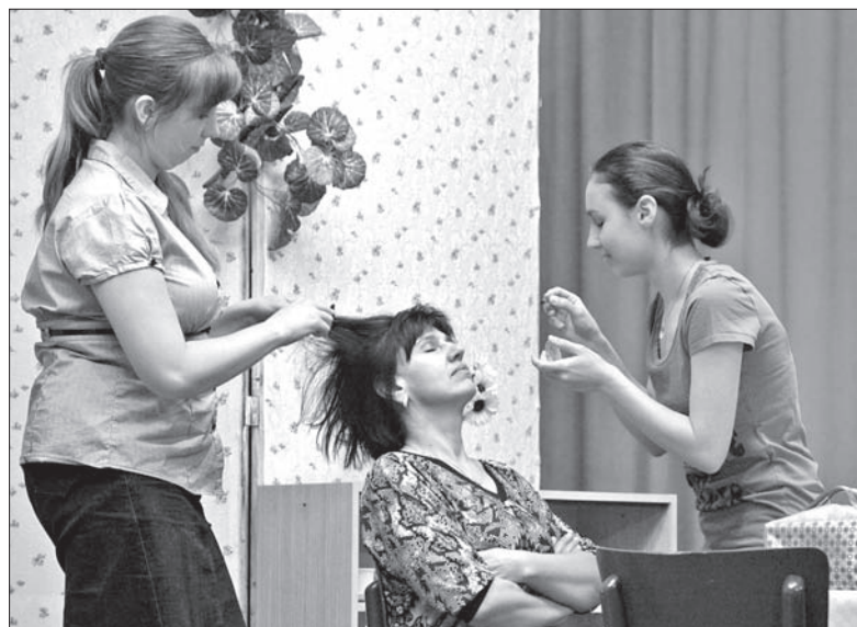
Jedna ze scen z komedii „W sieci” autorstwa Izabeli Kraus-Żur.

Krótki skecz Izabeli Kraus-Żur, o tym, jakie niespodzianki może przy-