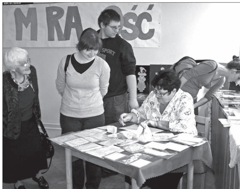
Na wystawie w Trzyńcu-Podlesiu można było podziwiać m.in. prace Wandy Orawskiej.