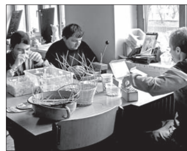
Klienci warsztatów Eben-Ezer podczas zajęć.