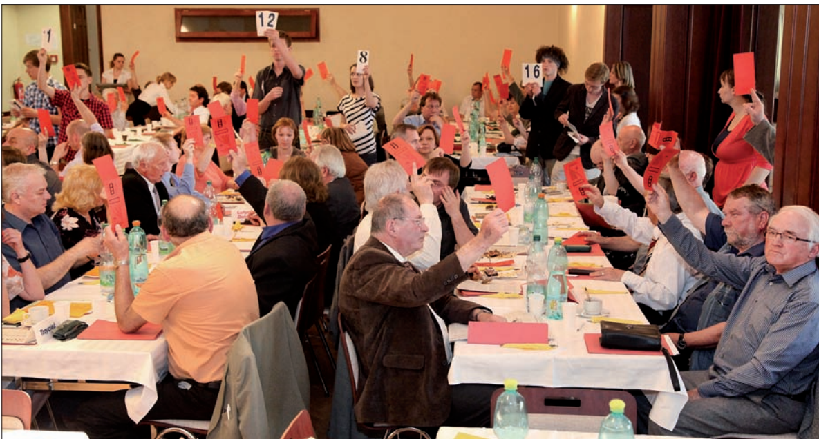
„Jestem za, a nawet przeciw...”