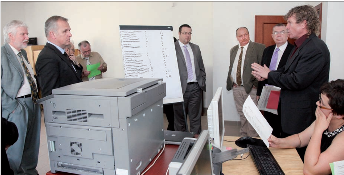
Gorączkowe podliczanie głosów.