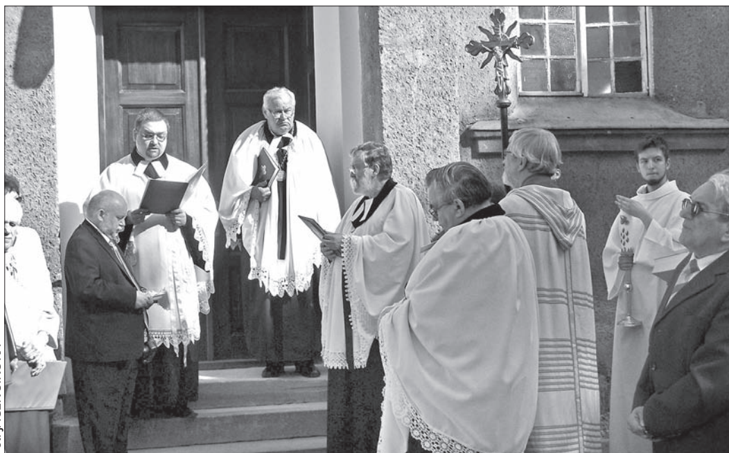
Z uroczystości poświęcenia świątyni pod wezwaniem Zmartwychwstania Pańskiego Luterskiego Ewangelickiego Kościoła Augsburgskiego Wyznania w Czeskim Cieszynie (wtorek 1 maja).