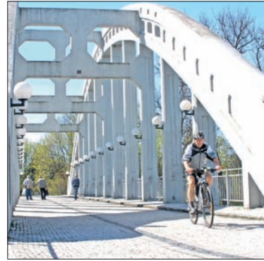
Most Darkowski łączy dwie części Darkowa: tę, do której zjeżdżają goście z bliska i z daleka oraz tę skazaną na powolną zagładę.

Jednym z ładniejszych miejsc jest rynek we Frysztacie – z zamkiem i kościołem parafialnym, gdzie dwa lata temu odkryto średniowieczne freski. Tu mieści się również filia Biblioteki Regionalnej, a w niej Oddział Literatury Polskiej. To jedno z miejsc, gdzie koncentruje się polskie życie kulturalne. Odbywają się tu liczne imprezy