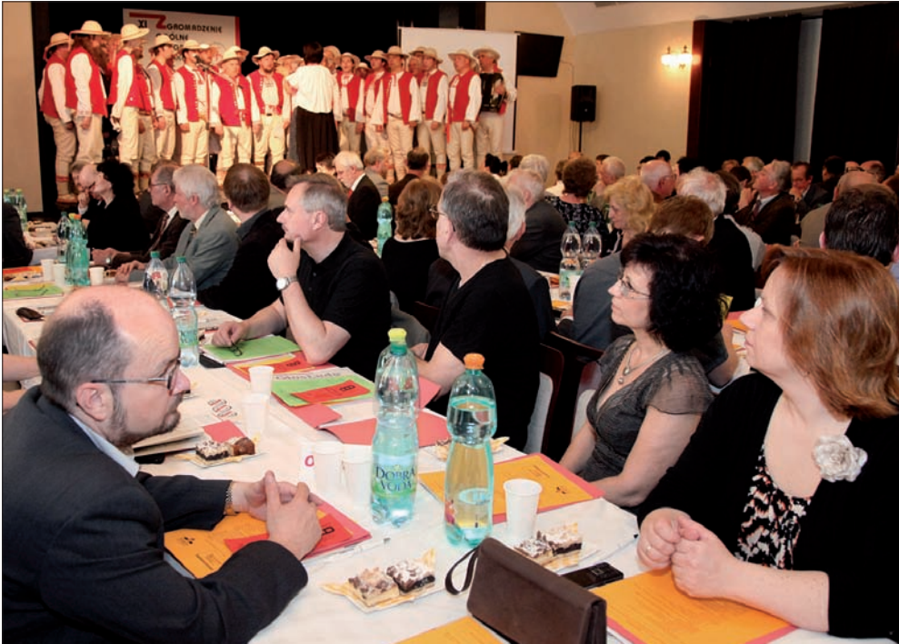
Obrady zainaugurował pieśnią „Gaude Mater Polonia” chór „Gorol” MK PZKO w Jabłonkowie.