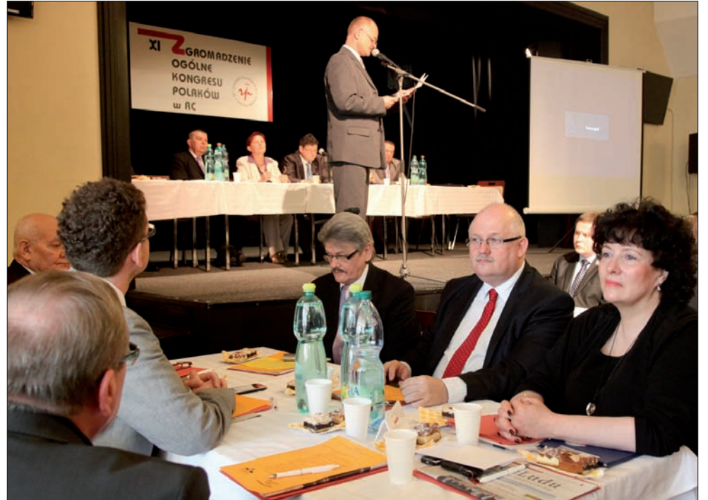
Stolik gości. Głos zabrał m.in. senator Petr Gawlas.