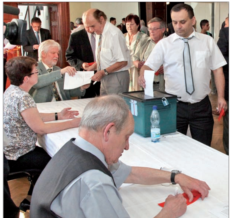
Punkt kulminacyjny – wybory nowej Rady Kongresu.