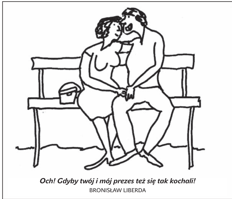
Och! Gdyby twój i mój prezes też się tak kochali!

W tegorocznej edycji festiwalu nie zabraknie także „Gulaszu VIP-ów”, który goście ugotują w kotle na ognisku. Dochód z jego sprzedaży zostanie przekazany na cele charytatywne. (maki)