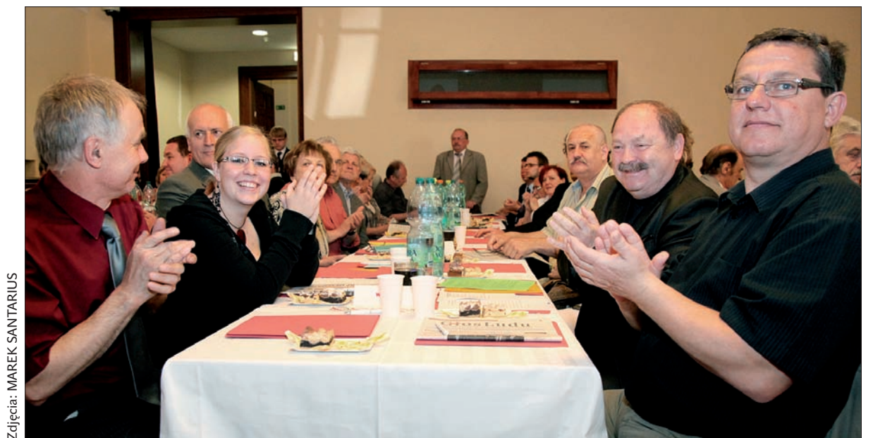
Pierwsze brawa dla nowej Rady Kongresu Polaków w Republice Czeskiej.