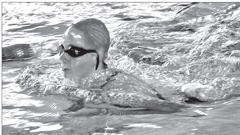
W zawodach brali udział także wyczynowi sportowcy.

– Przyznam się, że jestem zwolennikiem lansowania idei sportu dla wszystkich. Młodzież ma obecnie coraz większy problem z tym, aby przejechać się na rowerze, czy przebiec jakiś dystans. Powiększa się zatem różnica pomiędzy dziećmi, które zajmują się sportem wyczynowo, a tymi pozostałymi. Staram się hamować ten proces. Dzisiejsze zawody są namacalnym przykładem tego, że oprócz mistrzów bierze w zawodach udział również młodzież, której pływanie po prostu sprawia przyjem-