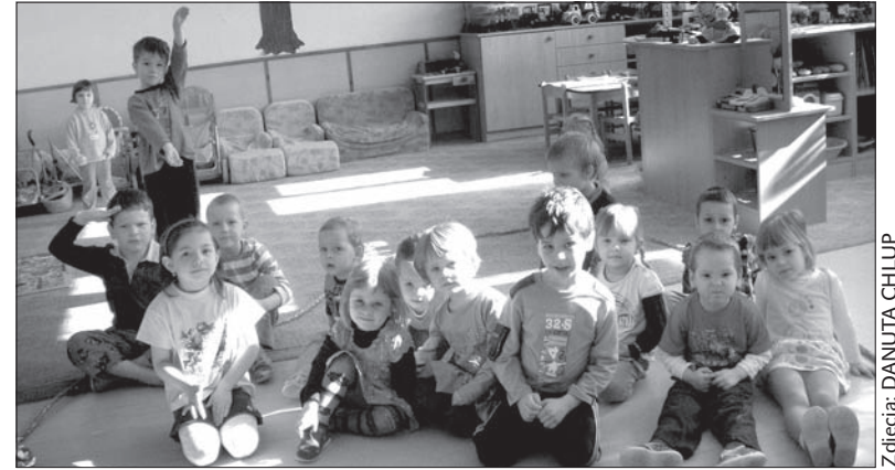
Przedszkolaki z Cierlicka w „wiosennej” zabawie w żabki i bociana.