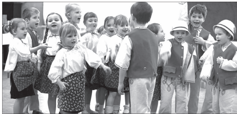
Widowisko ludowe „Na miedzy” w wykonaniu przedszkolaków z ul. Grabińskiej.