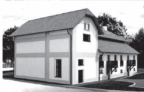
Gotowa jest koncepcja przebudowy spichlerza.

Kossaków”. – Naszym głównym celem jest uzupełnienie oferty dla gości odwiedzających Górkę Wielką. Oferujemy do zwiedzania muzeum mojej babci, są noclegi, mamy gdzie przeprowa-