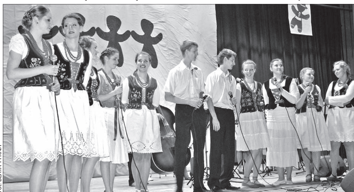
W artystycznej części programu wystąpił Międzywydziałowy Zespół Folkowy „FolkUS” działający na cieszyńskiej uczelni.

W poniedziałek do Cieszyna zjechała ponad setka studentów etnologii z 15 ośrodków akademickich Grupy Wyszehradzkiej. I Międzynarodowy Zjazd Studentów Etnologii i Antropologii Kulturowej Europy Środkowej „Etnologia bez granic” rozpoczął uroczysty otwarty wykład inauguracyjny w auli Uniwersytetu Śląskiego w Cieszynie. Wieczorem natomiast integracji sprzyjało zorganizowane w klubie akademickim „Panopticum” folk party. Kolejne dni wypełnią studentom konferencje, na które przygotowali fachowe referaty, zwiedzanie Cieszyna w formie gry terenowej i liczne, przygotowane przez żaków warsztaty. Cały czas można też oglądać wystawę, na której studenci z poszczególnych uczelni prezentują swe osiągnięcia i bieżącą działalność ich ośrodków.