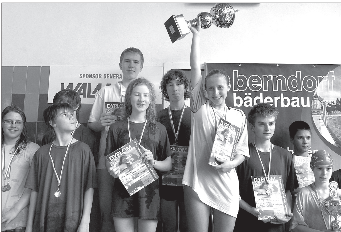
Zwycięska sztafeta z Czeskiego Cieszyna.