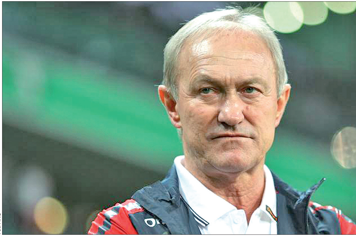
Franciszek Smuda jest już zmęczony tematem afery alkoholowej Sławomira Peszki.

Przed mistrzostwami Europy warto jednak promować pozytywny wizerunek polskiej piłki, dlatego drugie nasze pytanie dotyczyło rewelacyjnego Roberta Lewandowskiego. – Robert potwierdził formę z całego sezonu, jest kluczowym napastnikiem Borussia Dortmund – ocenił Smuda. Lewandowski rozstrzygnął na korzyść Borussia szlagier środowiska kolejkowego w Bundeslidze, strzelając jedyną bramkę meczu. Zespół Dortmundu umocnił się na czele tabeli Bundesligi i zmierza po ósmy w historii mistrzowski tytuł. Jeżeli Lewandowski utrzyma formę do europejskiego czempionatu, może być jedną z gwiazd całego turnieju. Niemiecki