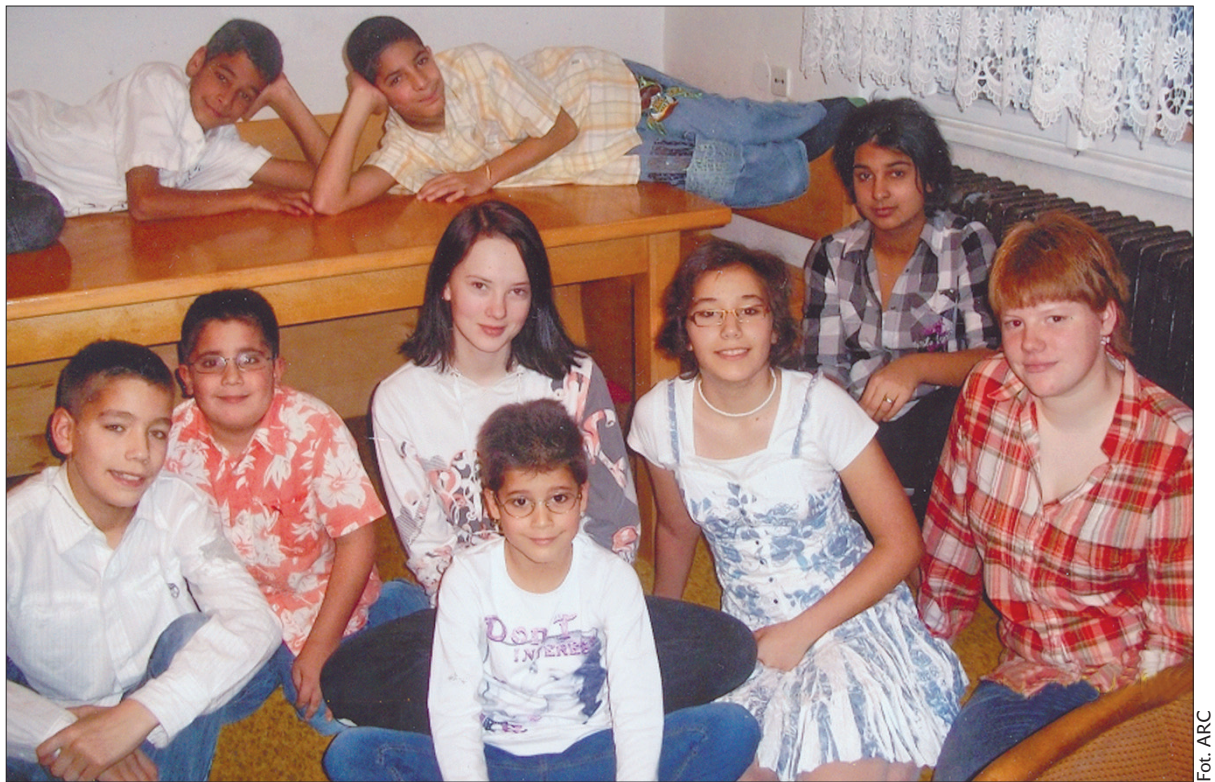
Dziewięcioro dzieci w komplecie.