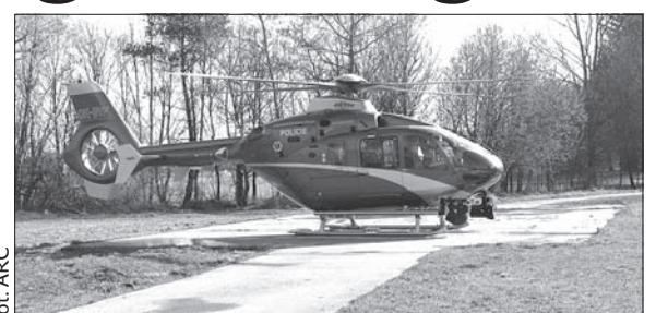
Śmigłowiec Powiatowej Komendy Policji.

– Dozwoloną prędkość przekroczyło 19 kierowców