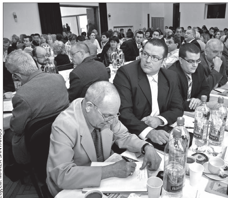
Ze Zgromadzenia Ogólnego sprzed czterech lat.