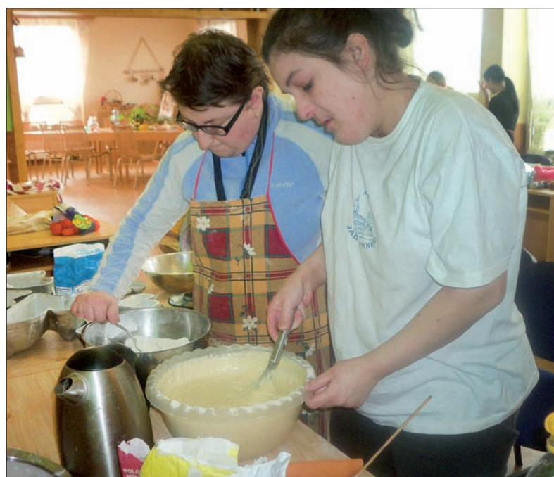
Klienci Ośrodka Dziennego św. Józefa w Jabłonkowie pieką baranki.