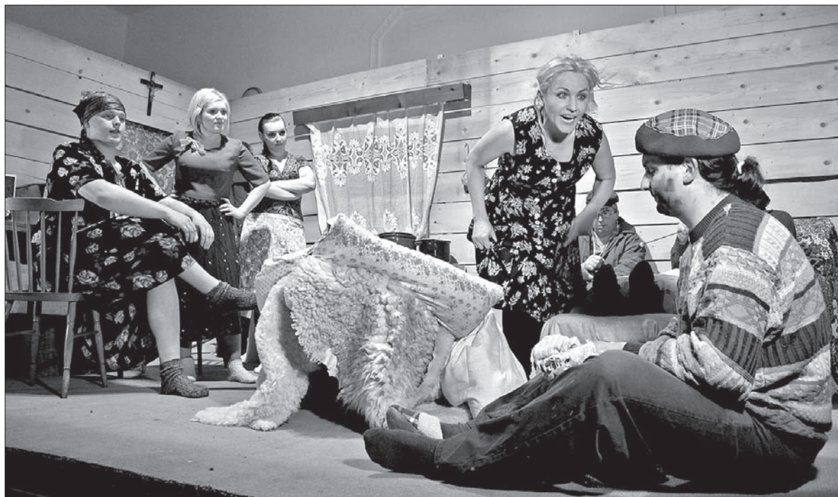
Scena finałowa: Baby górą!