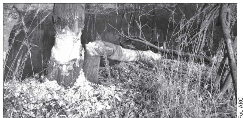
To dzieło zębów bobra.

miejscach, w których zwykli łowić ryby. Często muszą też zbiorniki bobrów likwidować. W dodatku bobry likwidują drzewa, które wcześniej wysadzaliśmy w ramach rewitalizacji terenów objętych szkodami górnictwami – podkreśla wójt Feber. – Bobry świetnie się czują na wszystkich terenach objętych rewitalizacją. Swoje domostwa budują zwłaszcza między hałdami – dodaje. (kor)