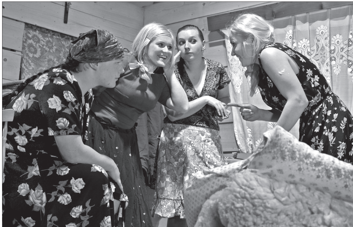
A gdybyście, baby, wiedziały...