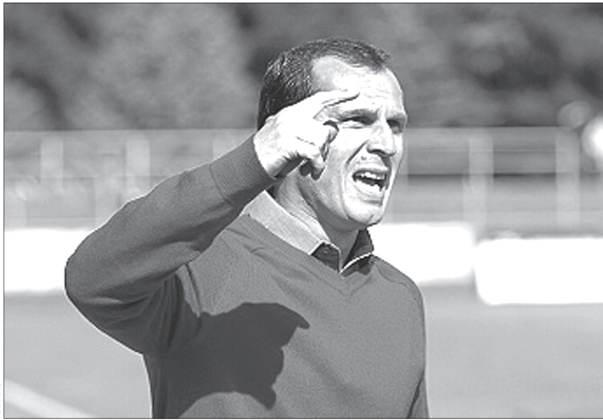
Fot. ARC Radoslav Látal

Niewykluczone, że Látal w meczu z Pilznom zdecyduje się na drobne zmiany w wyjściowej jedenastce.