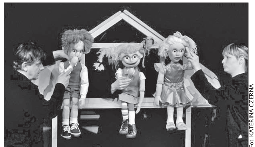
Ze spektaklu „Pippi Pończoszanka”.