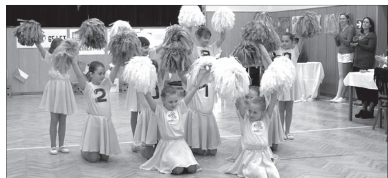
Euro 2012 w Cierlicku.