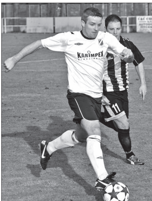
W zaoziankich derbach ze zwycięstwa 3:0 radowali się piłkarze Czeskiego Cieszyna.