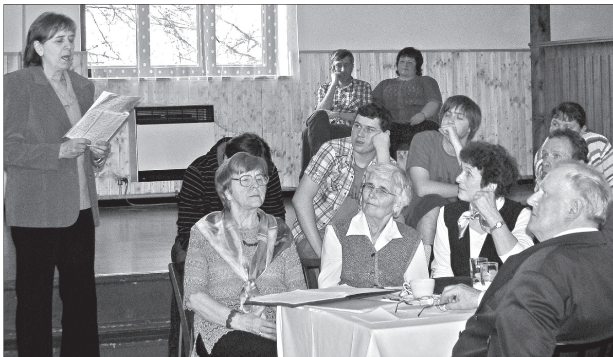
Prezentacji wszyscy słuchali uważnie.