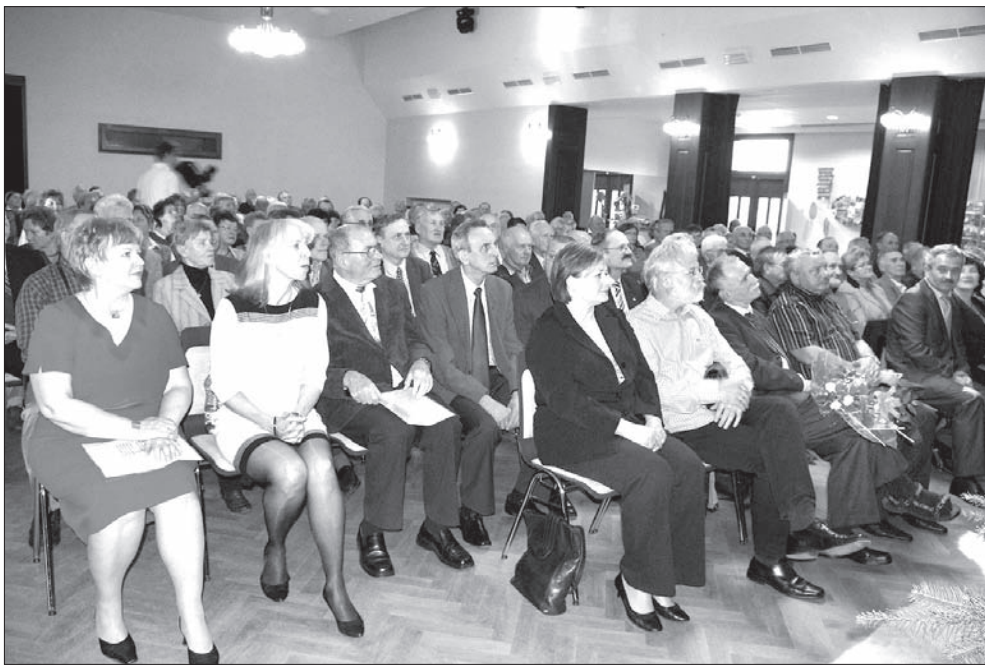
Jubileusz przyciągnął do „Strzelnicy” bardzo dużo gości.