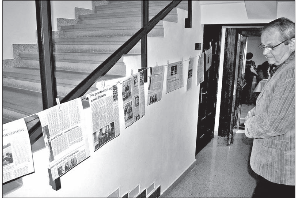
„Głos Ludu” sporo pisał o „Beskidzie Śląskim”. Gości wchodzących na jubileuszową wystawę witały kserokopie niektórych artykułów.