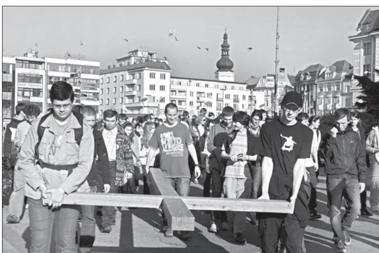
Uczestnicy spotkania z biskupem diecezji ostrawsko-opawskiej niosą krzyż ulicami Ostrawy.

Program dla młodzieży rozpoczął się w piątek wieczorem w Gimnazjum Biskupskim w Ostrawie-Porubie, skąd młodzież udała się do dwóch kościołów, aby przy akompaniamencie muzyki wspólnie się modlić. Właściwe spotkanie z biskupem odbyło się w sobotę w katedrze Boskiego Zbawiciela w centrum Ostrawy. – Młodzież miała okazję wysłuchać katechezy młodego księdza oraz osobistego świadectwa siostry zakonnej. Następnie mogła wybierać z trzech propozycji wykładów