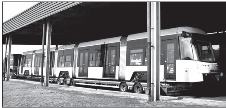
Tramwaje znowu można było zobaczyć w Cieszynie. Choć niestety już nie na szynach. Często tak się zdarza, jak wczoraj na przejściu granicznym, że z Bydgoskiej Fabryki Pojazdów Szynowych Pesa można zobaczyć transportowane tramwaje na Węgry. Właśnie taki tramwaj stał wczoraj na przejściu granicznym w Cieszynie-Boguszowicach.

Frontman „Charlie Straight” sam pisze teksty i komponuje muzykę. Swoje teksty określa jako „za bardzo autobiograficzne”, które pisze po to, żeby „zachować przeżycie, cenne przeżycie, do którego można później wracać”. Jego zespół właśnie wydał nową płytę. Kto natomiast chciałby posłuchać „Charlie Straight” na żywo, ma taką okazję w najbliższą środę 28 marca na koncercie w ostrawskim klubie „Fabric”. (sch)