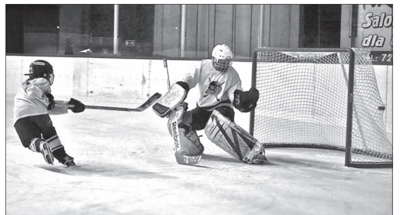
Uczniowie zmierzili się w hokeju z rodzicami i nauczycielami.