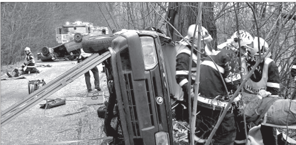
Ćwiczenie odbywało się na starej drodze pomiędzy Czeskim Cieszynem a Trzyńcem.

skomplikowanych warunkach wyciągnąć z wozów kilka osób, a także udzielić im pierwszej pomocy, ponieważ pogotowie ratunkowe nie brało udziału w ćwiczeniu. Wśród dziesięciu osób, które pozorowały rannych, znajdowało się również dwoje dzieci. (dc)