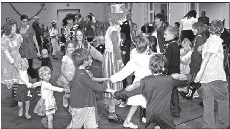
Zabawa z klaunami z Dziegielowa.