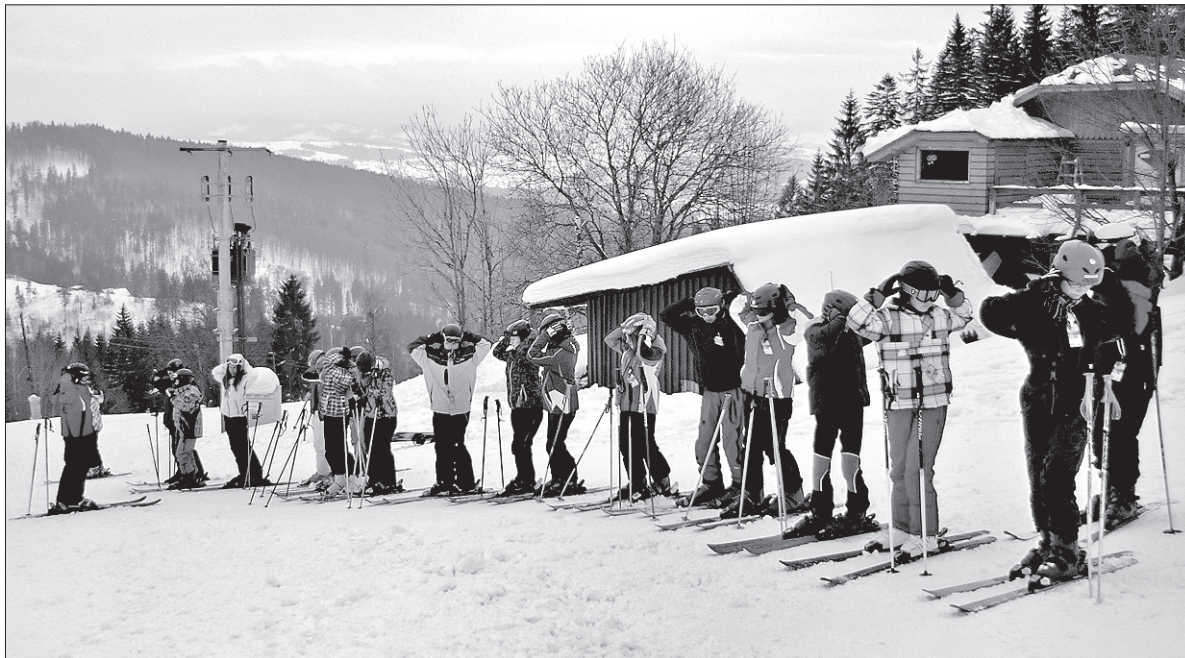
Poranna rozgrzewka w „pięknych okolicznościach przyrody” na Baginiecu.

W międzyczasie instruktorzy przygotowują trasę slalomową. Po chwili