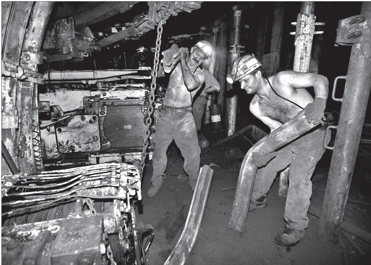
Górnicy chcą, by ich wynagrodzenia wzrosły przynajmniej o odsetek inflacji.