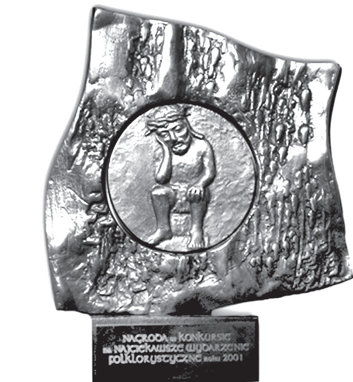
Nagroda dla laureatów „Ludowych Oskarów” oraz statuetka filmowego Oscara.

Petycja została bardzo szybko rozpowszechniona za pośrednictwem poczty elektronicznej oraz portali społecznościowych. – Słyszałem o tej sprawie i właśnie dziś podpisałem petycję, która broni „Ludowych Oskarów”. Zarzuty są według mnie śmieszne. Jak można zakwestionować nazwę konkursu, w której pojawia się imię Oskara. Słyszałem, że w Polsce istnieje takich nagród aż 30. A w dodatku istnieje mnóstwo nazw zawierających czyjeś imię. Nie wiem, dlaczego przyczepili się akurat do „Ludowych Oskarów”. Mimo wszystko uważam, że sprawa zostanie rozwiązana pozytywnie. Akademia Filmowa chyba do końca nie