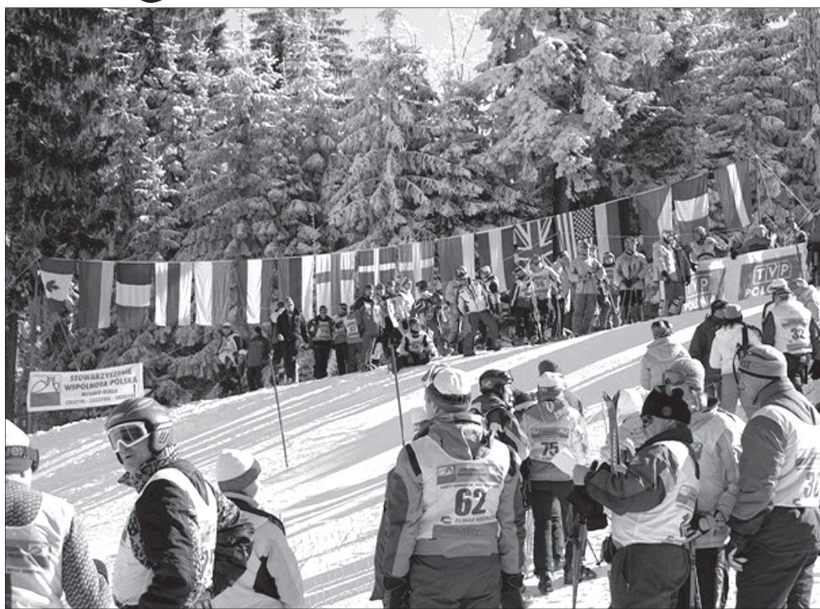
Sportowa rywalizacja jest ważna, ale jeszcze ważniejsze jest spotkanie Polaków z całego świata.

jedzie 600 Polaków z całego świata. Najliczniejsze reprezentacje przyjadą do Szczyrku, który jest bazą Igrzysk, z Litwy (82 osoby), Rosji (75), Ukrainy (70) i Kanady (69). Także Zaolzie wystawi mocną reprezentację.