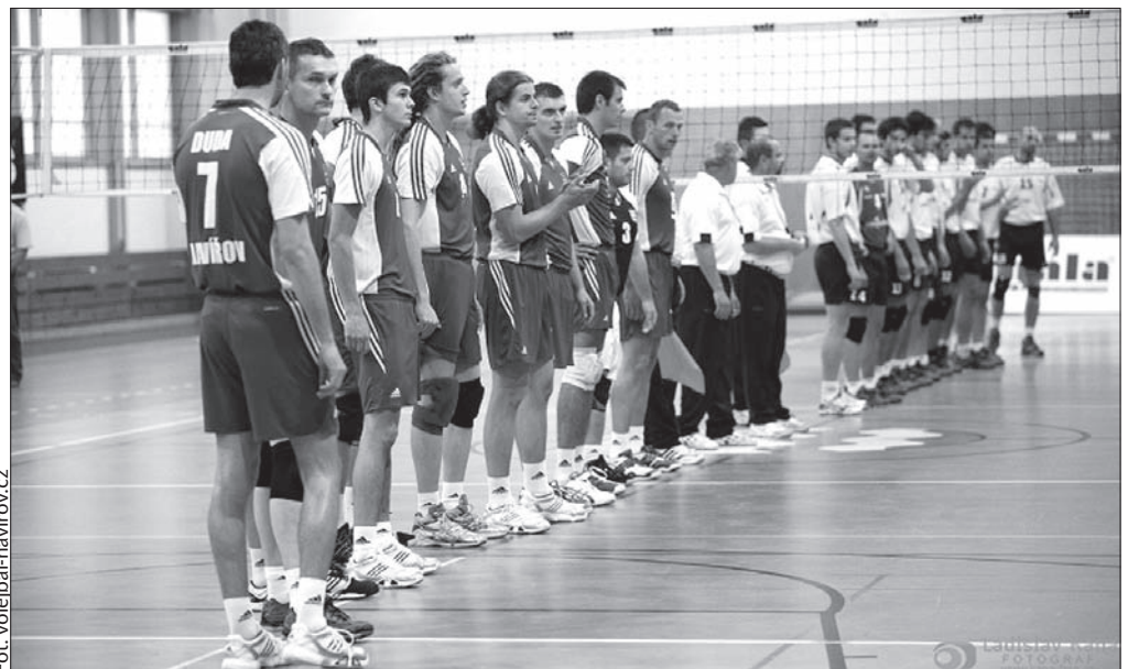
Siatkarze Slavii Hawierzów zajmują w tabeli dziewiątą lokatę.

Najbliższy mecz przed własną publicznością zaliczą siatkarze Hawierzowa 1 marca. Rywalem będzie zespół Czeskich Budziejowic. (jb)