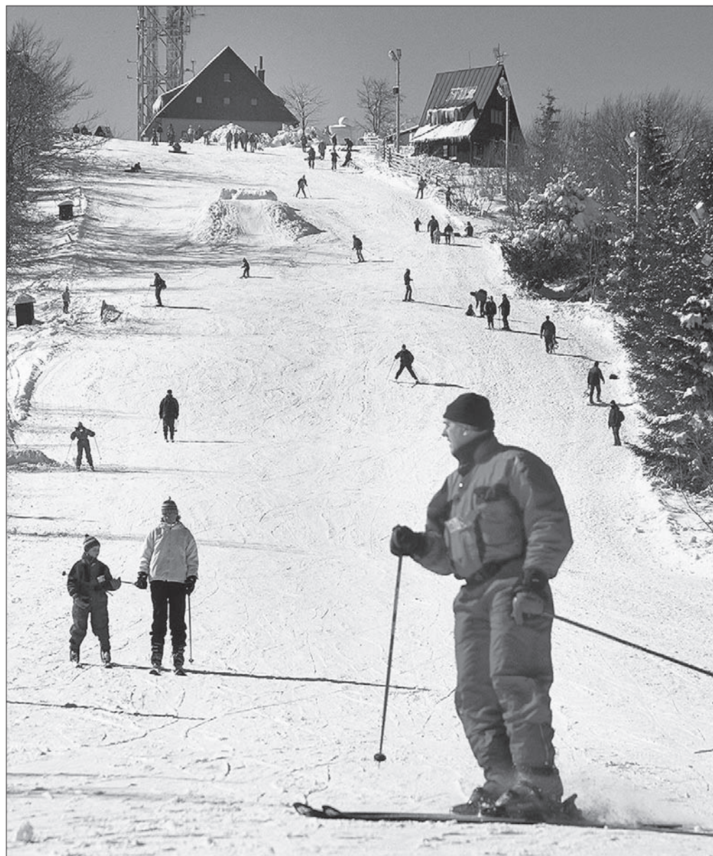
Nartostrada na Jaworowym.