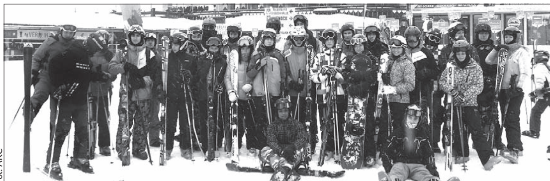
Grupowe zdjęcie uczestników obozu narciarskiego w Alpach.