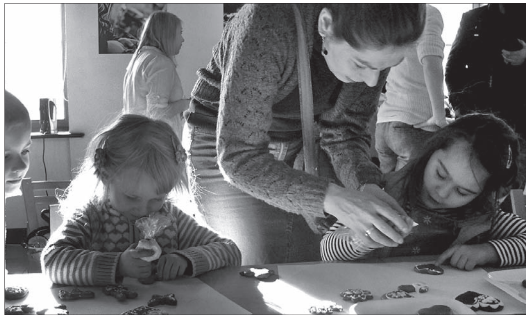
Pomysł na walentynkę prosto z Zamku – miodowe pierniczki.