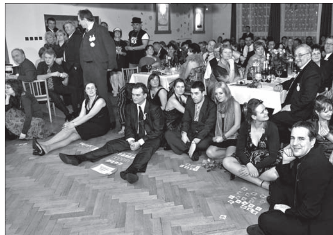
W oczekiwaniu na wyniki loterii. Kto wygra laptopa?