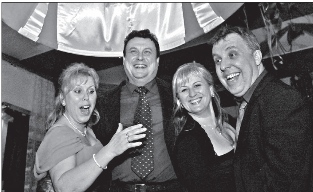
Taniec pod dzwonem. Na którą parę dzwon opadnie następnym razem?