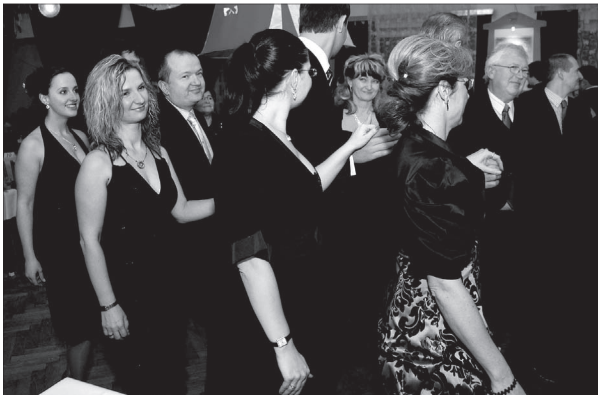
Każdy polski bal musi się zacząć od poloneza.