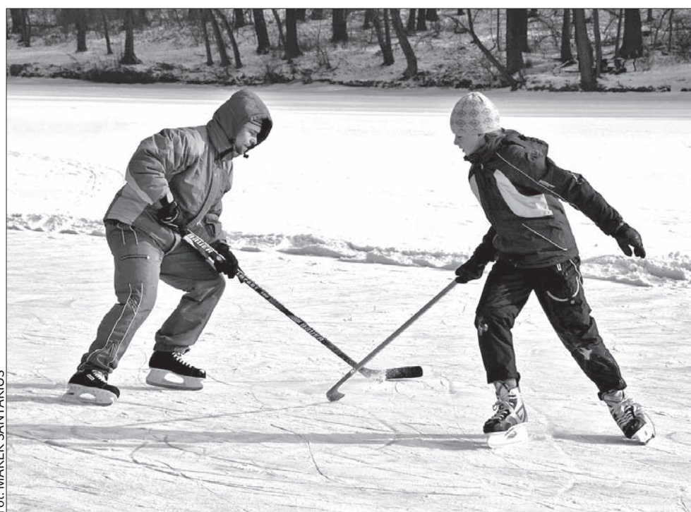
Mroźna zima sprzyja sportom na stawach i zaporach wodnych.

– Na Lipnie utrzymuje lodowisko stowarzyszenie obywatelskie, nie zarząd gospodarki wodnej. Naszym zadaniem nie jest rekreacyjne wykorzystanie zapór wodnych. Zgodnie z