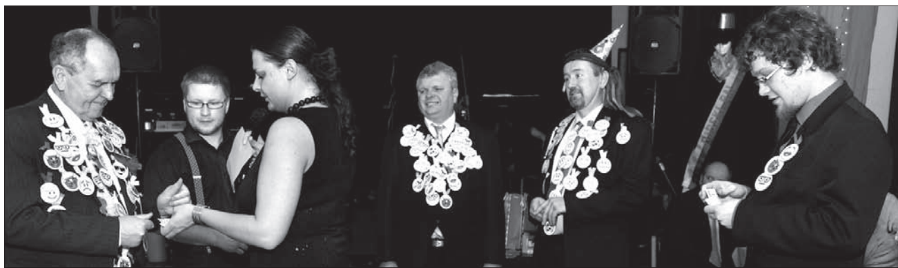
Podliczanie kotylionów i talonów za całowanie pod dzwonem. Kto będzie Lwem Salonu?