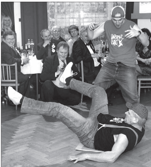
Panowie tańczyli w stylu hip-hop.