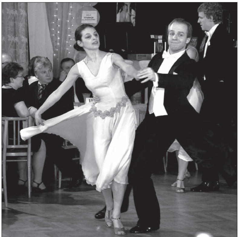
Walc wiedeński w wykonaniu ZPiT „Olza”.