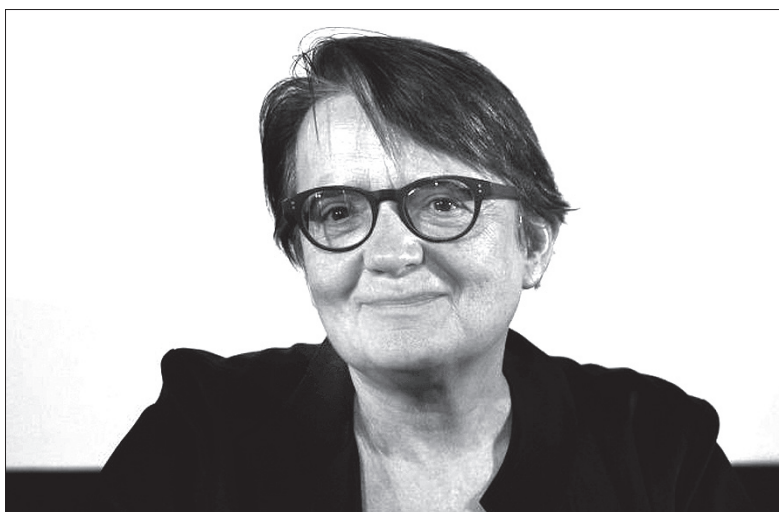
Polska reżyser Agnieszka Holland

Jak poinformowała reżyser, zdjęcia mają rozpocząć się w marcu. – Byłam w 1969 roku studentką szkoły filmowej w Pradze. Wszystko, o czym opowiada scenariusz, przeżyłam bardzo aktywnie. Jest to więc dla mnie ważna historia również z przyczyn osobistych. Cieszę się, że tym szalenie istotnym wydarzeniem i okresem zainteresowali się młodzi twórcy czescy. Scenarzysta i producenci mają