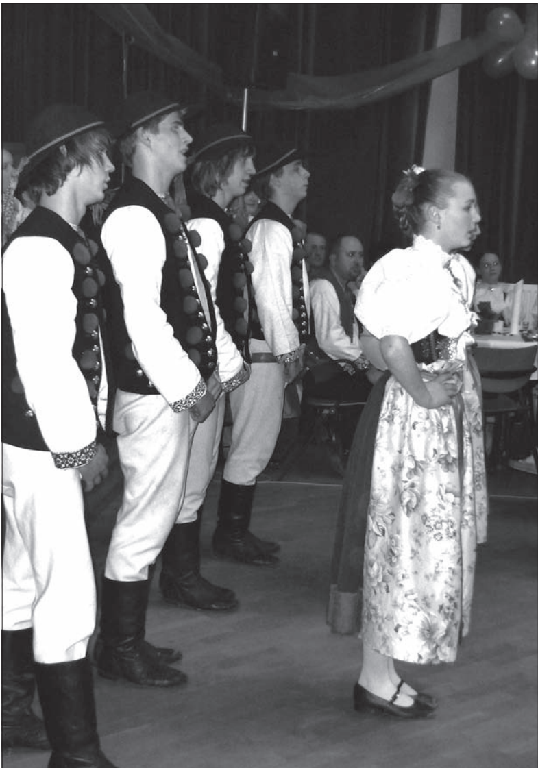
Młodzież z „Równicy” podczas estrady.