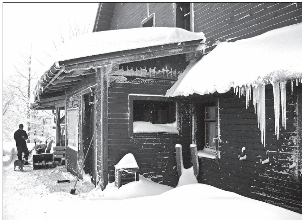
Zima szczególnie malowniczo wygląda w górach. Na Błatniej w Beskidzie Śląskim w niedzielę pokrywa śnieżna przekroczyła pół metra. Turyści nie mieli problemów z dotarciem do schroniska.