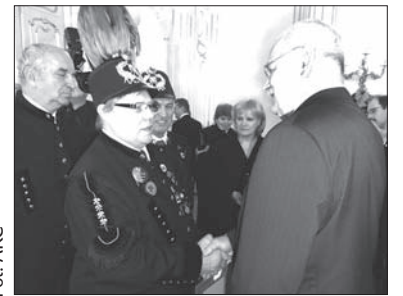
Delegacja Klubu Umundurowanych Górników ze Stonawy u prezydenta Ivana Gašparoviča.