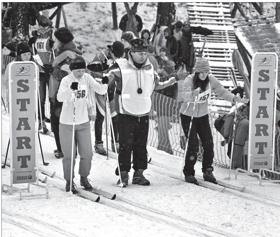
W ramach Zjazdu Gwiazdzistego narciarze rywalizują też na biegówkach.

Lutowy termin zawodów oprócz nadziei na śnieg niesie z sobą również nadzieję na dobre przygotowanie uczniów do zmagania narciarskich. Jak zdążyliśmy się zorientować, już teraz wiele szkół ma sprecyzowane plany treningów przedzjazdowych, a uczniowie z powiatu karwińskiego, jeszcze zanim staną na starcie, zaliczą tydzień ferii zimowych, często połączonych z rodzinnymi wyjazdami w góry. Krótko mówiąc: późniejszy termin