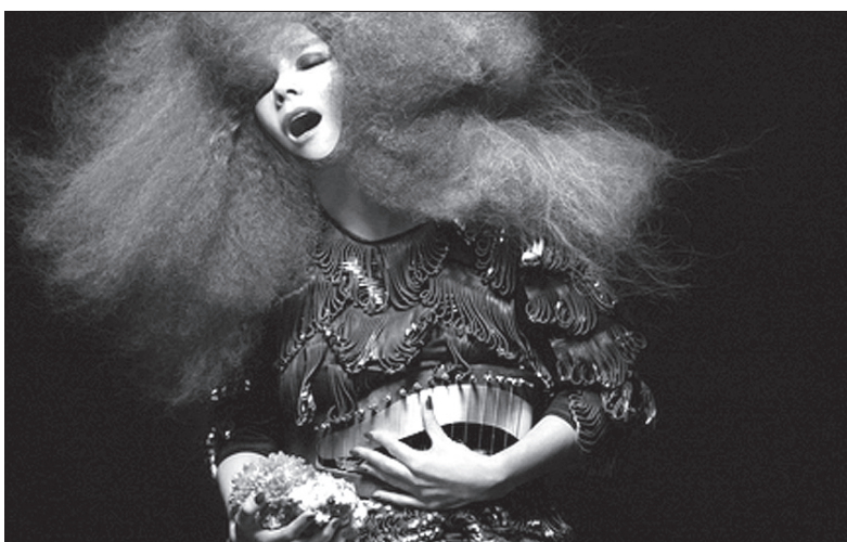
Björk lubi szokować na scenie.

Ostrava potwierdzili też artyści z innych półek stylistycznych. Najświeższym nabytkiem festiwalu został libanoński trębacz jazzowy Ibrahim Maalouf, znany ze współpracy z takimi sławami, jak Sting, Erik Truffaz czy Elvis Costello. Na swoich płytach artysta łączy jazz z hip hopem, rockiem, a nawet metalem. Na spełnionej liście