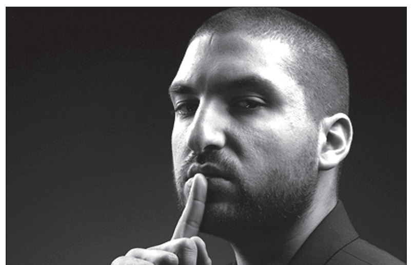
Ibrahim Maalouf - jazzowa gwiazda festiwalu.

zyczeń znalazły się też grupy Kronos Quartet i The Flaming Lips. Amerykański kwartet smyczkowy Kronos Quartet wystąpi na Colours wraz z fińskim akordeonistą Kimmo Pohjonenem, który w Ostrawie dał już koncert dwa lata temu w ramach swojego rockowego projektu KTU. Do gwiazd jedenastej edycji