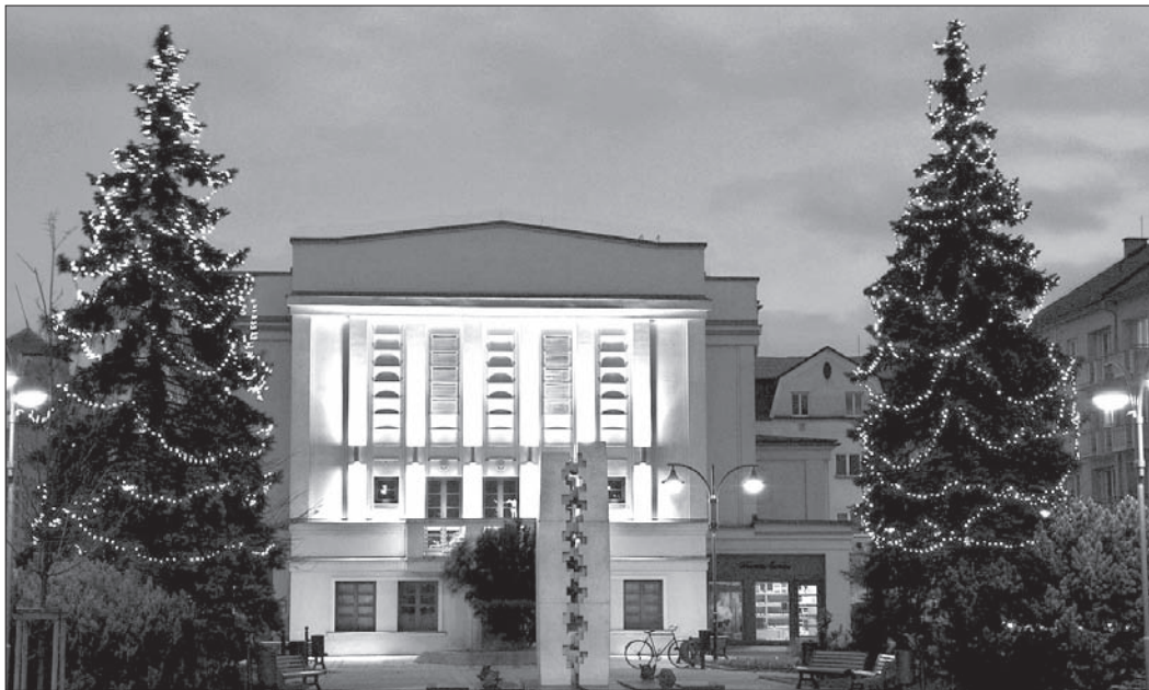
Bogumińskie choinki – bliźniaczki „zarobiły” na ozdoby dla nowej „kolezanki”.